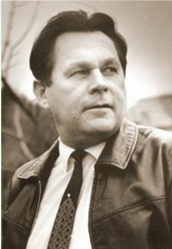
Андрей Егорович Макаёнок (1920–1982)

По признанию Ивана Шамякина, идея написать произведение об архитекторах возникла у него во время участия в заседании бюро ЦК КПБ.