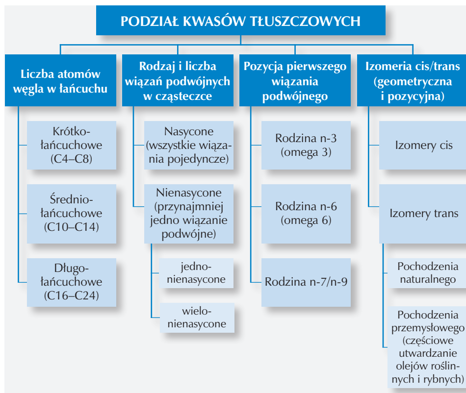
Ryc. 1. Podział kwasów tłuszczowych

mania funkcji życiowych organizmu (3). Jeden gram tłuszczu dostarcza około 9 kcal, a więc ponad dwa razy więcej niż taka sama ilość białka lub węglowodanów. U człowieka o prawidłowej masie ciała niemal 150 razy więcej energii zmagazynowane jest w postaci tłuszczu niż w postaci węglowodanów. W organizmie osoby dorosłej tłuszcz zapasowy występuje w ilości od kilku do kilkunastu kilogramów (3), przeciętnie jest to 12 kg. Tłuszcz zapasowy stanowi źródło energii około 110 000 kcal, co umożliwia przeżycie około 3 miesięcy bez pożywienia stałego. Ważną funkcją tkanki tłuszczowej jest również wytwarzanie cząsteczek biologicznie czynnych, tzw. adipokin m.in. leptyny, której główną funkcją jest regulacja apetytu oraz adiponektyny, która związana jest z wrażliwością komórek wątroby oraz mięśni na insulinę (3).