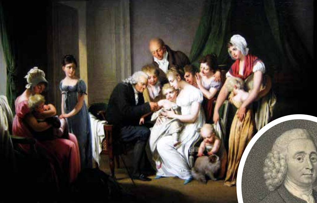
▲ Прививка от оспы

и весьма курьезное зрелище. Но вот появляются Пастер и Кох, которые снимают с глаз человечества очередную «повязку заблуждений». Оказывается, значительная часть этих, на первый взгляд совершенно безобидных «зверушек», является болезнетворными микробами. И именно они были виновниками возникновения и распространения всех эпидемических заболеваний, от которых с незапамятных времен жестоко страдало все человечество! Началась непримиримая борьба со вновь открытыми врагами, которая с переменным успехом продолжается до наших дней.