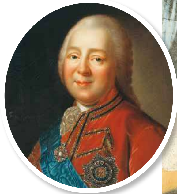
▲ «Оберегатель императрицы от дурных поступков» Никита Панин