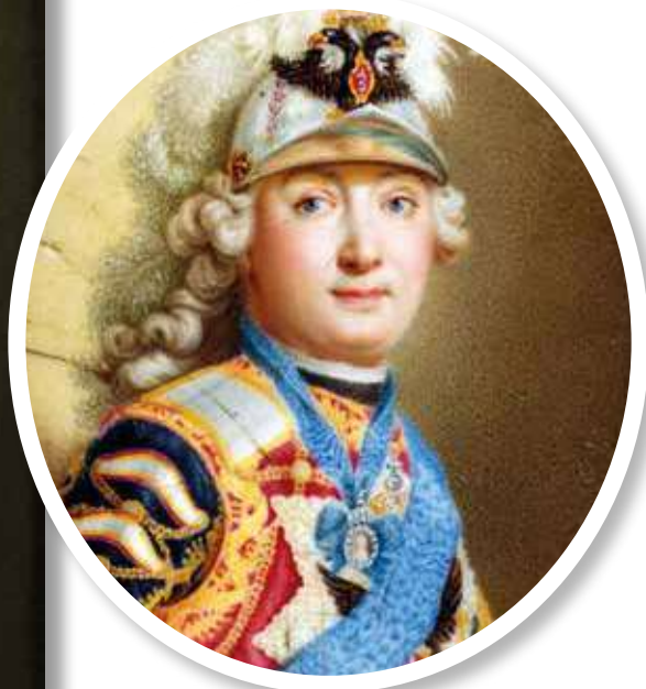
▲ Григорий Орлов