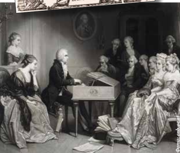
▲ Моцарт в Вене