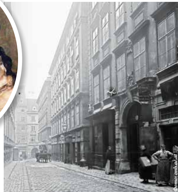
▲ Переулок Грюнангергассе. Здесь, в доме №10, проживало семейство Хофдемелей и Моцарт был частым гостем