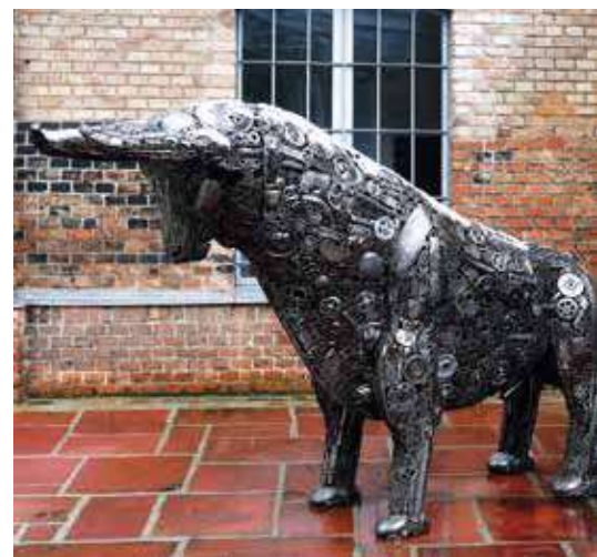
Диана Видра