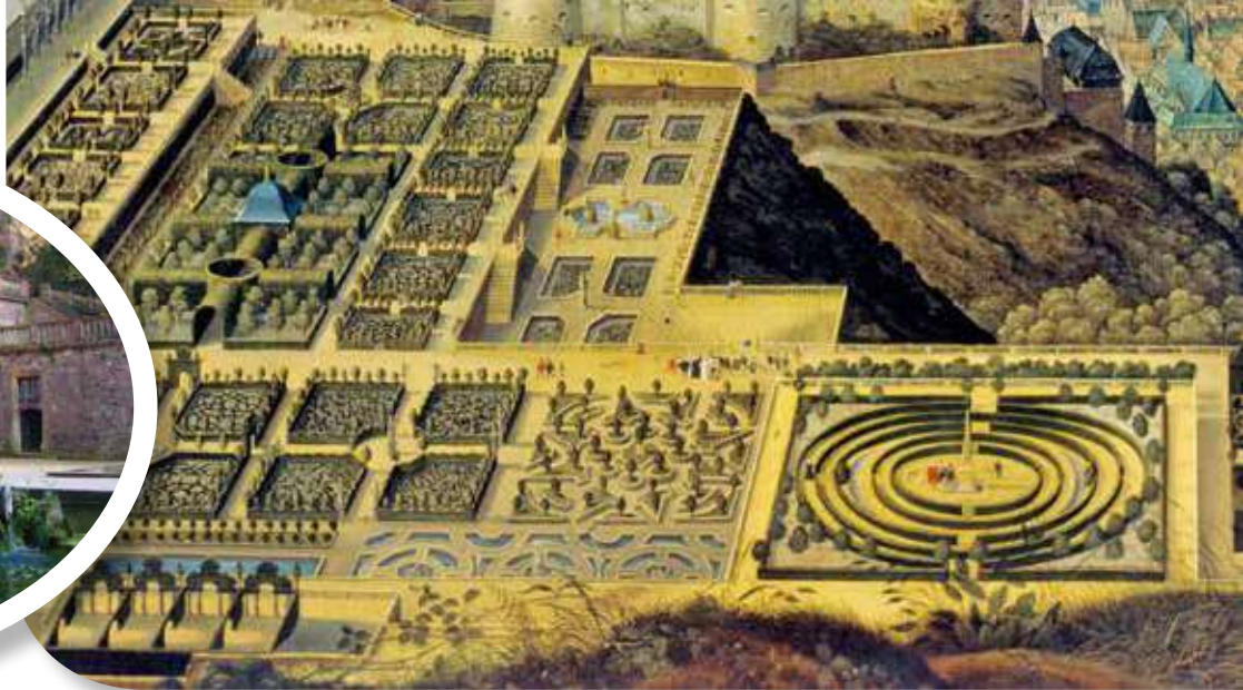
▲ На картинке видны легендарные террасные сады Хайдельбергского замка