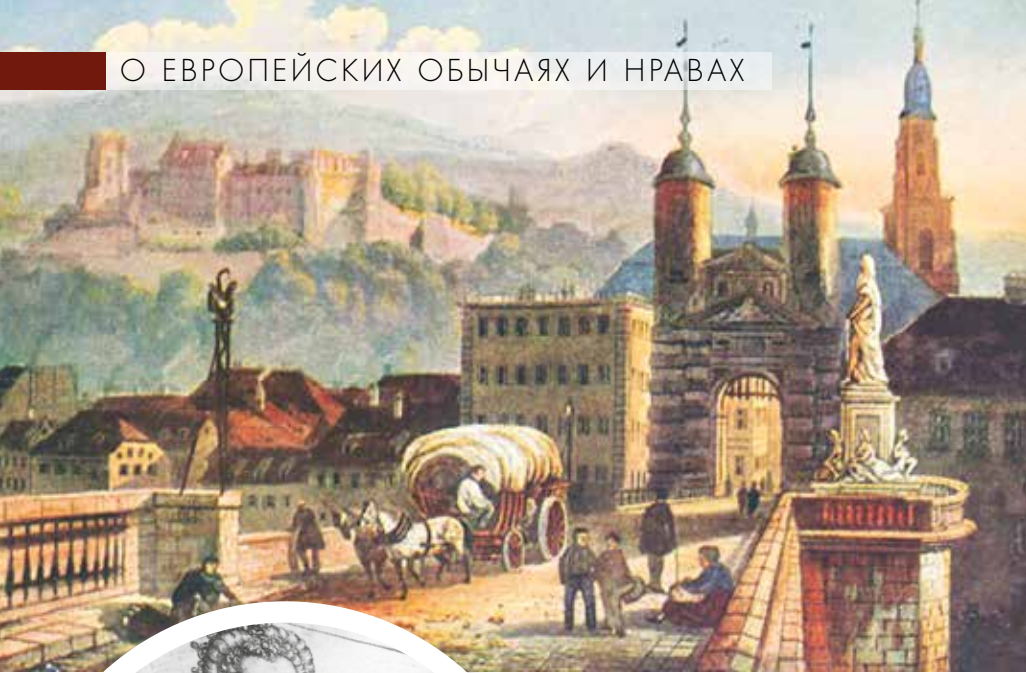
◀ Элизабет с первенцем Генрихом Фридрихом