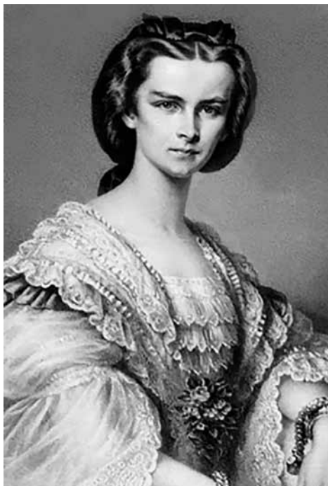
▲ Елена, старшая сестра Елизаветы

Император предложил Елизавете погулять по парку. С прогулки он вернулся сияющий и сразу же объявил матери о своем намерении жениться на принцессе, которой было всего шестнадцать лет. «Я влюблен, как лейтенант,