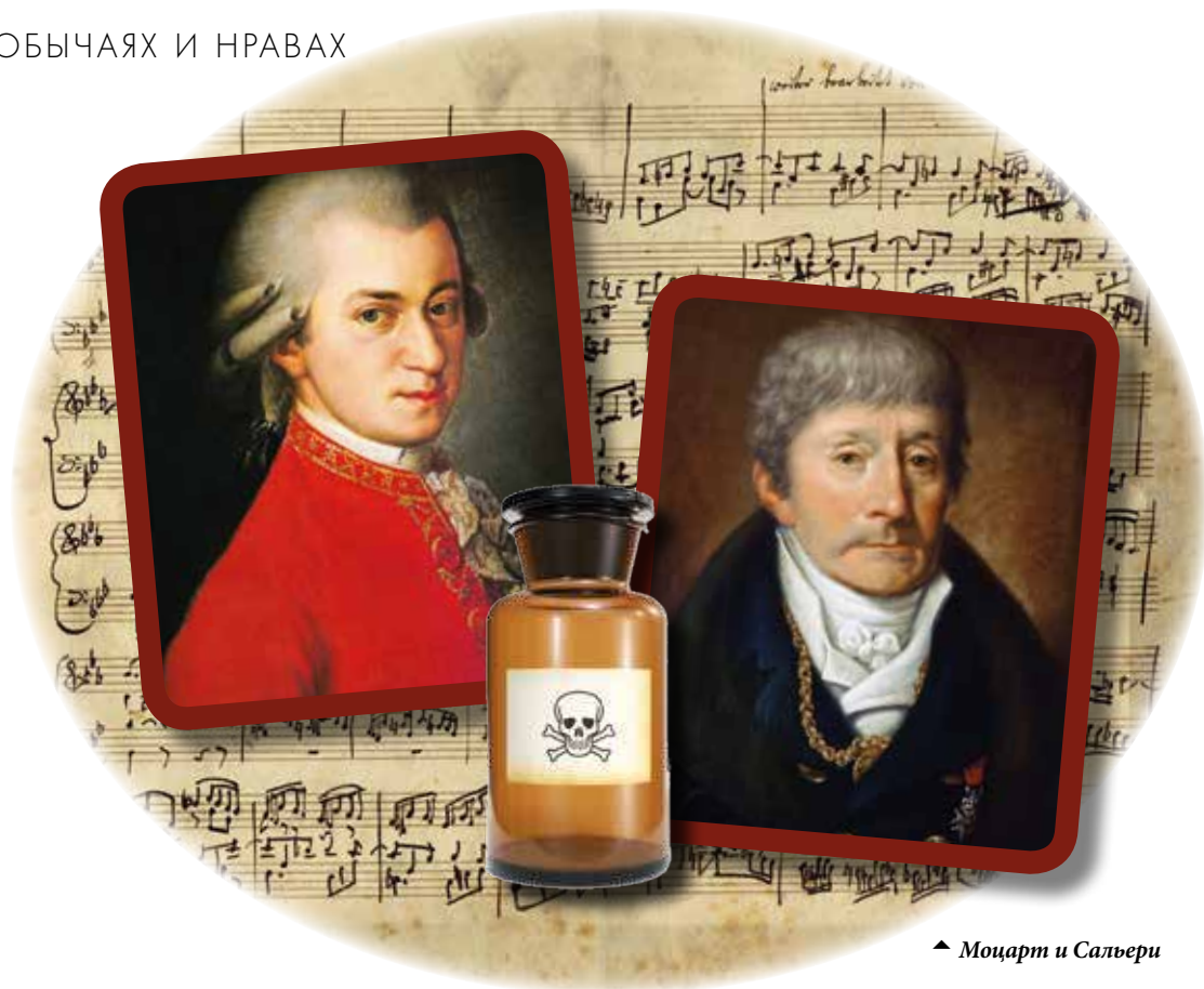
▲ Моцарт и Сальери

В 1832 ГОДУ АЛЕКСАНДР СЕРГЕЕВИЧ ПУШКИН ПЕРЕПИСАЛ НА ОТДЕЛЬНЫЙ ЛИСТОК ЗАМЕТКУ ИЗ НЕМЕЦКОЙ ГАЗЕТЫ. В НЕЙ РАССКАЗЫВАЛОСЬ, КАК НА ПЕРВОМ ПРЕДСТАВЛЕНИИ ОПЕРЫ «ДОН ЖУАН» В ВЕНЕ, КОГДА ОЧАРОВАННЫЕ ЗНАТОКИ УПИВАЛИСЬ ГАРМОНИЕЙ МОЦАРТА, В ЗАЛЕ РАЗДАЛСЯ СВИСТ.