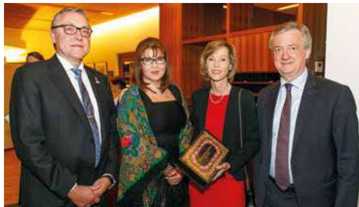
▲ Посол России в Австрии Д.Е. Любинский с супругой и Почетный консул России в Форарльберге Хуберт Берч с супругой