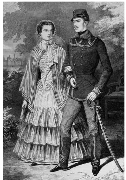
▲ Франц Иосиф и Елизавета

МАТЬ ФРАНЦА ИОСИФА ВЫСТУПИЛА ПРОТИВ ЭТОГО БРАКА. ОНА СЧИТАЛА, ЧТО ЕЛИЗАВЕТА СЛИШКОМ МОЛОДА, ЛЕГКОМЫСЛЕННА И СОВЕРШЕННО НЕ ПОДХОДИТ НА РОЛЬ ИМПЕРАТРИЦЫ. НО СЫН, КОТОРЫЙ ВСЕГДА И ВО ВСЕМ СЛУШАЛСЯ МАТЬ, В ЭТОМ СЛУЧАЕ БЫЛ НЕПРЕКЛОНЕН: «СИССИ ИЛИ НИКТО!»