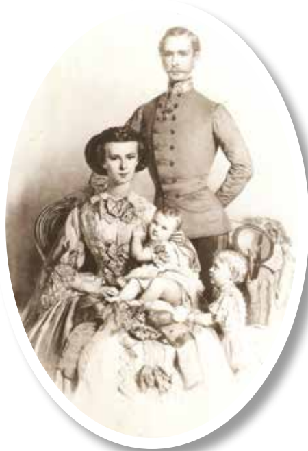
▲ Франц Иосиф и Елизавета с дочерьми Софией и Гизелой

В любимом и так часто сनिвшемся Елизавете Поссенхофере император просто не узнавал свою печальную жену-затворницу. Она буквально сияла от переполнявшей ее радости. Ей не хотелось думать о возвращении в Вену, где ее ждала неумолимая свекровь и бесконечная, иссушающая душу вражда. Летом 1856 года императрица родила еще одну девочку, которую назвали Гизелой и... снова унесли к свекрови. Но тут уже не выдержал Франц Иосиф. Он буквально взбунтовался и выказал матери свое недовольство. В резкой форме император потребовал у нее не вмешиваться в его семейную жизнь и заявил, что отныне дочери будут жить с родителями. А еще сын обязал ее уважать ту женщину, которую любит всем сердцем. Впервые со времени замужества Елизавета одержала победу, но она оказалась пирровой. София отчетливо поняла, что лишается былого влияния на сына, и отныне перестала скрывать свою враждеб-