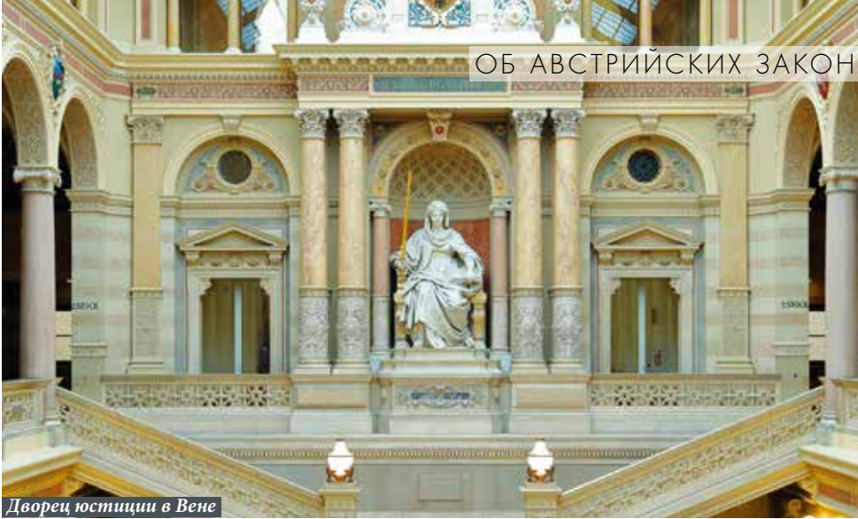
Дворец юстиции в Вене