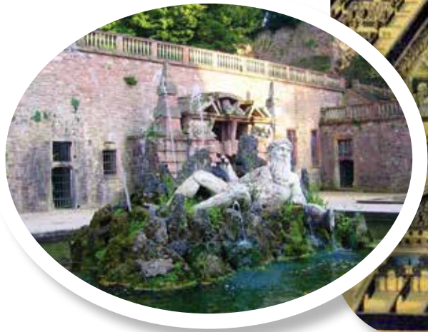
▲ От террасных садов сохранилось очень немногое