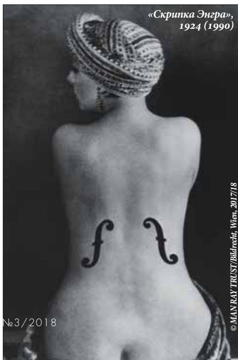
«Скрипка Энгра», 1924 (1990)

Время работы: ежедневно – с 10 до 19, пятница – с 10 до 21 www.kunstforumwien.at