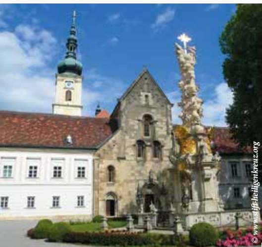
АББАТСТВО СВЯТОГО КРЕСТА

В ЭТОМ ДРЕВНЕЙШЕМ ЦИСТЕРЦИАНСКОМ МОНАСТЫРЕ ХРАНИТСЯ ЧАСТЬ КРЕСТА, НА КОТОРОМ РАСПЯЛИ ИИСУСА