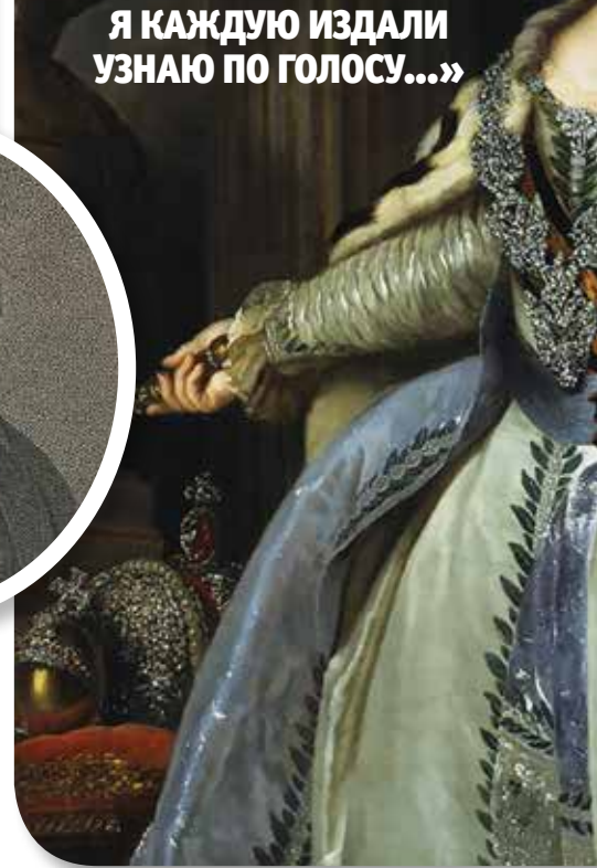
▲ Екатерина Великая

«ИЗ ЗВУКОВ Я РАЗЛИЧАЮ ТОЛЬКО ЛАЙ ДЕВЯТИ СОБАК, КОТОРЫЕ ПООЧЕРЕДНО ИМЕЮТ ЧЕСТЬ ПОМЕЩАТЬСЯ В МОЕЙ КОМНАТЕ И ИЗ КОТОРЫХ Я КАЖДУЮ ИЗДАЛИ УЗНАЮ ПО ГОЛОСУ...»