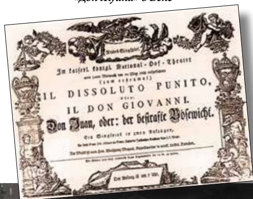
▼ Плакат к премьере «Дон Жуана» в Вене