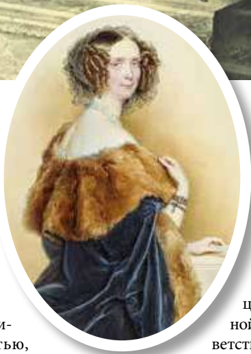
◀ Эригерцогиня София

Благодарственное письмо Елизаветы, в котором та обращалась к ней на «ты», возмутило строгую женщину. Ведь даже любимый сын называл ее только на «вы». Неприязнь Софии к будущей невестке еще больше усилилась, а вскоре сменилась глухой враждебностью, которая будет долгие годы портить жизнь обоих супругов.