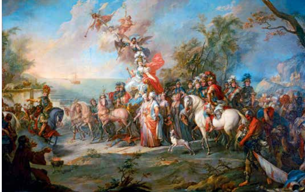
▲ «Аллегория победы Екатерины II над турками» Стефано Торелли, 1772. Полотно было призвано прославить победы русского оружия в первой Русско-турецкой войне (1768–1774). В триумфальной колеснице восседает Екатерина II в виде богини Минервы. Ее сопровождают воины – ближайшие сподвижники, первые кавалеры ордена Св. Георгия: П.А. Румянцев, А.Г. Орлов, П.И. Панин, В.М. Долгорукий, Н.В. Репнин и Ф.Г. Орлов. Возглавляет шествие Г.Г. Орлов – фаворит императрицы.

Англия связывала с этим морем свои далеко идущие намерения, которые самым тесным образом переплетались с французскими. Дело в том, что путь по этому морю из Европы в Индию и Индокитай был в два раза короче, чем вокруг Африки. Поэтому ни Франции, ни Англии вроде бы не было никакого резона пускать туда еще и