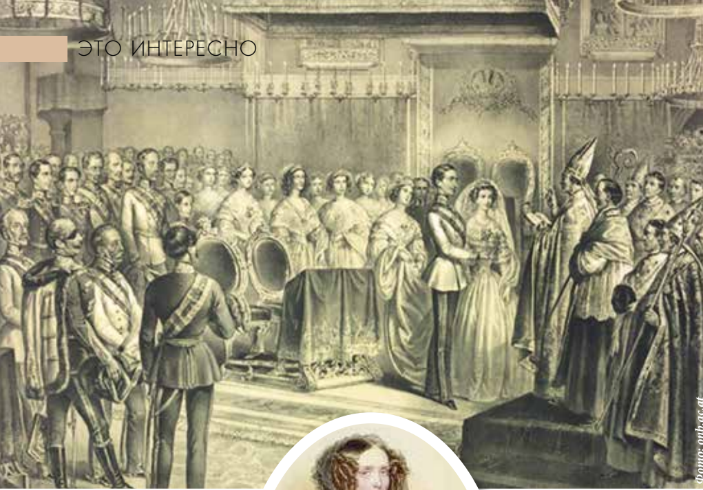
▲ Церемония венчания