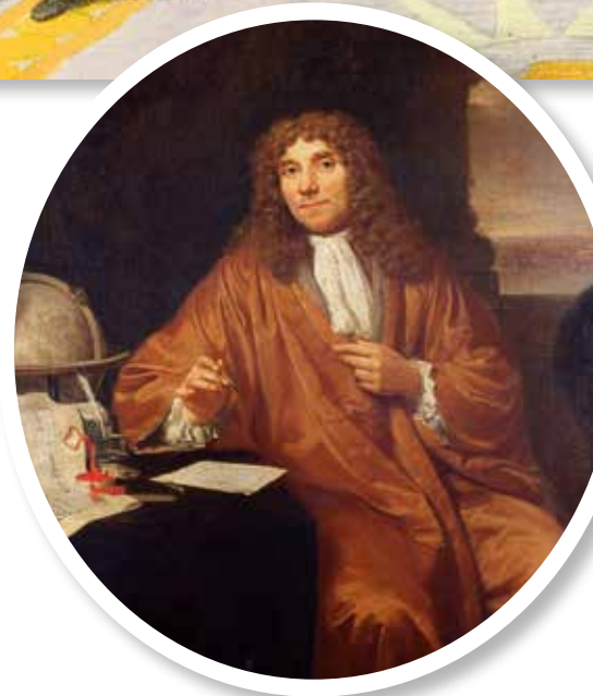
▲ Антони ван Левенгук

рое до него еще никто не наблюдал! Потому что только Левенгук в этом мире мог изготавливать такие прекрасные линзы. Но любопытство гнало его дальше. Однажды, взяв из ближайшего канала каплю воды, он направил на нее свою новую стекляшку и... обнаружил в ней целый зверинец, населенный множеством разнообразных маленьких «зверушек». Это зрелище его так заинтересовало, что он устроил настоящую охоту за ними. Они были везде: на только что сорванных с веток овощах и фруктах, на глазной слизи соседской коровы и даже в кувшине с питьевой водой. Но самое большое скопище этих существ было найдено во рту старика, который не имел никакого представления о существовании зубной щетки. Оказалось, что у него там обитало «зверюшек» больше, чем жителей во всей Голландии! Обо всех сделанных наблюдениях Левенгук аккуратно сообщал в своих длинных и пространных посланиях в Лондонскую академию. Заморские ученые мужи сильно сомневались в достоверности фактов, приводимых голландцем, а некоторые считали его обыкновенным шарлатаном. Ведь они тоже смотрели на капли воды из Темзы через свои стекляшки, изготовленные лучшими лондонскими мастерами, и никаких «зверюшек» в них не обнаруживали. Ну разве можно было подумать, что какой-то деревенский дурень из Голландии мог сделать линзы лучше, чем в Лондоне? Наконец, Левенгук окончательно «достал» своими посланиями лондонских научных светил и они решили послать одного из своих коллег в «голландскую глушь», чтобы вывести этого отчаянного