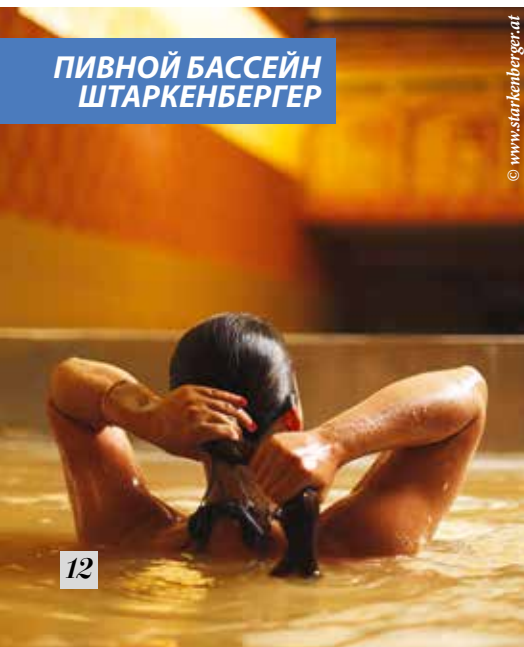
ПИВНОЙ БАСЕЙН ШТАРКЕНБЕРГЕР