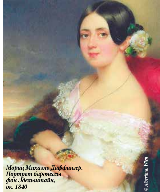
Мориц Михаэль Даффингер. Портрет баронессы фон Эдельмутьин, ок. 1840

© MAN RAY TRUST/Bildrecht, Wien, 2017/18