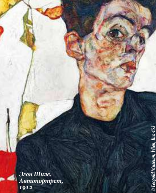
Эгон Шиле. Автопортрет, 1912