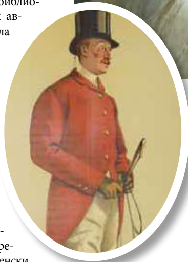
▲ Бэй Миддлтон