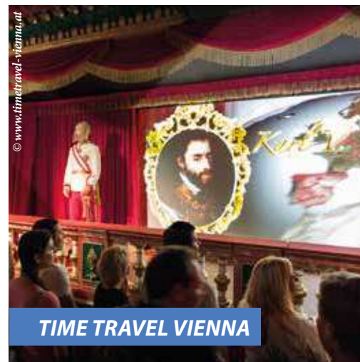
TIME TRAVEL VIENNA

Если вы хотите совершить путешествие в прошлое, посетите Сальваторианский монастырь, который находится на Габсбурггассе в центре Вены. В его старинном подвале открыт удивительный атракцион под названием TIME TRAVEL VIENNA – ультрасовременный 5D-кинотеатр дает возможность зрителям попасть в историческую атмосферу и «пообщаться» с выдающимися историческими личностями. Посетители побывают в настоящем бомбоубежище и встретятся с говорящими восковыми фигурами.