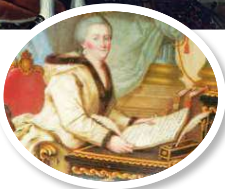
▲ Екатерина II

Силу воздействия этой музыки мне пришлось испытать на себе. Во время войны и после ее окончания мои музыкальные интересы не простирались дальше вальсов Штрауса. Ведь грязные окопы и солдатские казармы были далеко не теми местами, где могли