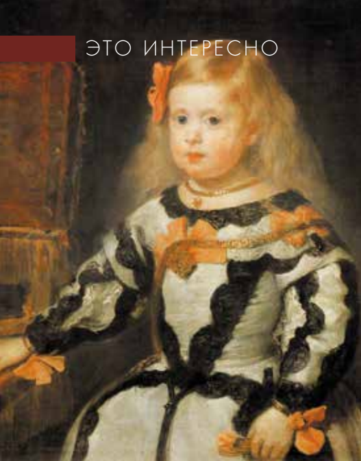
▲ Портрет инфанты Маргариты. Диего Веласкес, 1655. Лувр, Париж.