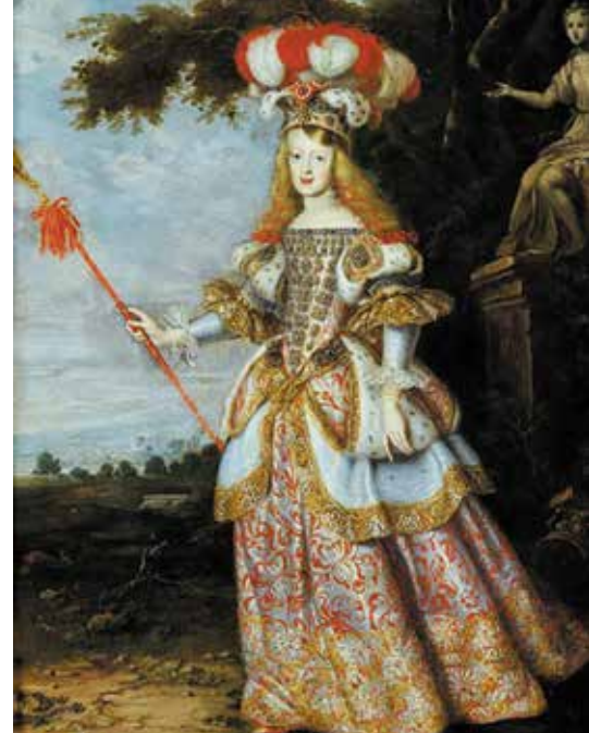
▲ Портрет Маргариты Австрийской (1665–1666). Хуан Батиста Мартинес дель Мазо.