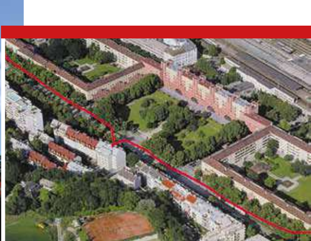
▲ Вид на КМХ сверху. Основная часть комплекса без крайних корпусов