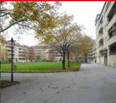
▲ Один из внутренних дворов КМХ