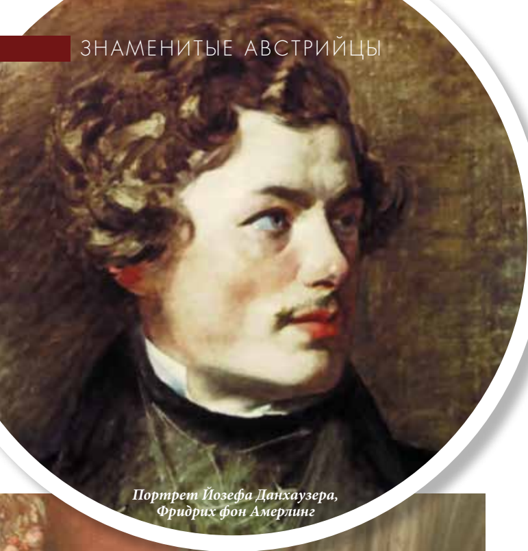
Портрет Йозефа Данхаузера, Фридрих фон Амерлинг