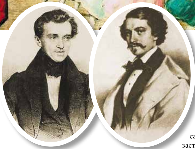
▲ Отец и сын Штраусы

Пять лет отец и сын Штраусы с переменным успехом вели войну. В 1848 году, когда по Европе прокатилась революция, они в буквальном смысле оказались по разные стороны баррикад.