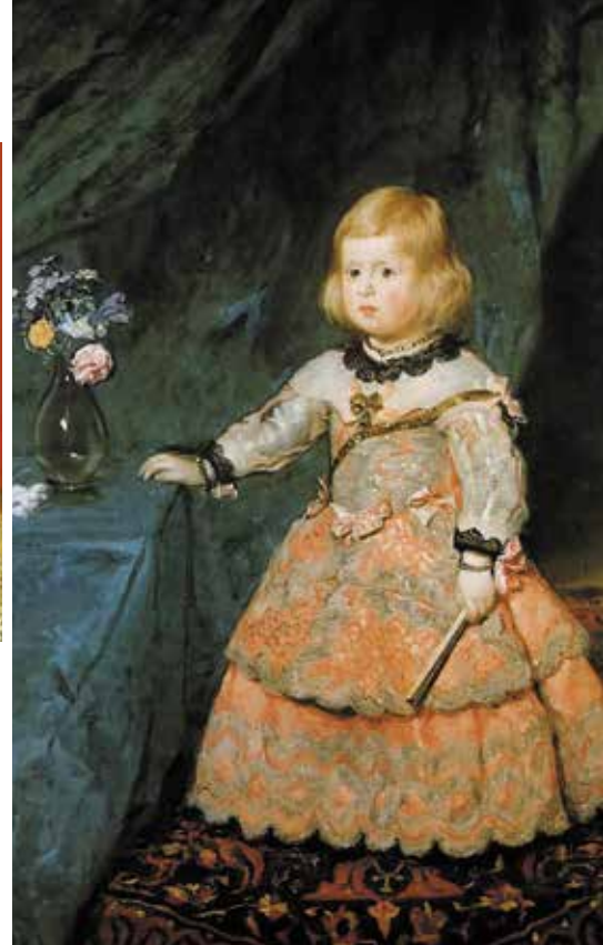
▲ Первый портрет инфанты Маргариты. Диего Веласкес.