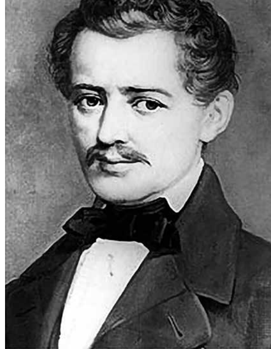
▲ Иоганн Штраус-отец