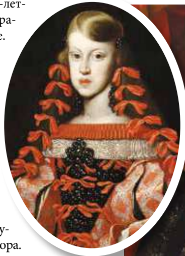
▼ Инфанта Маргарита Тереза. Жерар дю Шато, 1665.