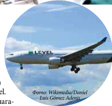
Фото: Wikimedia/Daniel Luis Gómez Adenis

По сообщению газеты Wiener Wirtschaft , на австрийский рынок пришла дочерняя компания British Airways и Iberia – лоукостер Level. С 17 июля авиаперевозчик предлагает дешевые полеты в Лондон и Пальма-де-Майорку (Испания), немного позже авиалайнеры Level будут летать в Барселону, на Ибицу, в Венецию, Париж, Дубровник и Ларнаку. В Вене будут находиться четыре самолета компании, которая создаст в Австрии двести новых рабочих мест.