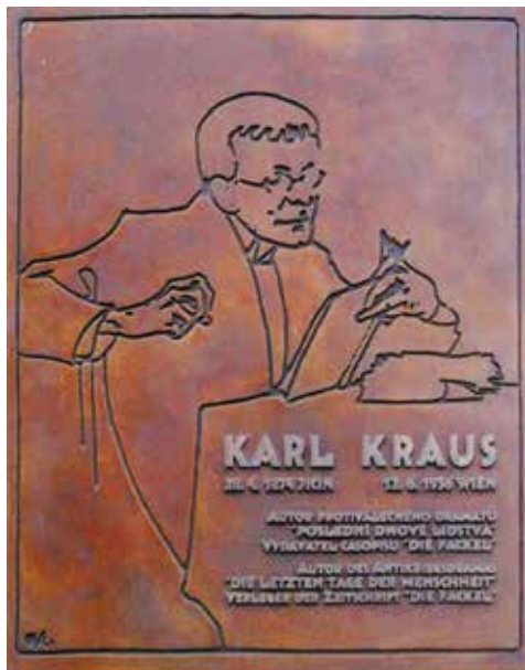
▲ Памятная доска в Йичине – родном городе журналиста

37 лет существования журнала. Стоит ли удивляться, что с какого-то момента во всех венских редакциях даже имя Карла Крауса упоминать было запрещено.