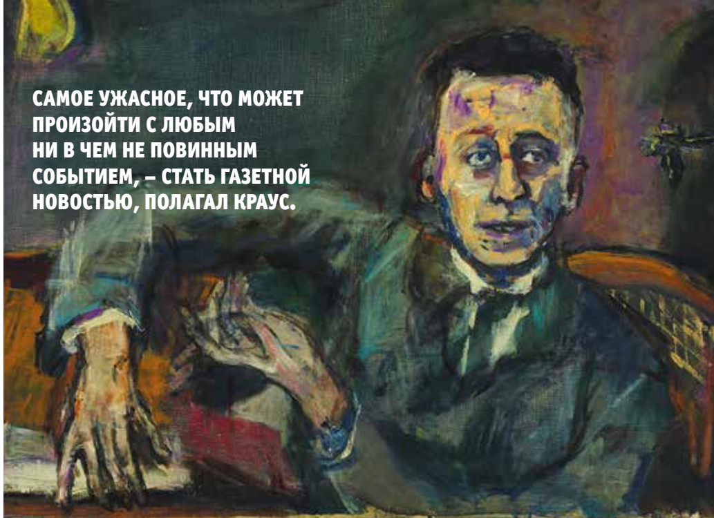
▲ Карл Краус. Портрет кисти Оскара Кокоски

САМОЕ УЖАСНОЕ, ЧТО МОЖЕТ ПРОИЗОЙТИ С ЛЮБЫМ НИ В ЧЕМ НЕ ПОВИННЫМ СОБЫТИЕМ, – СТАТЬ ГАЗЕТНОЙ НОВОСТЬЮ, ПОЛАГАЛ КРАУС.