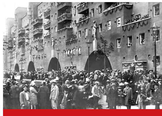
▼ КМХ в 1930 году. Торжественное открытие

Своей основной задачей социалисты считали улучшение жизни трудящихся слоев населения. К проектам в социальной сфере, которые были успешно осуществлены в эпоху Красной Вены, относятся введение в столице бесплатного медицинского обслуживания,