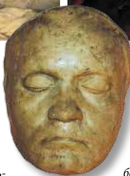
◀ Посмертная маска Бетховена

композитору трубочку, чтобы тот мог через нее дышать, и наложил на его лицо толстый слой гипса. Бетховен подчинился. Но, когда гипс начал застывать, он забеспокоился.