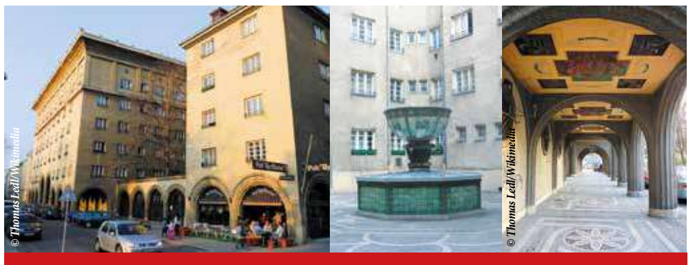
▼ Фогельвайдхоф. Внутренний дворик. Арка с мозаичным полом и фресками