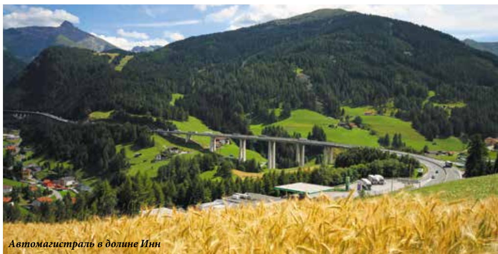
Автомагистраль в долине Инн