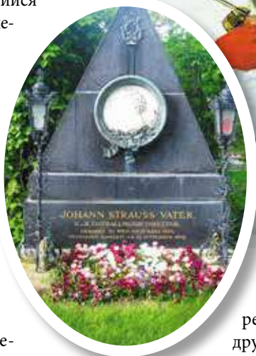
◀ Могила Штрауса-отца на Центральном кладбище Вены

Но в те революционные дни венцы не пожелали оценить мастерство и осыпали короля вальсов упреками. Его концерты теперь игнорировались – он растерялся, сник. Однажды в порыве гнева сломал смычок, который, как ему показалось, пе-