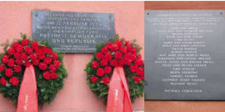
▲ Мемориальная доска с именами жертв Холокоста

По финансовым причинам в изначальном варианте ванны для каждой квартиры предусмотрены не были. Вместо них во дворе КМХ имелась общественная баня с 60 душевыми кабинами и 20 ваннами. Потом многие жильцы сами оборудовали душевые кабины в квартирах. И только в ходе генерального санирования КМХ в 80-х годах каждая квартира получила отдельную ванную комнату.