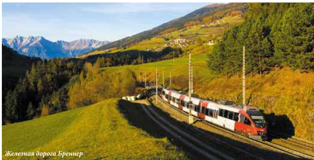
Железная дорога Бреннер