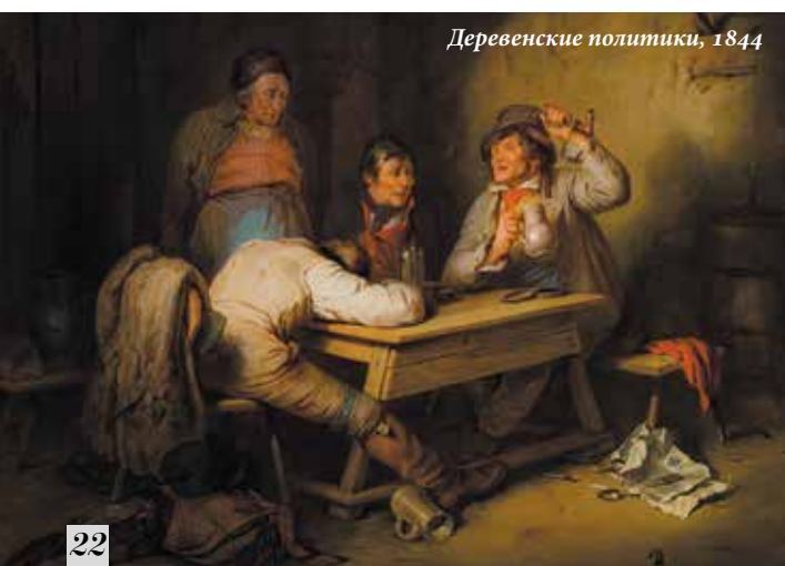
Деревенские политики, 1844

Бетховен и Данхаузер были знакомы раньше. В своих мемуарах немецкий поэт Фогль приводит интересный рассказ о том, как Йозефу удалось каким-то образом заманить композитора к себе в студию в Вене. Он попросил Бетховена снять пальто и расстегнуть рубашку. «Надеюсь, Вы не собираетесь меня обезглавить?» – спросил композитор. Данхаузер успокоил его, потом маленькими кусочками бумаги закрыл ему глаза и намазал маслом подбородок и щеки. Далее Йозеф засунул в рот