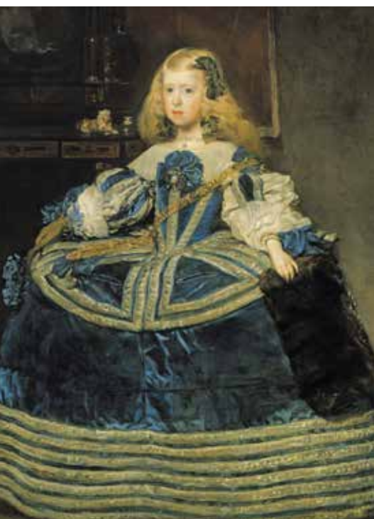
▼ Портрет инфанты Маргариты в голубом. Диего Веласкес, 1659. Художественно-исторический музей, Вена.

глазой блондинкой, взгляд которой с любопытством изучает художника. Тяжелое одеяние тянет инфанту к полу, но она изо всех сил старается сохранить торжественное выражение лица. И все же художник не забывает, что пишет хоть королевского, но ребенка: круглые щечки совсем ребячьи, а в больших глазах – искорки достоинства. Многие искусствоведы считают, что на этом портрете прелесть юной инфанты достигла апогея. В дальнейшем, повзрослев, Маргарита приобретет черты рода Габсбургов: угловатость лица, выпуклость нижней губы и оттопыренность подбородка.