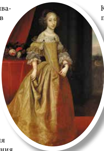
▲ Портрет Марии Антонии (1669–1692), дочери Маргариты и Леопольда, ставшей женой Максимилиана II.

Хуан Батиста Мартинес дель Мазо – зять и ученик Веласкеса, занявший после него должность придворного художника, нарисовал инфанту в трауре по случаю смерти в 1665-м ее отца Филиппа IV. Но уже в следующем году девушку ожидало счастливое событие: она выходила замуж. Для официальной процедуры бракосочетания Маргарита выехала из Мадрида в Вену в сопровождении своей свиты. Ей тогда было пятнадцать, а жениху – двадцать шесть лет.