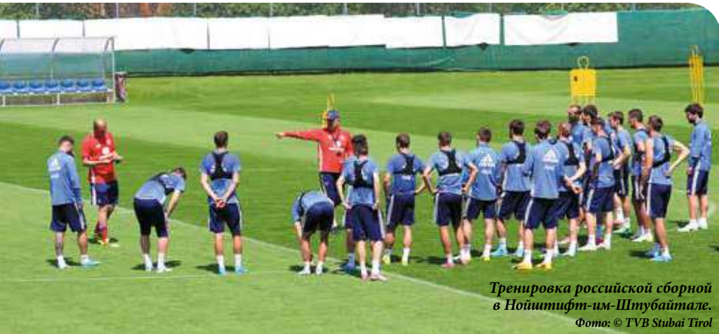
Тренировка российской сборной в Нойштифт-им-Штубайтале.