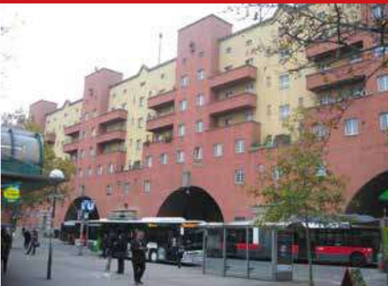
▲ Карл-Маркс-Хоф со стороны метро