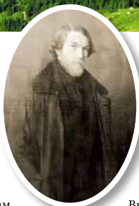
▲ Карл Этцель

До перевала железная дорога поднималась по склонам гор, пересекая романтическую местность с огромными острыми утесами, ущельями, скрывавшими в своей, казалось, бездонной глубине реку Силль, удалявшуюся от дороги только за станцией Бреннер. После дикой Силльской долины живописный вид берегов реки Эйзах позволял отвлечься от мрачных предчувствий, благо полотно в этом месте отлого понижалось и пассажиры замечали, что поезд не пересек ни одного моста, а в окнах ни разу не промелькнул виадук – неперенный спутник любой высокогорной трассы. Проявив отменное знание географии, Этцель обошелся без этих сооружений, поэтому колоссальная стройка была завершена всего за три года. Несмотря на внешнюю простоту, стоила она дорого, в основном из-за 23 туннелей, пробитых в твердых породах, часто не по прямой, а полукругом. Некоторые из них служили отводами талых вод и лежали рядом, но в различных плоскостях: параллельно железной дороге, частью ниже ее, а частью выше. Подле рельсов можно было увидеть желоба; красиво выложенные камнем, они были устроены на всякий случай, который, впрочем, наступал ежегодно во время разлива горных ручьев. В целом безопасная