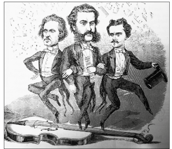
▲ Карикатура на семейство Штраусов

В СЕРЕДИНЕ XIX ВЕКА ПО ЕВРОПЕ С КОНЦЕРТАМИ КОЛЕСИЛИ ОДНОВРЕМЕННО ТРОЕ ШТРАУСОВ. ВСЕ ОНИ СОЧИНЯЛИ ВАЛЬСЫ, ПОДПИСЫВАЯ ИХ ОДИНАКОВО – ТОЛЬКО ФАМИЛИЕЙ, ИМЕЛИ СХОЖУЮ МАНЕРУ ИСПОЛНЕНИЯ. МНОГИЕ СЧИТАЛИ ТРОИХ БРАТЬЕВ ОДНИМ ЧЕЛОВЕКОМ, А ТО И ПУТАЛИ ИХ С ЧЕТВЕРТЫМ ШТРАУСОМ – ОТЦОМ. В ВЕНСКИХ ГАЗЕТАХ ОСТРИЛИ: «ФИРМА ШТРАУС. ТОРГОВЦЫ МУЗЫКОЙ ОПТОМ И В РОЗНИЦУ».