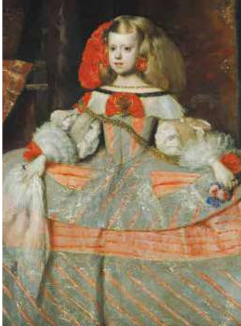
▲ Инфанта Маргарита в розовом. Диего Веласкес, 1660. Музей Прадо.