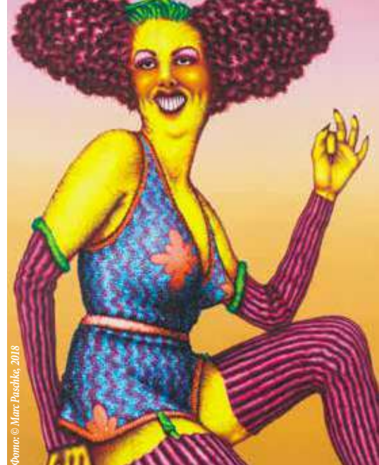
▲ Эд Пауке. JEANINE, 1973

Этнологический музей Volkskunde Museum Laudongasse 15–19, 1080 Wien Время работы: ежедневно – с 10 до 17, по четвергам – с 10 до 20, понедельник – выходной день www.volkskundemuseum.at