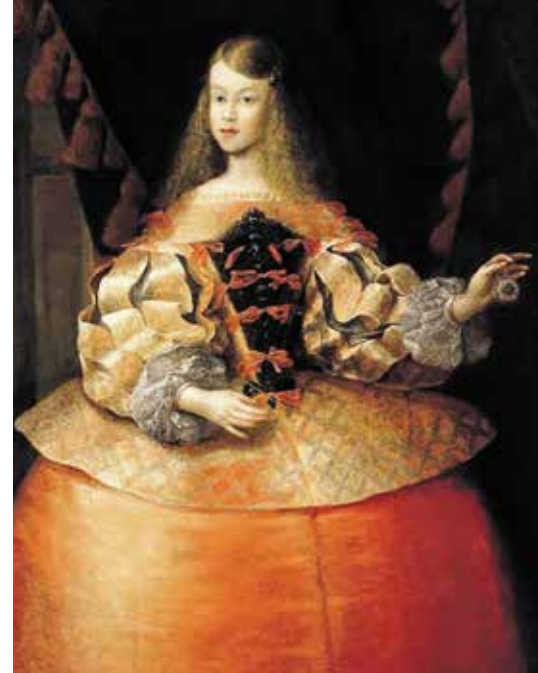
▲ Портрет инфанты Маргариты. Франсиско де ла Иглесиа.

Спустя пару лет, в 1655 году, Веласкес снова напишет портрет инфанты, глядя на который испытываешь всё те же умиление и восторг. Поза останется той же, что на первом портрете, однако платье утяжелится кринолином, а вот в глазах румяной девочки уже обреченность. Почему-то кажется, что маленькая модель вот-вот расплчется.