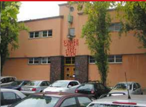
▲ Один из двух детских садов в здании КМХ

создание сети детских садов, женских и детских консультаций, общественных спортивных сооружений, бань, приютов. В школах дополнительно были оборудованы медицинский пункт, столовая, где бесплатно раздавали молоко. Каждому новорожденному от муниципалитета выдавался пакет с пеленками, «чтобы больше ни одного венского ребенка не заворачивали в газеты».