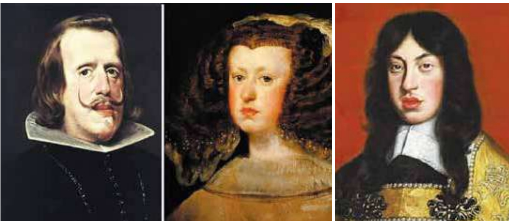
▲ Родители инфанты: король Испании Филипп IV и Марианна Австрийская, его вторая жена. Диего Веласкес, 1660.