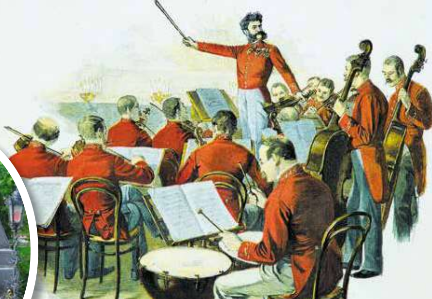
▲ Штраус-сын и его музыканты

рестал повиноваться. И на другой день слег в горячке. Опасаясь, что болезнь заразна, Эмилия сбежала из дому, увезя с собой всех семерых наследников состояния и оставив короля вальсов умирать в одиночестве. Узнав об этом, прежняя жена вместе с сыном Иоганном поехали к больному, но в живых его уже не застали.