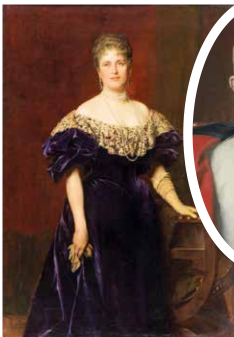
▲ Портрет Марии Йозефы Саксонской, матери последнего императора Австрии Карла I. 1897 г.