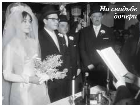
На свадьбе дочери