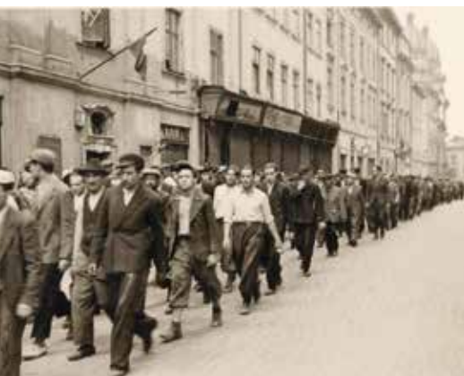
▲ Евреи во Львове, июль – сентябрь 1941 года.