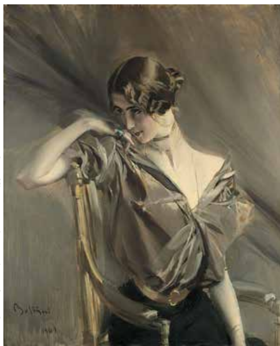
Формы: http://www.gcometrefluide.com/foto/PI/C27880.jpg / Wikipedia