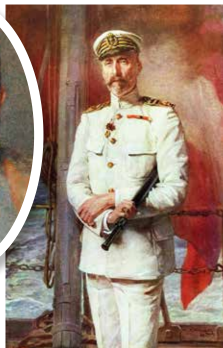
▲ Карл Стефан Габсбург, австрийский эрцгерцог, адмирал. 1912 г.