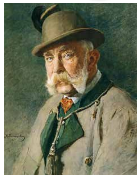
▲ Франц Иосиф I. 1910 г.