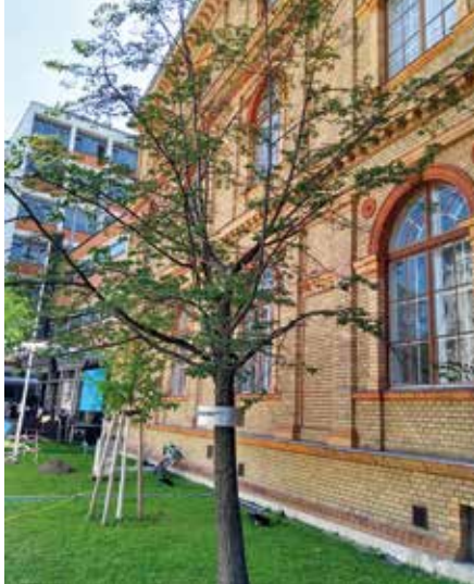
▲ Дерево, посаженное Визенталем у Высшей школы прикладных искусств в Вене в 1989 году.

В 1989 году про жизнь этого необычного человека был снят художественный фильм, отмеченный множеством наград, « Убийцы среди нас: История Симона Визенталья » (Murderers Among Us: The Simon Wiesenthal Story) с Беном Кингсли в главной роли.