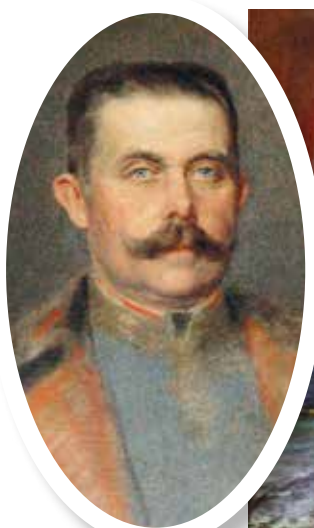
▲ Эрцгерцог Франц Фердинанд, наследник престола Австро-Венгрии. 1914 г.