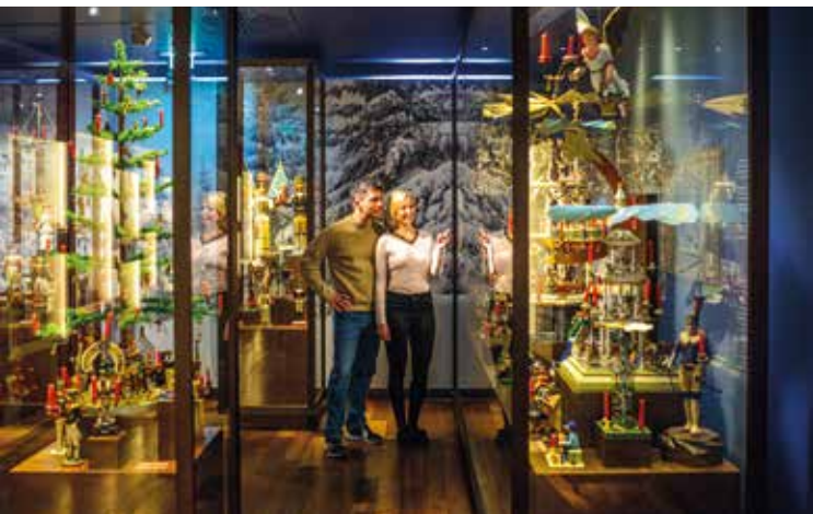
Фото: © Tourismus Salzburg GmbH / G. BreiteggerSalzburg