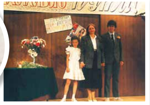
▲ С детьми в посольской школе в Вене

называли Бродвеем, занимает особое место в моей жизни: на нем мы играли в детстве, на нем познакомились с ребятами в юности. Мы жили прямо напротив драматического театра. Я там буквально дневала и ночевала – если меня не находили во дворе или на улице, искали в драмтеатре. Там все меня знали и пропускали бесплатно. Сидя на принесенной с собой диванной подушке прямо на лестнице галерки, я пересмотрела все местные постановки и все спектакли гастролировавших коллективов.