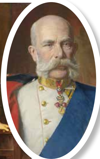
▲ Император Австрии Франц Иосиф I. Между 1890 и 1890 гг.