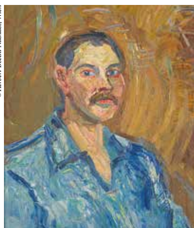
© ALBERTINA, Wien – Familiensammlung Haselsteiner © Herbert-Böckl-Nachlass, Wien