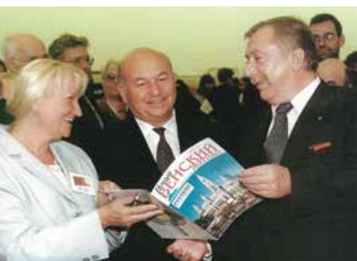
▲ С бургомистром Вены М. Хойплем и мэром Москвы Ю. М. Лужковым, 1998 г.