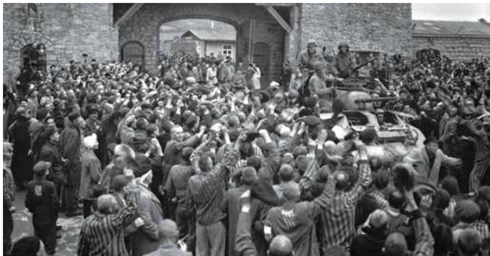
▲ Узники концлагеря Маутхаузен приветствуют американские войска. 1945 г.

Согласно общеизвестным данным и его собственным утверждениям, жертвами Холокоста стали 87 родственников Визенталю и его жены .