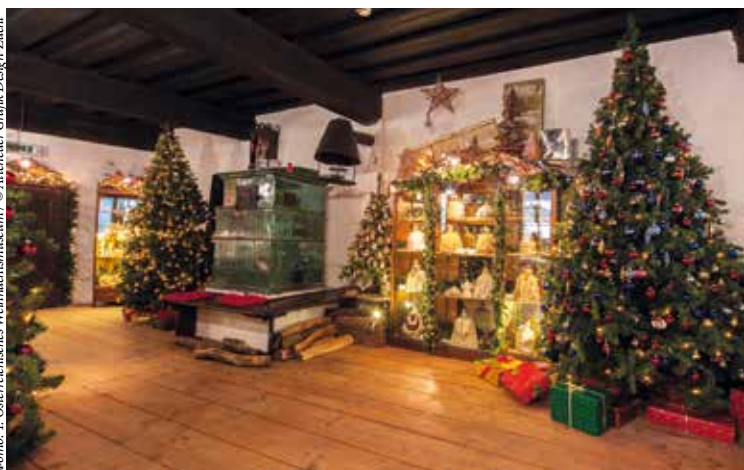
Фото: 1. Österreichisches Weihnachtsmuseum / © Altmieder Grafik Design-Zaehl