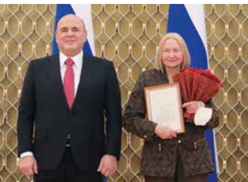
▲ С М. В. Мишустиним, январь 2022 г.