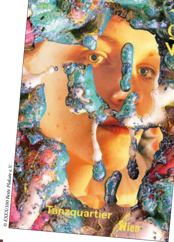
© EXEY/100 Beste Plakate e. V.

Museumsplatz 1, 1070 Wien Время работы: ежедневно, кроме понедельника Требуется запись по телефону: +43 1 524 79 08 www.kindermuseum.at