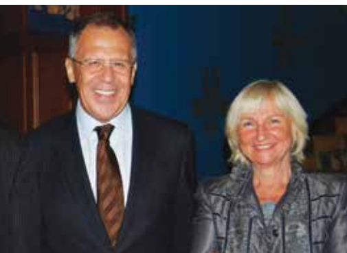
▲ С С. В. Лавровым