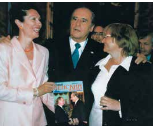
▲ С президентом Австрии Т. Клестилем и его супругой М. Клестиль-Лёффлер, 2002 г.