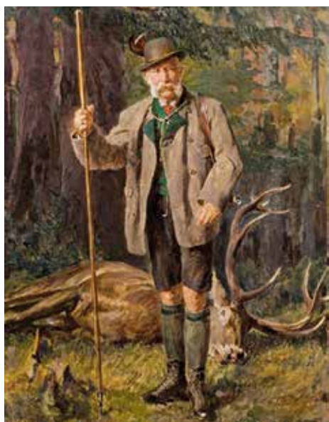
▲ Франц Иосиф I с трофеем. Ок. 1909 г.