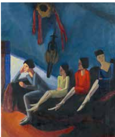
© Gabriele Münter- und Johannes Eichner-Stiftung, München © Bildrecht, Wien 2023

Музей Леопольда первым в Австрии проводит крупную персональную выставку этой художницы-экспрессионистки. Познакомиться с многогранным творчеством Мюнтер помогут более 130 экспонатов , включая картины маслом, гравюры, рисунки,