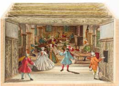
© Musik und Tanz in einem Gasthaus, Diorama von Martin Engelbrecht, um 1755, Privatbesitz

питался либо дома, либо в гостях – музыканта часто приглашала на обеды и ужины в свои дворцы знать, либо в заведениях, которые можно условно назвать ресторанами.