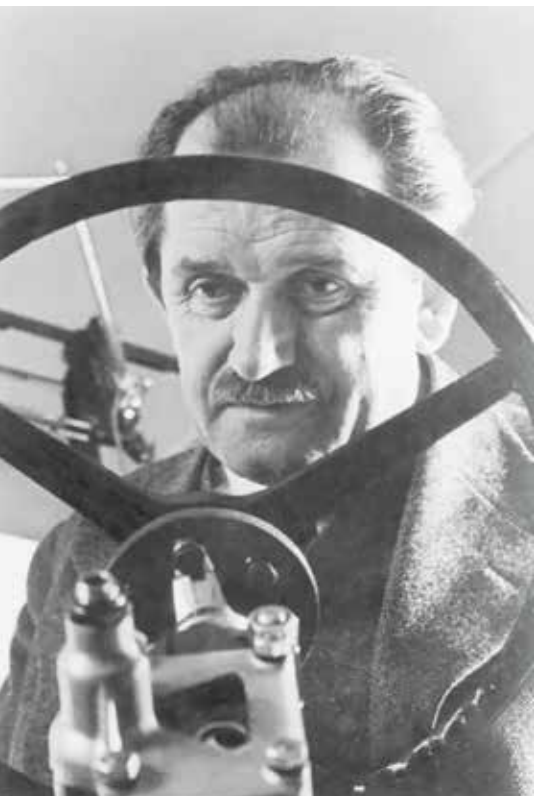
▲ Фердинанд Порше в 1940 году.