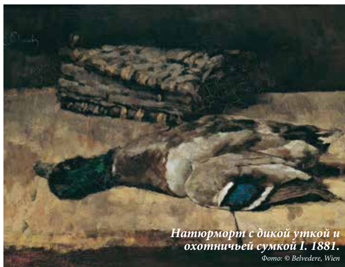
Натюрморт с дикой уткой и охотничьей сумкой I. 1881.