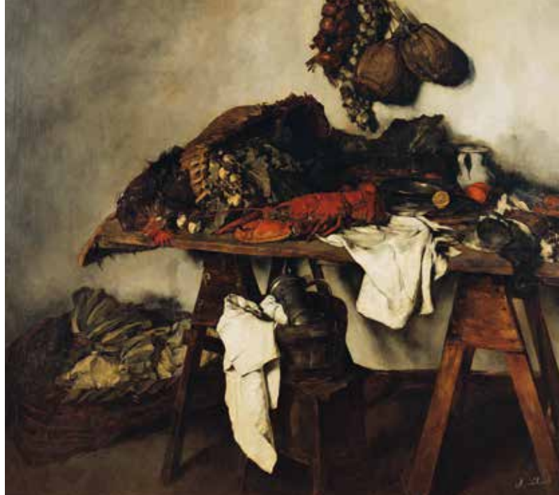
▲ Большой натюрморт. 1879.