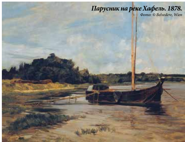
Парусник на реке Хафель. 1878.