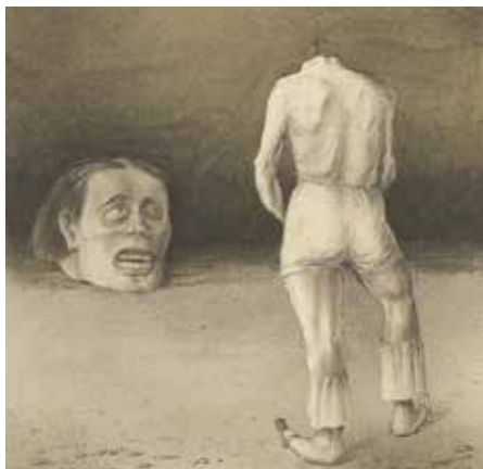
ALBERTINA, Wien © Eberhard Spangenberg, München / Bildrecht, Wien 2024