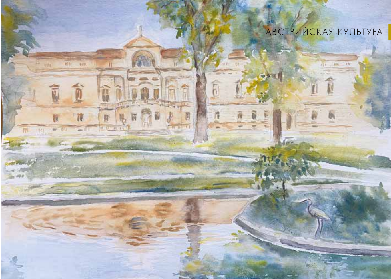
▲ Дворец и парковый ансамбль Лихтенштейн, акварель, 30 x 21 см. Виктория Малышева