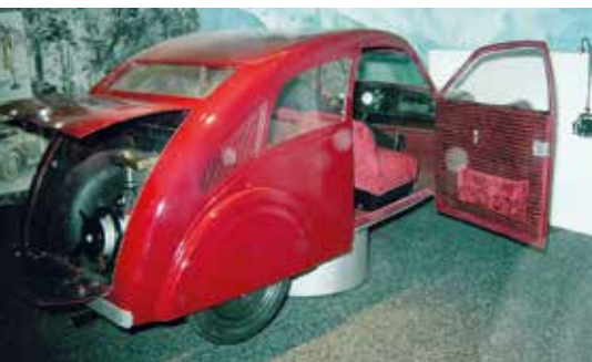
▲ Porsche Type 12 (1932 г.), реконструкция автомобиля.