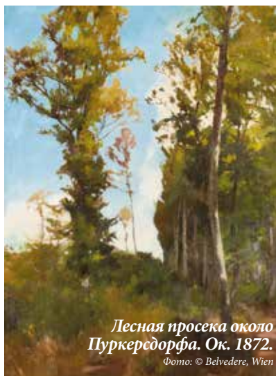
Лесная просека около Пуркерсдорфа. Ок. 1872.