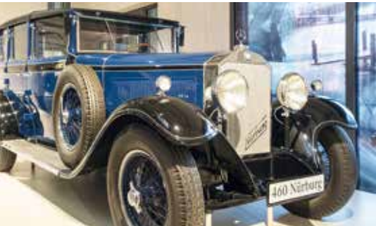
▲ Mercedes-Benz Typ 460 Nürburg (1930 г.).