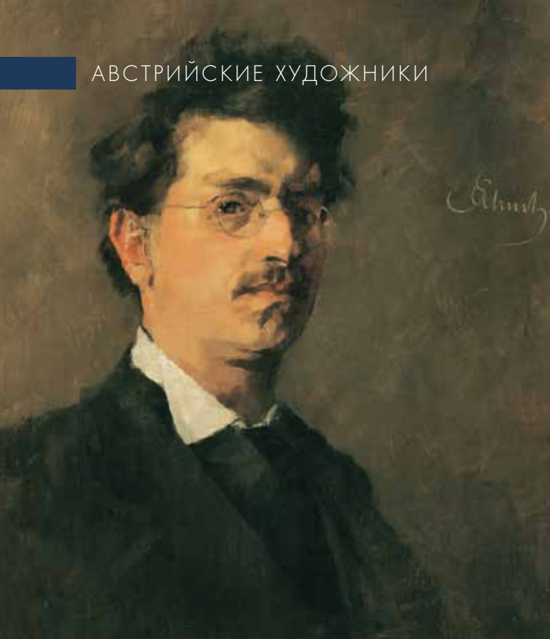
▲ Карл Шух, автопортрет. Ок. 1875 / 1876.