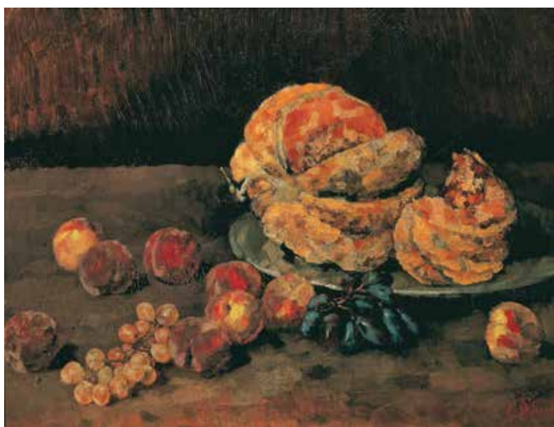
▲ Натюрморт с тыквой, персиком и виноградом.