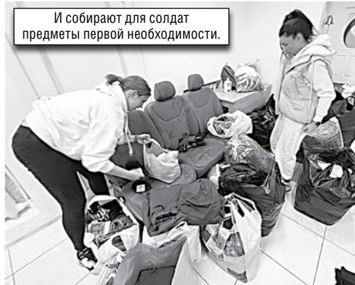
И собирают для солдат предметы первой необходимости.

Также волонтеры собирают медикаменты для раненых: шприцы, обезболивающие и дезинфицирующие препараты, активированный уголь, перевязочные материалы, латексные перчатки. Все это одесситы могут принести самостоятельно по адресу улицы Канатная, 78 ,