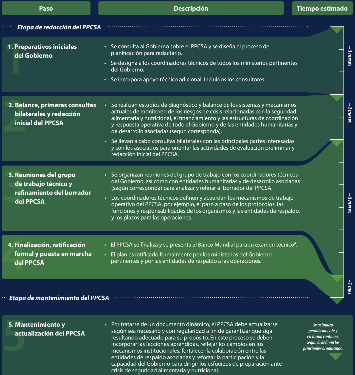
Cuadro 1: Pasos y plazos indicativos para la elaboración de los PPCSA (solo a modo ilustrativo)