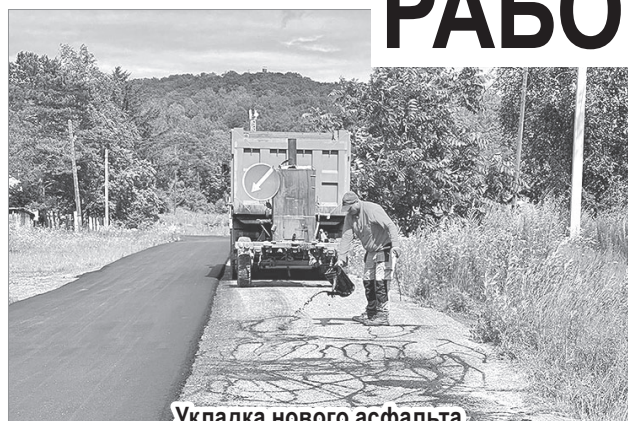
Укладка нового асфальта в с. Нижняя Манома