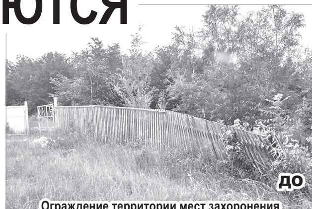
Ограждение территории мест захоронения в с. Лидога

Особая просьба ко всем жителям района - навести порядок около своих домов и окосить придомовую территорию до основной дороги.