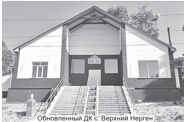
Обновленный ДК с. Верхний Нерген