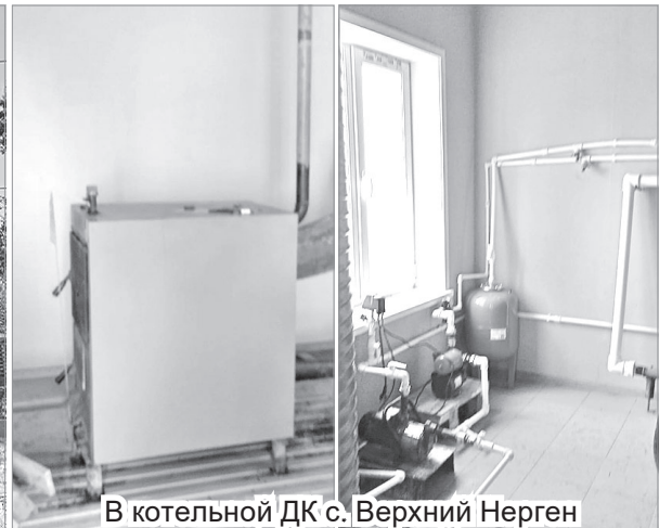
В котельной ДК с. Верхний Нерген