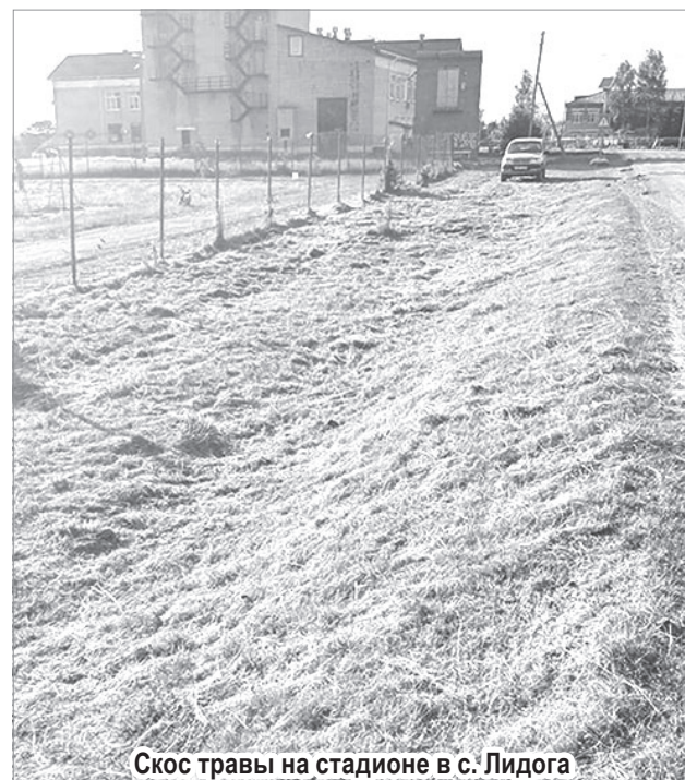
Скос травы на стадионе в с. Лидога