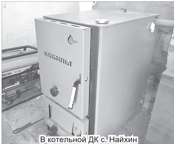
В котельной ДК с. Найхин