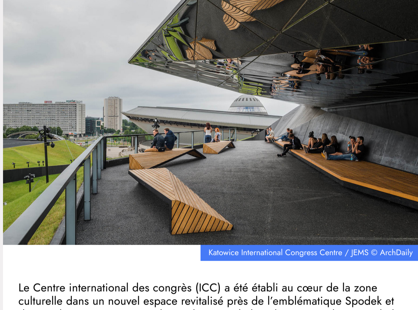
Katowice International Congress Centre / JEMS

Le Centre international des congrès (ICC) a été établi au cœur de la zone culturelle dans un nouvel espace revitalisé près de l'emblématique Spodek et d'autres bâtiments uniques tels que le siège de l'Orchestre symphonique de la radio nationale polonaise et le musée de Silésie. Le bâtiment est un complexe de services multifonctionnel conçu pour accueillir jusqu'à 15 000 invités, il est équipé d'un équipement multimédia moderne, permettant la communication avec les visiteurs et l'organisation efficace d'événements.