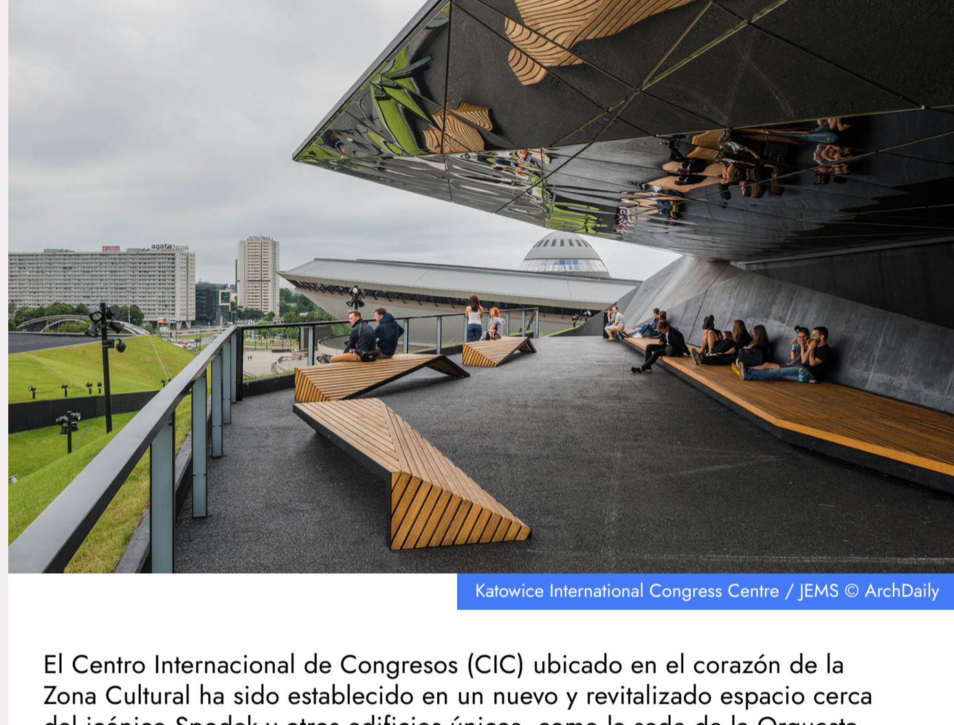
Katowice International Congress Centre / JEMS

El Centro Internacional de Congresos (CIC) ubicado en el corazón de la Zona Cultural ha sido establecido en un nuevo y revitalizado espacio cerca del icónico Spodek y otros edificios únicos, como la sede de la Orquesta Sinfónica de la Radio Nacional Polaca y el Museo de Silesia. El edificio es un complejo de servicios multifuncional diseñado para albergar hasta 15 000 invitados y está equipado con modernos equipos multimedia, lo que facilita la comunicación con los visitantes y la organización eficaz de eventos.