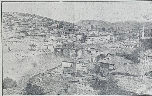
гр. Велесъ, родното мѣсто на войводитъ Кушевъ и Весовъ.