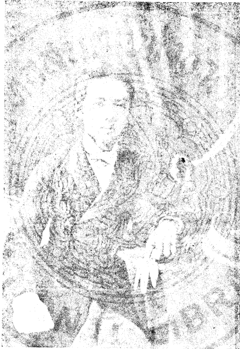
ทรงพระยศเป็นนายร้อยตรีทหารบก