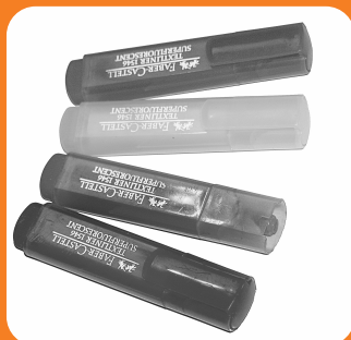
Public Domain Popperipopp