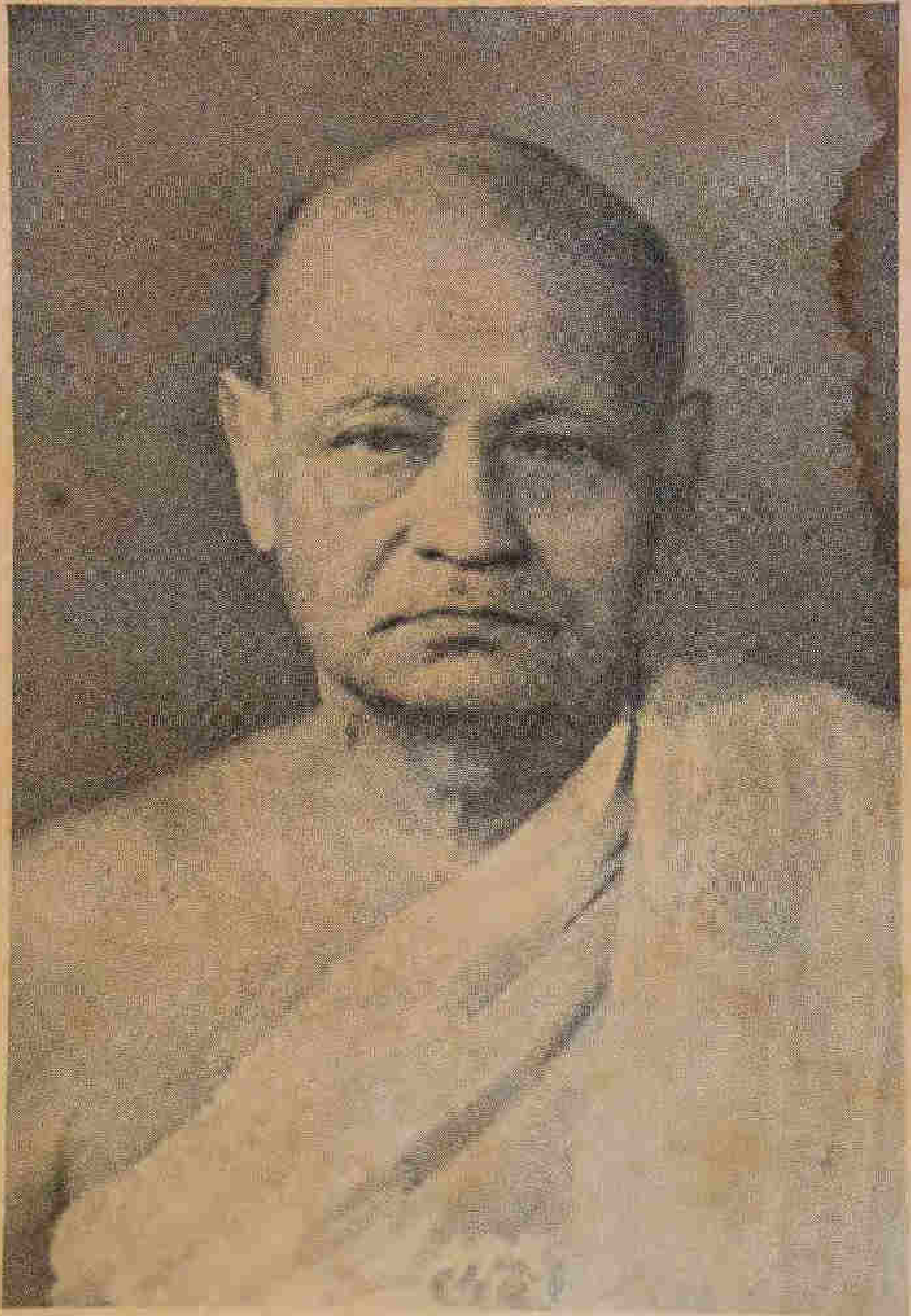
๐ ๑๒๑ ๑ พระรองอำมาตย์ตรีวธมน จูฑะวาทุณโน กาญจนพบ