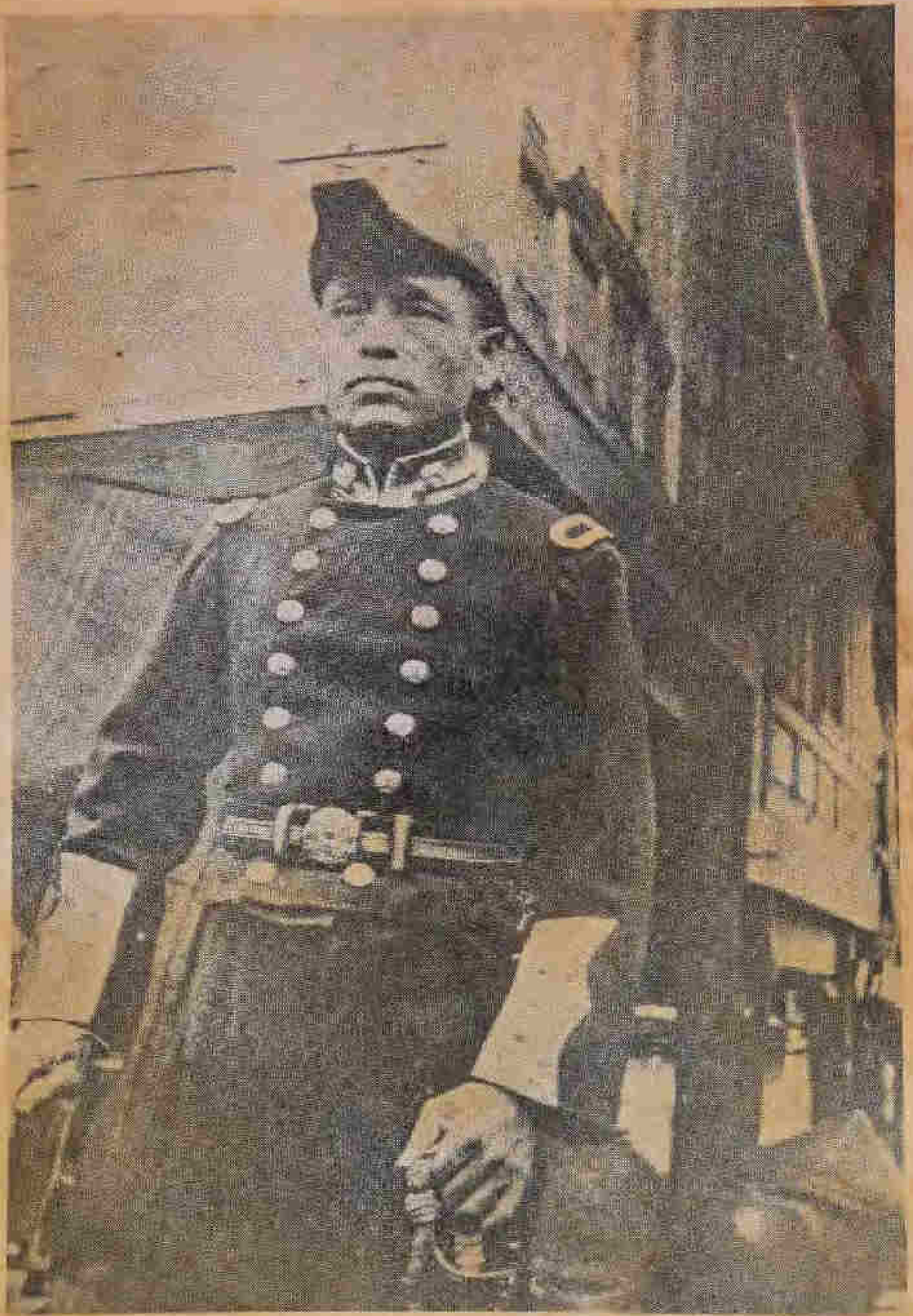
รองอำมาตย์ตรี วรฉน กาญจนพย ถ่ายภาพเมื่อ พ.ศ. ๒๔๖๗