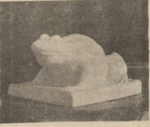
Bir kurbağa heykeli

Geçmiş insanların bize bıraktıkları prehistorik en eski resimler ve heykeller hayvanların örnekleridir. Örnek olmak üzere Altamira'da prehistorik bir mağarada bulunmuş olan "sıçramakta olan bir erkek domuz" şeklini göstereb-