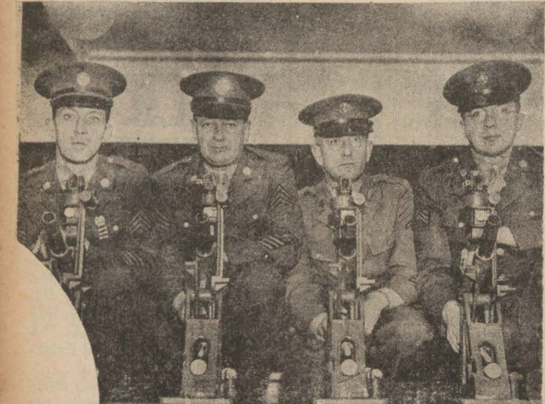
Amerika ordusunda tıbbî masacılığını indirmek maksadıyla küçük mikyastalim topları yapılmıştır. Resimde görülen bu küçük toplar, büyük topların bütün vasıf ve meziyetlerine maliktir.