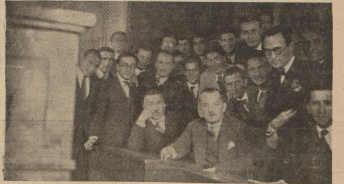
Gençler Birliğinin yıllık toplantısında bulunanlar

Ankaragücü 10 - Güneç (İttifakspor) 1 Çankaya 2 - Altınordu 0