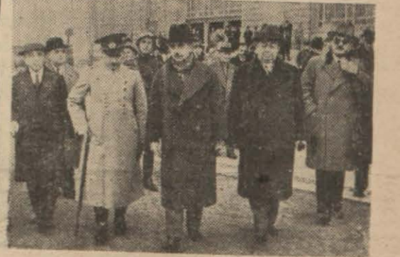
Başbakanımız İsmet İnönü Haydarpaşa'da

Başbakanımız Kırklarelinde coşkunca karşılandı