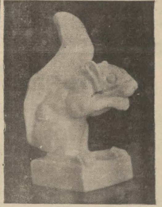
İde teşhir edilen bir hayvan heykeli

Bir çok yıllar önce profesör Rihter karısından kendi felsefe ve başlıca insan gövdesinin yapısına aid olan bilgilerinin, düşüncelerinin bir sembol ile gösterilmesi ve müccesem bir ifade verme-