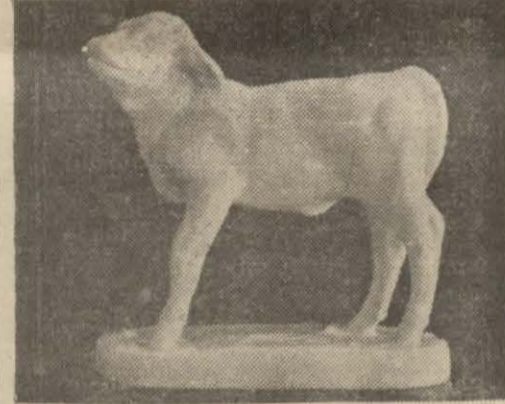
Etha Rihter'in bir başka eseri

Bunun yanında Eta Rihter'in elinden çıkmış olan şu resim de o eski domuzun benzeridir. Eta Rihter yeni ozanın modern hayvan heykel ve resim yarışmasıdır. Kendi yaptığı domuz resmine aynı vaziyeti, aynı hareket halini vermesi acaba bir tesadüf izimidir? Eski uzadaki sanatkar ile yeni sanatın bu karşılığı yalnız sanat düşüncesidir. Çünkü Eta Rihter bu resmi yaptığı zaman mağarada bulunan benzerinden haberi yoktu.