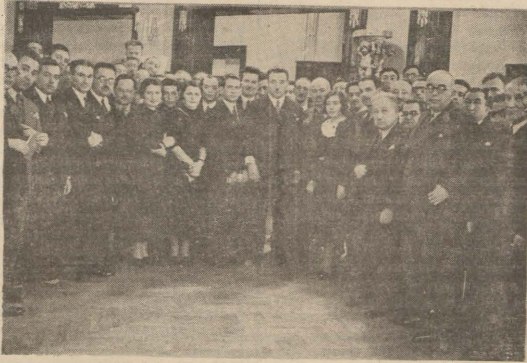
Dün hukukçuların çayında bulunanlar

Ankara'da bulunan Hukuk mezunları, aralarında bir topluluk yapmak teşebbüsü almışlardır. Bu eyi dileği güdenler, sağlam kuruma erişmek için, hukukçular arasında bir tanışma ve konuşma yapmağı faydalı bulmuş, Ankara Halkevinde bir çay vermiştir.