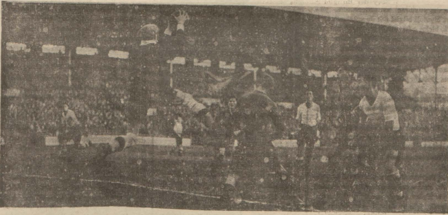
Avrupa profesyonelleri nasıl oynuyorlar?