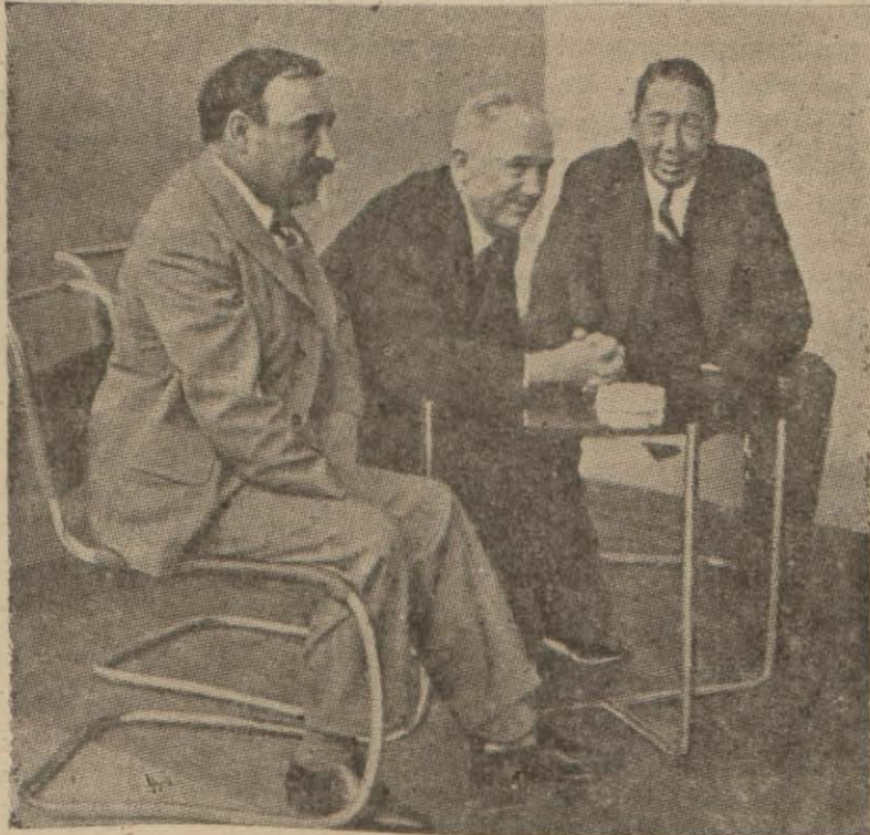
Küçük anlaşmanın uç bakanı

Cenevre, 7 (A.A.) — Alman hükümetinin muvafakati elde edilmiş ve inzibat tedbirleriyle meşgul olmanın artık Uluslar Cemiyeti konseyine ait bir iş olarak kalmış olması dolayısıyla Sar meselesi bilkuvve halledilmiş addedildiğinden şimdi macar - yugoslav meselesile iş- tigoal edilmiştir. Bu ise gayet nazik bir mesele olup M. eden, meseleyi Uluslar Cemiyeti konseyi huzuruna sevk-