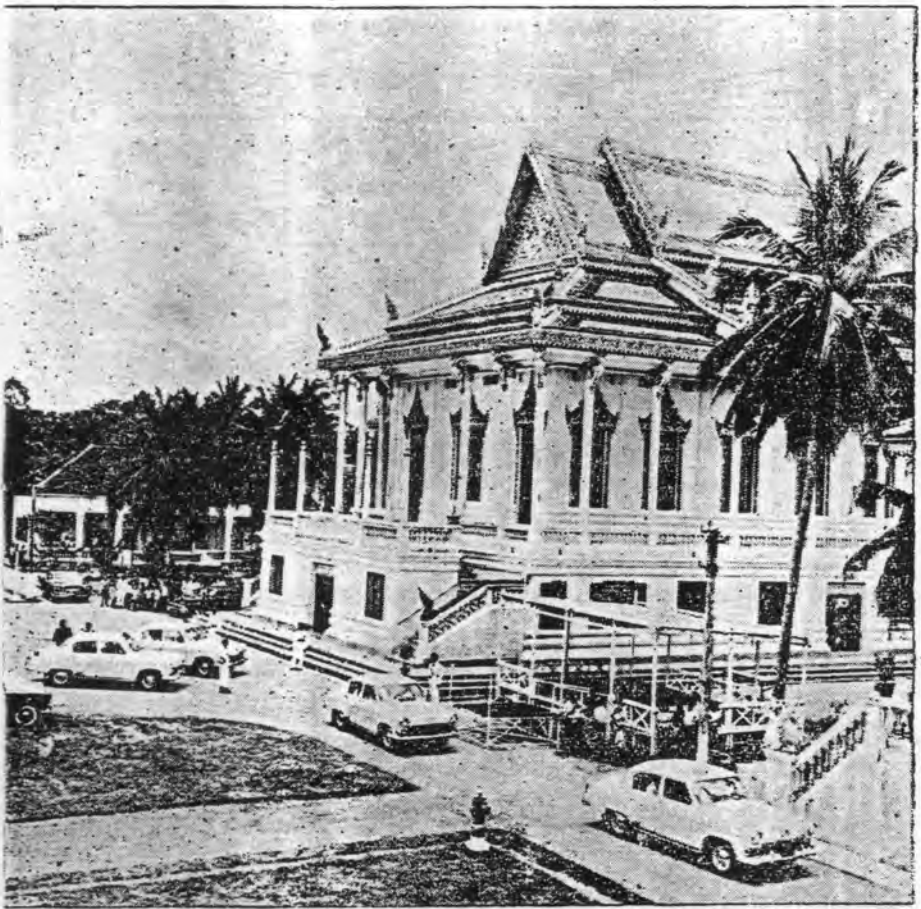
ព្រះវិហារវត្តពោធិវាល នៅមាត់ស្ទឹងសង្កែ ត្រើយខាងកើតទល់មុខផ្សារបាត់ដំបងជាព្រះវិហារល្អ ជាង ព្រះវិហារដទៃក្នុងខេត្ត