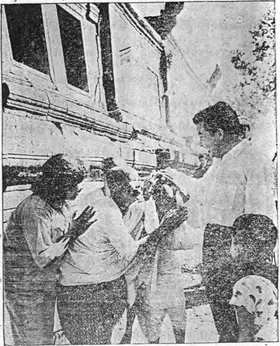
គូនចាស់ម្នាក់កំពុងចាប់ទាញដោយពេញចិត្ត គួរព្រះហស្តដឹកទំនៀមទម្លាប់នៃសម្តេចឪ មកដាក់លើក្បាល ខ្លួនដើម្បីសិរីសួស្តី ក្នុងកាលសព្វព្រះរាជបូជនីយេសកម្មនៅថ្ងៃ ទី ៥ - ២០៦៣