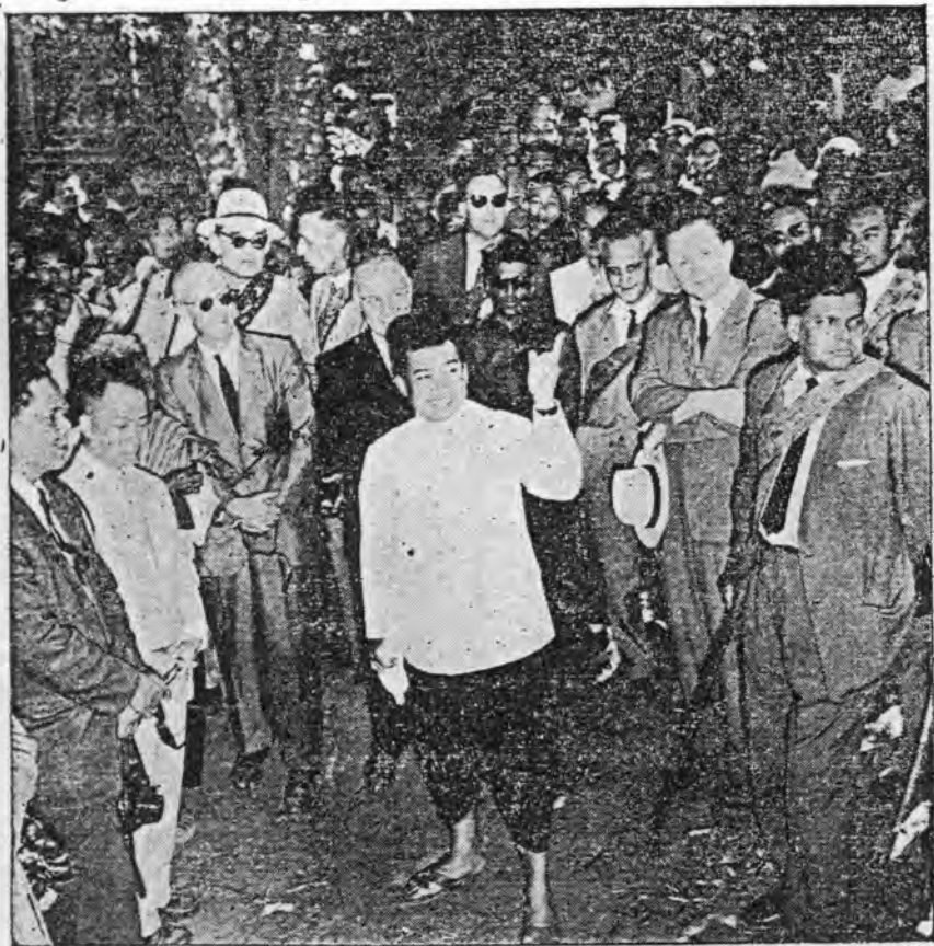
សម្តេចព្រះនរោត្តម - ស៊ីហានុព្រះប្រមុខរដ្ឋទ្រង់កំពុងមានព្រះបន្ទូលជាទីសណ្តាប់ដីលំអង្គុក តាតា នឹងប្រជាពលរដ្ឋជាតូចលើអំពីទិដ្ឋភាពផ្សេងៗ ដង្ហ្រះវិហារ ក្នុងទកាសព្រះរាជបូជី យេសកម្មនៅថ្ងៃទី ៥-២-៦៣ តារ្យ្រនេះ ។