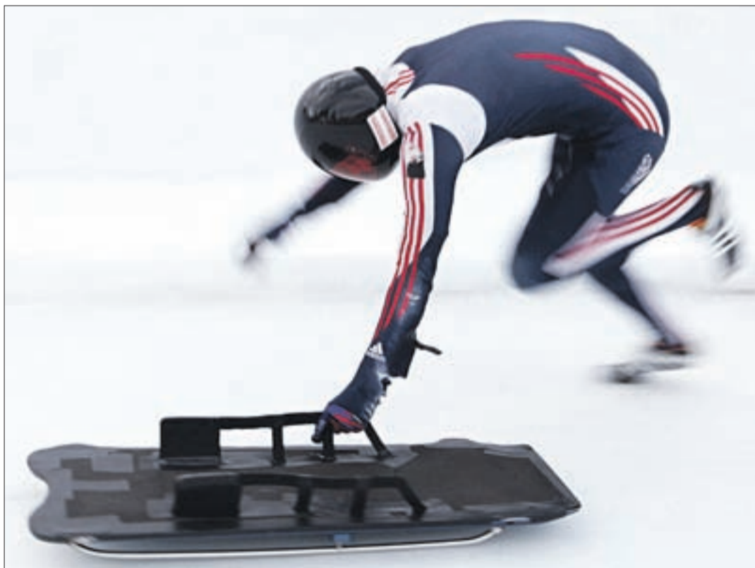
АЛЕКСАНДР ТРЕТЬЯКОВ ВСЕГДА РАЗГОНЯЕТ СВОЙ СНАРЯД ЛУЧШЕ СОПЕРНИКОВ. ОДНАКО ПО ХОДУ ГОНКИ ПРЕИМУЩЕСТВО КУДА-ТО УЛЕТУЧИВАЕТСЯ.