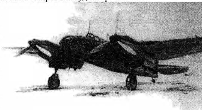
Бомбардировщик СБ – основной самолет – бомбардировщик, поставлявшийся из СССР в Испанскую Республику. 1938 г.

Таким образом, продажа военного снаряжения предполагалась с самого начала советских поставок. Оплата поставляемого оружия, транспортных расходов и услуг советников и специалистов-инструкторов предполагалась как по наличному расчету, так и в рамках кредитов, выделенных СССР