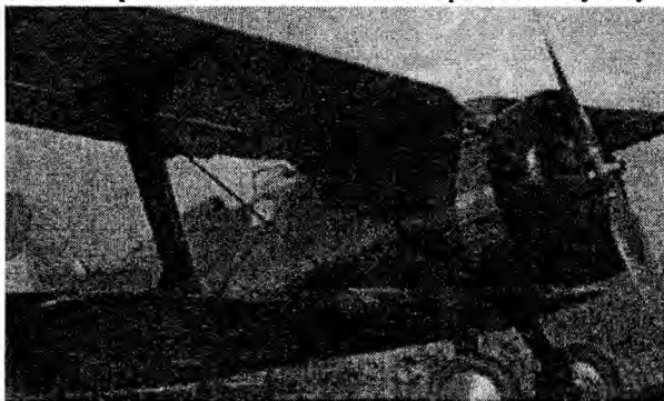
Истребитель И-15. 1936 г.

Когда золото было израсходовано. Советский Союз предоставил Испанской республике в марте 1938 г. кредит на сумму 70 млн. долл. сроком на три года и в декабре этого же года новый кредит на сумму до 100 млн. долларов.