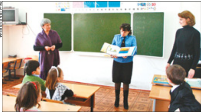
Рассказы о службе слушали, затаив дыхание.