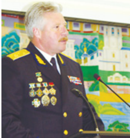
Генерал-майор Сергей Комаревцев.

Позади остались госзамены. На плечи легли лейтенантские погоны. И молодой офицер получает назначение в Северо-Западный пограничный округ. Направили в Выборгский пограничный отряд на заставу «Светогорская». Начальник заставы майор