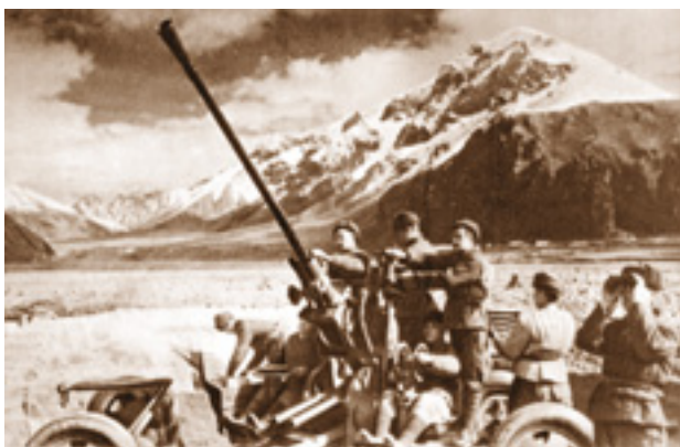
Зенитчики ведут огонь.

Как водится, третий за тех, кто не здесь, За всех, кто сегодня не с нами, За тех, не предавших ни верность, ни честь, Кто с жизнью расстался в Афгане. Пусть будет им луком родная земля. Надробля пестреют цветами. Пусть птицы поют им с утра до утра. Мы вас не забыли. Вы - с нами. ■