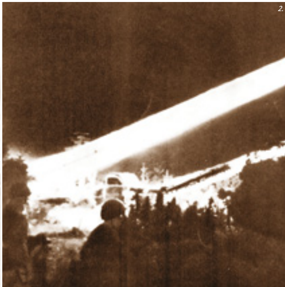
На фото: 1. Штурмовик Ил-2; 2. Средний бомбардировщик Пе-2; 3. Зал ракетных установок «катюш».