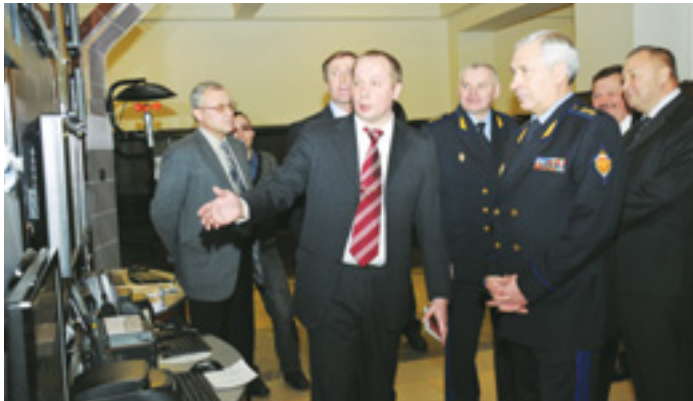
Выставка технических средств для границы.

В начале была дана характеристика обстановки, в которой пришлось работать подразделениям Пограничной службы и пограничных органов ФСБ России в прошедшем году. Она, по словам докладчика, несмотря на относительную стабильность и достаточную прогнозируемость существующего широкого спектра угроз национальной безопасности по всему периметру государственной границы Российской Федерации, имела и ряд новых факторов, обусловивших необходимость оперативного принятия соответствующих управленческих решений. В частности, в Северо-Кавказском регионе это потребовало из-за повышения террористической активности бандгрупп в приграничных районах Дагестана и Кабардино-Балкарии. На российско-казахстанском участке границы - в интересах проведения комплекса мер, направленных на обеспечение начала функционирования Таможенного союза. На морских направлениях - для нейтрализации появившихся новых изоцирковых мощностных схем, применяемых недобросовестными предпринимателями с целью расширения морских биоресурсов. Определённые усилия пришлось предпринять и для совершенствования работы пунктов пропуска через границу в