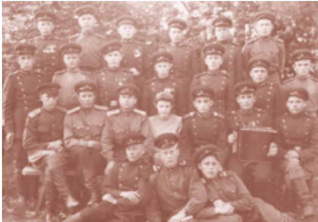
В кругу сослуживцев на заставе. 1949 год.