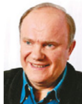
Геннадий Зюганов, депутат Государственной Думы Федерального Собрания РФ, руководитель фракции КПРФ.

Женат. Двое детей, семь внуков и внучка.