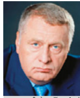
Владимир Жириновский, депутат Государственной Думы Федерального Собрания РФ, руководитель фракции ЛДПР.

Имеет почётное звание «Заслуженный юрист Российской Федерации».