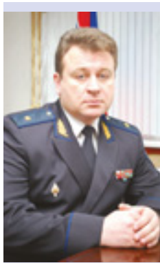
границного управления ФСБ России по Карачаево-Черкесской Республике.

- В то же время мы нашли понимание со стороны главы руководства Карачаево-Черкесской Республики. Совместными усилиями пределы по-