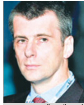
Михаил Прохоров, Президент ООО «Группа ОНЭКСИМ».

С 2011 года занимается политической деятельностью. В июле-сентябре 2011 года - председатель партии «Правое дело».