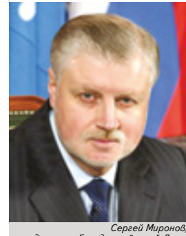
Сергей Миронов, депутат Государственной Думы Федерального Собрания РФ, руководитель фракции «Справедливая Россия».

Награждён орденом «За заслуги перед Отечеством» III степени. Женат. Воспитывает сына и дочь.