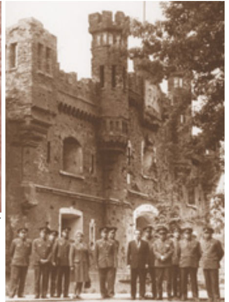
У стен Брестской крепости. 1985 год.