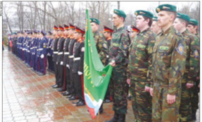
«Святогор» - будущее границы.