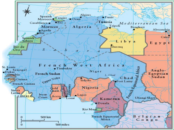
Northwest Africa to 1914

Katolik misyonerlerin en yoğun olduğu yer olarak bilinen Fransız Batı Afrika'sı, ilk ve ortaöğretimi kullanarak bürokrasiye yerli memur yetiştirmiştir. Dahomey'de Fransız etkisi altında yetişen gençler, ileride bürokratik burjuvanın çekirdeğini oluşturarak bütün siyasi hareketlere önderlik etmişler ve Dahomey toplumunun görüşlerinin şekillenmesinde önemli bir rol oynamışlardır. Birinci Dünya Savaşı yıllarında ortaya çıkan siyasi karışıklıklar ve ayaklanmalar, 1921'de çıkmaya başlayan Guide du Dahomey adlı gazetenin etkisiyle milliyetçi bir hale bürünerek Dahomey'in sosyal siyasal tarihinde önemli bir yere sahip oldu.