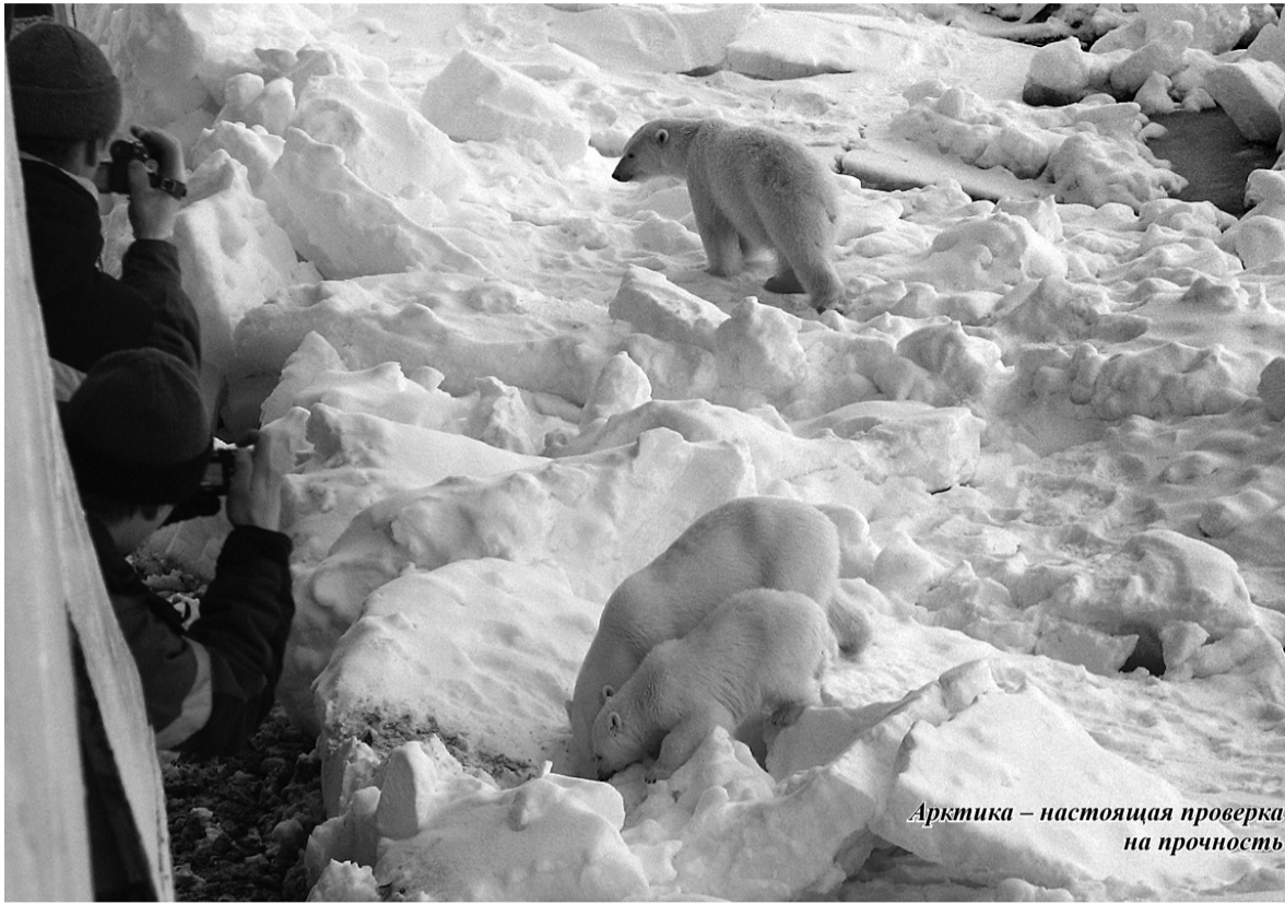
Арктика – настоящая проверка на прочность