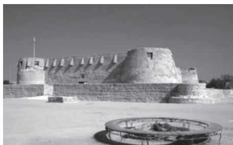
Сл. 2. Група интернираних Срба из Босне и Херцеговине у Араду 1914/15. Арадска тврђава данас.