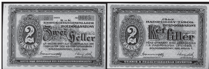
Сл. 14. Новчани бон из логора Болдогасоњ

Пљачкање заробљеника било је многобројно и разноврсно. Од почетка пљачке су вршене путем разних претреса у којима је одузиман новац, накит, сатови и други предмети од вредности. Српским логорашима нису дозвољавали пријем новчаних пошиљки од својих породица, него су тај новац стављали на депозит, који никада више нису добили. Уместо новца добијали су новчане бонове који су били и по четири, пет пута обезвређени у односу на добијени новац. Бонове су могли користити само у логорским кантинама, где су куповали храну која им је на разне начине била ускраћивана кроз следовања.