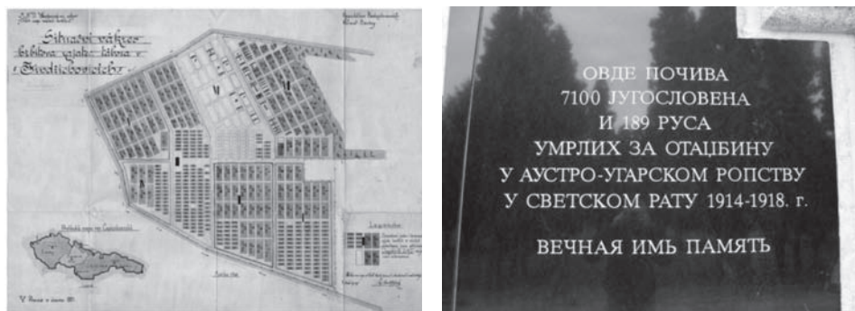
Сл. 11. Ситуациона скица гробља логора (1 : 200) и плоча на спомен-костурници у Јиндриховицама [Архив Југославије 1921а].

Међутим, ни до данас сва тела нису ексхумована. Поред ове спомен-костурнице, у једној шуми на око 5 км удаљености и сада постоји део гробља са око 1.600 гробова, од којих је преко 100 српских. Разлика се види и из броја гробних места и броја ексхумованих из гробља. Остали су највероватније Италијани, јер се „Италија држала назора да мртви треба да остану тамо где су сахрањени, док се Југославија приклонила француском начину решавања ратних гробља, а то значи ексхумацији и преношењу у костурницу” [Begenanová & Bružeňák 2012]. Али још увек велики број неексхумованих српских страдалника и даље лежи на гробљима, као што су она у Пардубицама (Pardubice) – 102, Опави (Opava) – 82, у Терезину (Terezín) – Алеја нација – 29, и др. у данашњој Чешкој Републици.