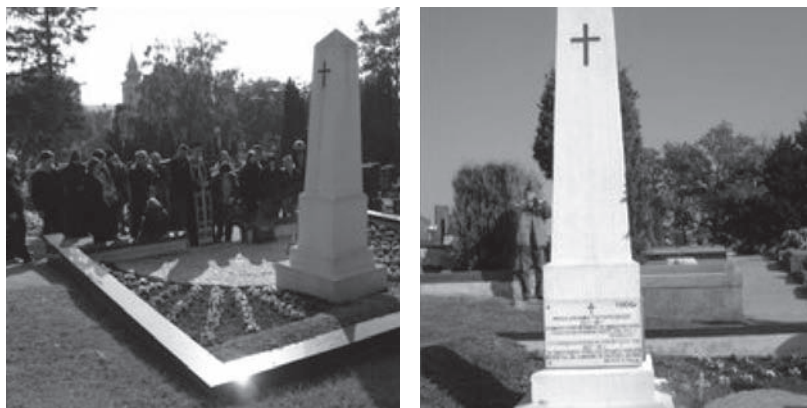
Сл. 5. Спомен-обележје са плочом умрлим нежидерским логорашима на градском гробљу

Велика смртност људи нагло је ширила гробље на Кавалији, које је од логора било удаљено пола сата хода. Према живом сећању Кривокапића [1976], који је присуствовао сахрани и своје мајке, „по двадесет лешева стрпавано је у једну раку. Покојници су сахрањивани просто као животињске лешине: без опела и прекаде, без прелива капљом заветног пића, без симбола хришћанства на гробу”. Само су на хумкама биле постављане таблице на чамовим летвама, са натписима „20 српских цивила” (20 serbische Zivile), које је врло брзо зуб времена уништио. На гробљу су 1924. године преживели интернирци добровољним прилозима подигли споменик у виду пирамиде, са урезаним крстом и записом. Услед небриге југословенских власти, бургенландске власти су 1953. године одобриле да се ово гробље преоре, а изоране кости премештене су у заједничку костурницу на градско нежидерско гробље заједно са скромним спомеником.