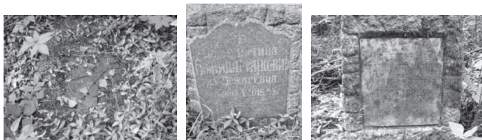
Сл. 12. Неки од српских гробова који још стоје на остатку гробља у Јиндриховицама.

Поред спомен-костурнице у Јиндриховицама, на територији Чехословачке у другим костурницама пренето је: (1) у Оломоуцу (Olomouc) у Моравској 1.187 посмртних остатака држављана Краљевине СХС, (2) на Олшанском гробљу у Прагу (Praha-Olšany) 85 пострадалих, док је 460 пренето у Јиндриховице и (3) у Тренчину у Словачкој 171 настрадао.