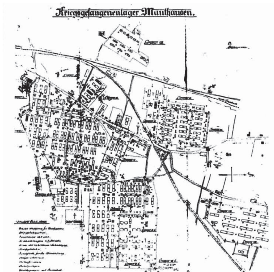
Lageplan des k. u. k. Kriegsgefangenenlagers Mauthausen (Original 69x54 cm, Maßstab: 1:2.880) mit den beiden Bahntrassen: oben = Summerauer Bahn / Anschlußstück - und unten geneigt = Donauuferbahn.