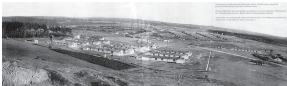
Сл. 9. Панорама логора Хајнрихсгрин (Линдриховице)