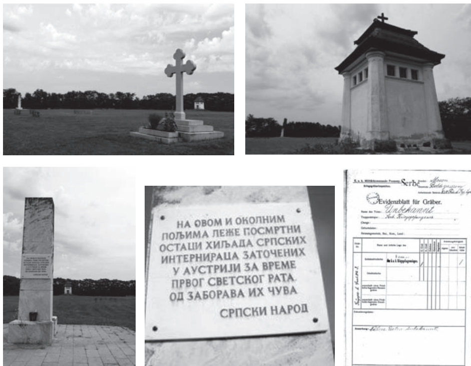
Сл. 6. Спомен-обележја на гробним пољима логора Болдогасоњ. Посмртница са ознаком „непознат (Unbekannt)“ „Србин (Serbe)“.