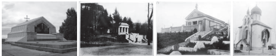
Сл. 1. Спомен-костурнице у Јиндриховицама (Чешка), Оломоуцу (Моравска), Тренчину (Словачка) и Олшанском гробљу у Прагу (Чешка).