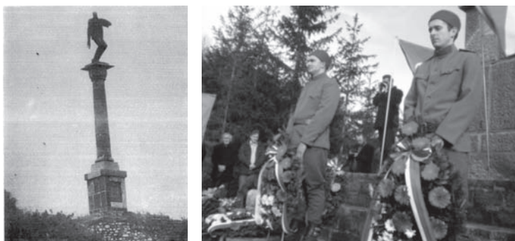
Сл. 3. Спомен-костурница у Добоју. Помен на 98-годишњицу формирања логора 27.12.2013. године