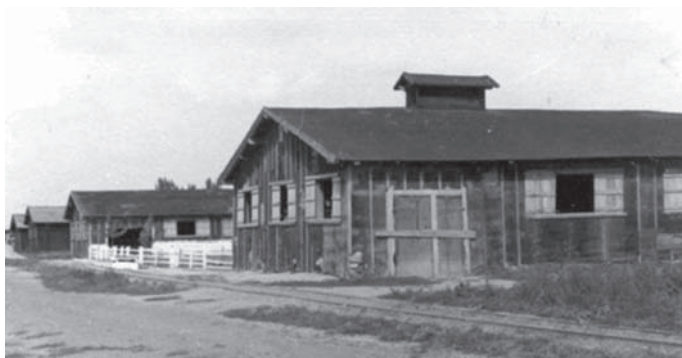
Сл. 4. Капела у гробљу и бараке логора Нађмеђер

Као и у другим логорима и овде су логораша били стално изложени глади, у оскудној одећи и обући и у свим условима упућивани на тешке, прљаве и опасне радове: у каменоломе, руднике, фабрике, на сечу шуме, пољопривредна имања велепоседника и сл. Поврх тога редовно су слати на тиролски фронт, где су под унакрсном ватром копали ровове, дотурали муницију, преносили артиљерију, уређивали њене ватрене положаје, да би за сваку наводну грешку били кажњавани смрћу бацањем са летица у провалију. Групе за фронт бројале су по 1.000 логораша, у сменама на шест месеци, а од њих се редовно половина није враћала. Исцрпљени и рањени остаци тих група обично су пребацивани у логор Ашах на Дунаву. Све је то Аустроугарска крила као строгу „државну тајну” од светске јавности.