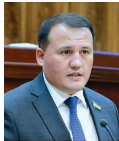
Актам ҲАЙТОВ, Олий Мажлис Қонунчилик палатаси Спикери ўринбосари

Сўнгги йилларда мамлакатимизда — янги Ўзбекистонда ёшларга муболағат бутунлай ўзгариб, ёш авлоднинг ҳаётини манфаатларини таъминлаш, уларнинг эзгу орзу-интилишлари, қобилият ва истеъдодини рўёбга чиқаришга қаратилган ташкилий-ҳуқуқий асослар ҳамда манфаатлиқ бормоқда.