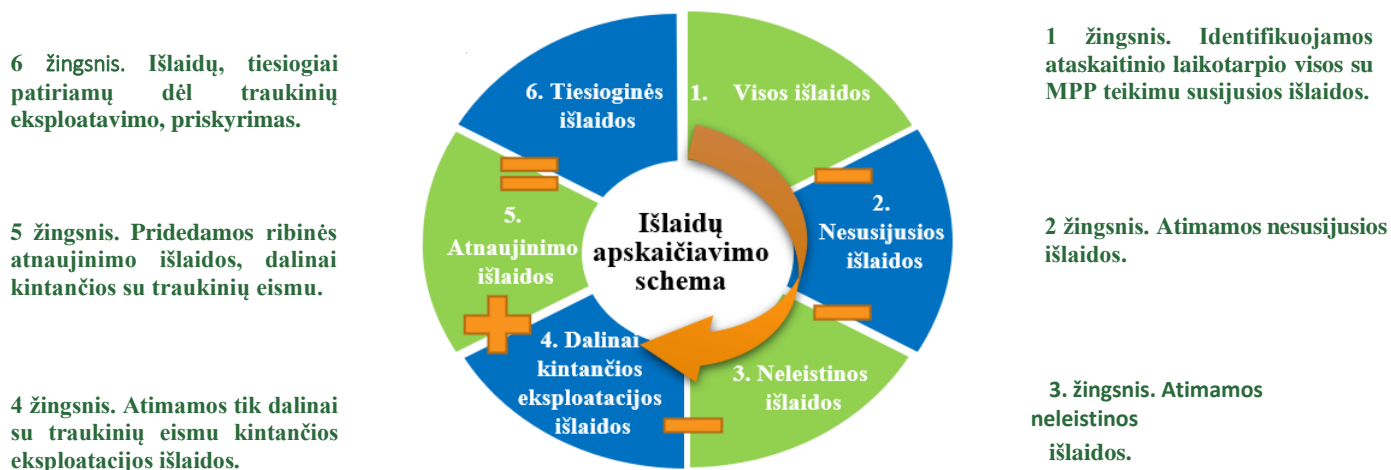
1 pav. Išlaidų, tiesiogiai patiriamų dėl traukinių eksploatavimo, apskaičiavimo schema

2.2. Išlaidos, tiesiogiai patiriamos dėl traukinių eksploatavimo, priskiriamos 6 žingsniais, nurodytais 1 paveiksle ir aprašytais Aprašo 2.2.1–2.2.7 punktuose.