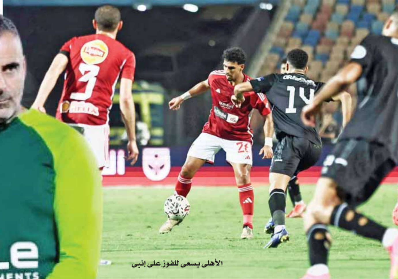
الأهلي يسعى للفوز على إنبي

ويحلم الكونغولي فيستون ماييلي مهاجم بيراميدز لاقتناص لقب هداف الدوري من أنياب الفلسطيني وسام أبو على مهاجم الأهلي. ويقود ماييلي فريقه بيراميدز صاحب المركز الثاني برصيد ٧٢ نقطة في مواجهة الداخلية صاحب المركز الأخير برصيد ١٩ نقطة. وسجل ماييلي ١٧ هدفاً بفارق هدف واحد عن وسام أبو على الذي يغيب عن اللقاءات لحصوله على راحة.