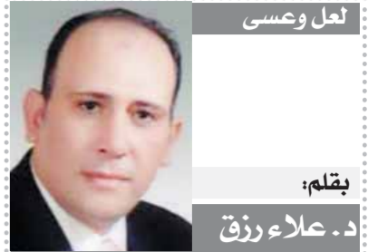
لقلم: د. علاء رزق