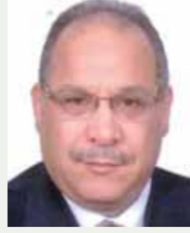
بقلم: حسين حلمي