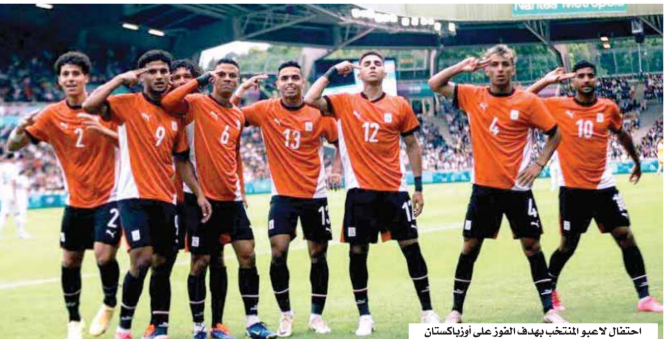
احتفال لاعبو المنتخب بهدف الفوز على أوزبكستان

قبل مواجهة إسبانيا المتصدر برصيد ٦ نقاط، وتقابلت مصر مع إسبانيا في أولمبياد طوكيو في يوليو ٢٠٢١ وانتهت بالتعادل بدون أهداف. واستعاد الفراعنة نعمة الانتصارات الأولمبية بعد ٣ سنوات، حيث كان آخر انتصار للفراعنة في الأولمبياد أمام استراليا بهدفين دون رد سجلهما أكرم توفيق وأحمد ياسر ريان. وضمن كل من إسبانيا وفرنسا واليابان، التأهل