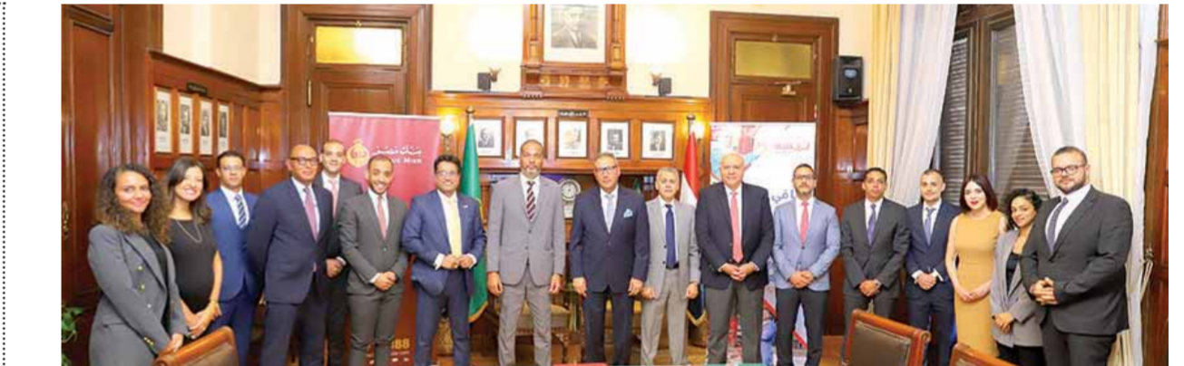
الانتربي خلال توقيع الاتفاقية مع قيادات البنك والشركة