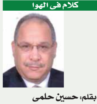
كلام في المهوا

لمزيد من الأخبار والتقارير المصورة ALWAFD.NEWS