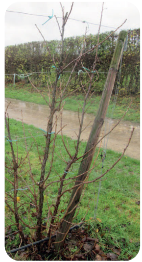
Rode bessenhaag voor en na het snoeien van zwak hout en te lange zijtakken

Voor het jaarlijks onderhoud blijven we dezelfde snoeiwijze hanteren: jaarlijks een paar sterke grondscheuten bewaren die een zwakkere gesteltak vervangen.