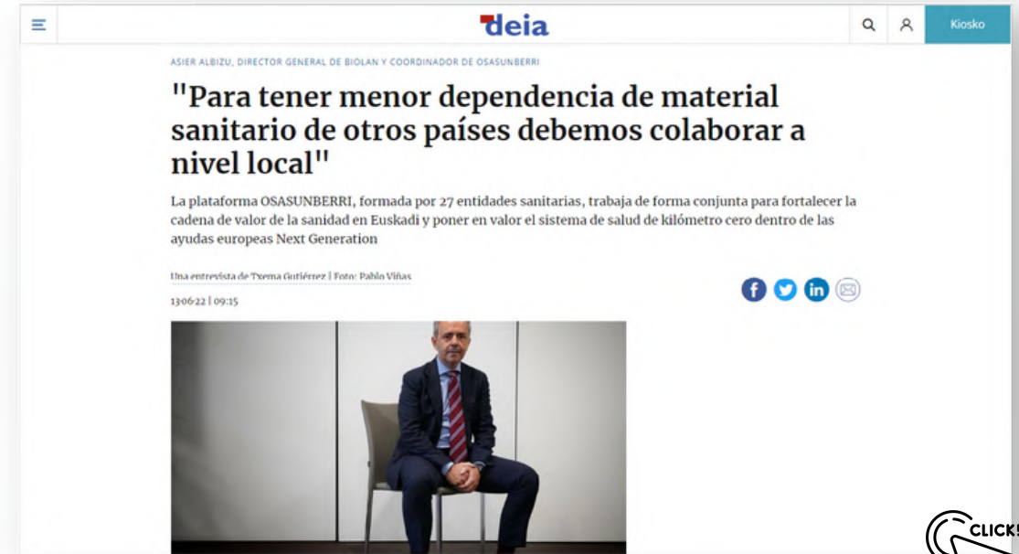
119 páginas vistas - 97 usuarios