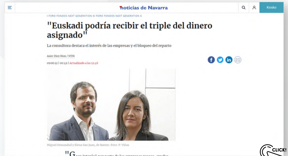
1.199 páginas vistas - 983 usuarios