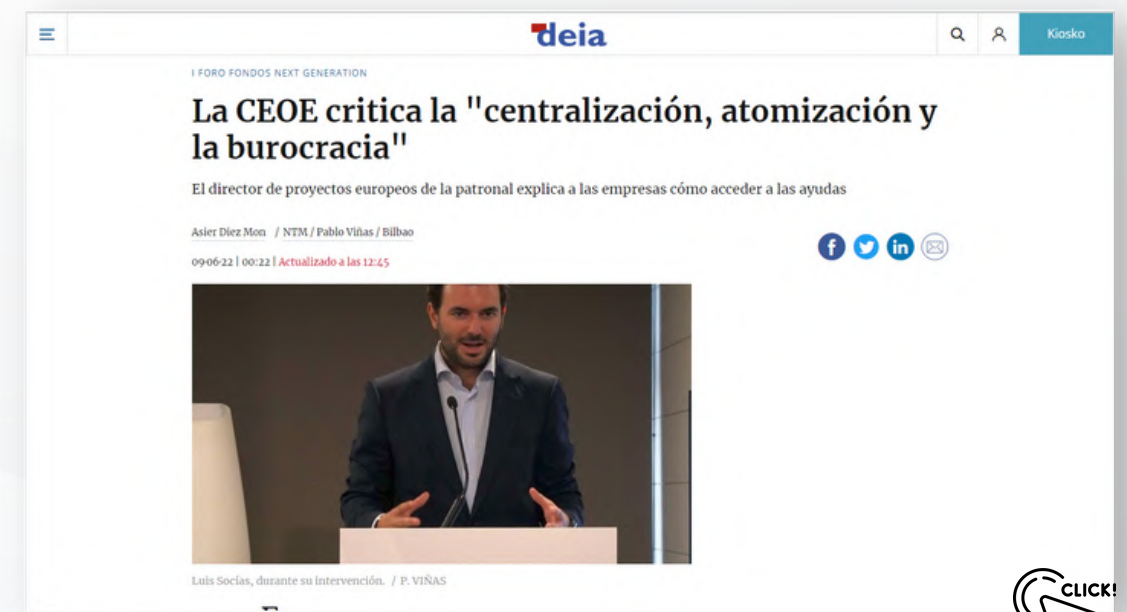
163 páginas vistas - 80 usuarios