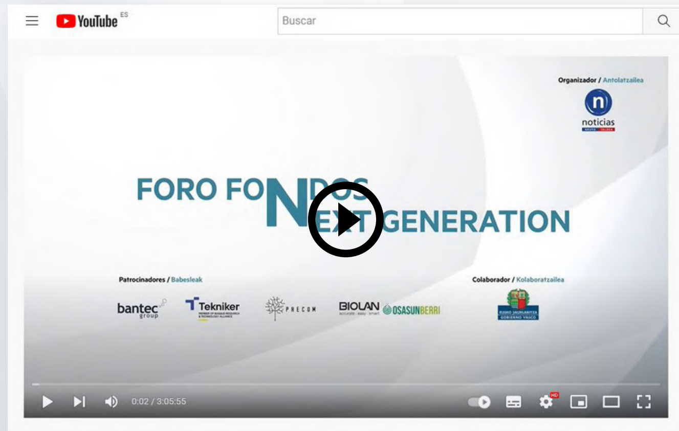
Vídeo del evento