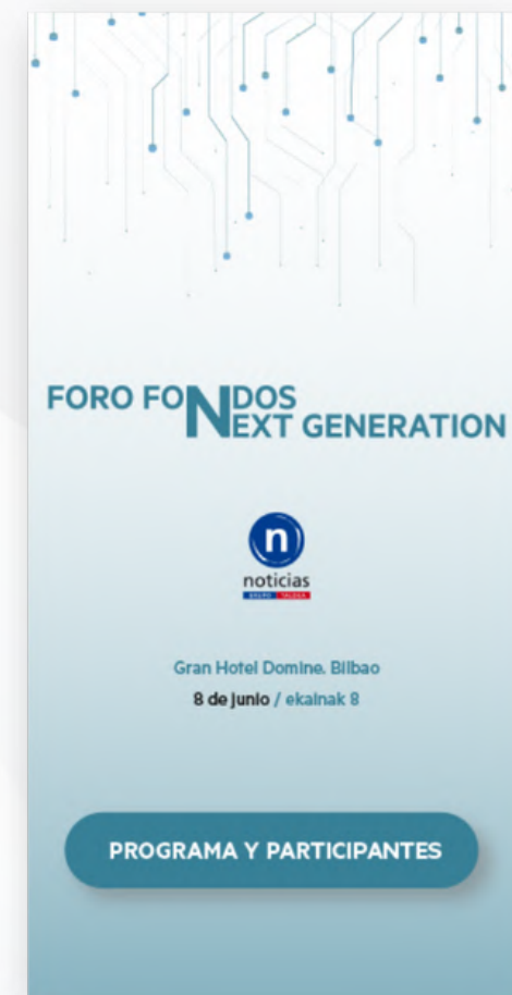
Banner publicado 2 días (6-7 junio)