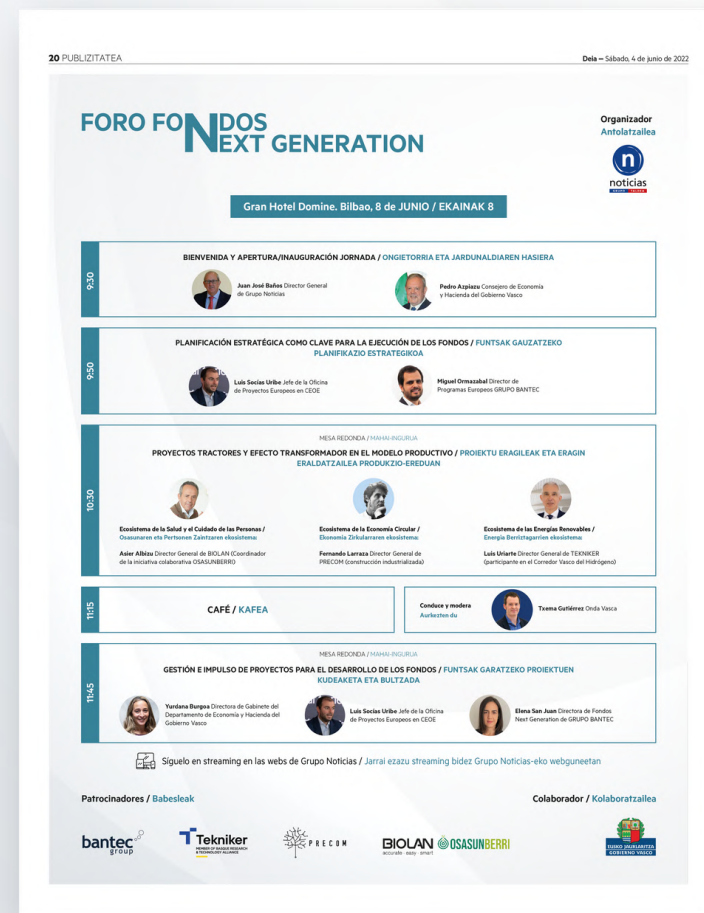
Anuncio del foro publicado 5 días (3-7 junio)