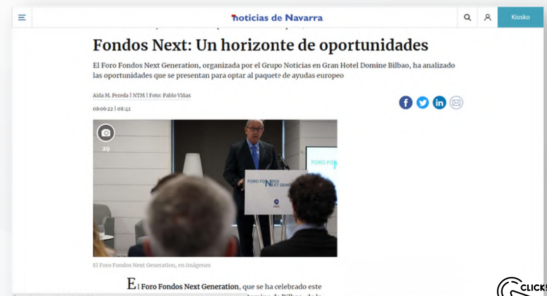
2.052 páginas vistas - 1.354 usuarios