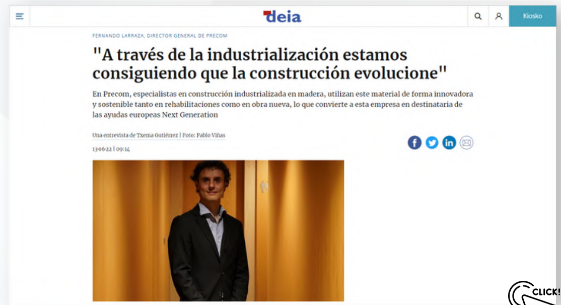
175 páginas vistas - 96 usuarios