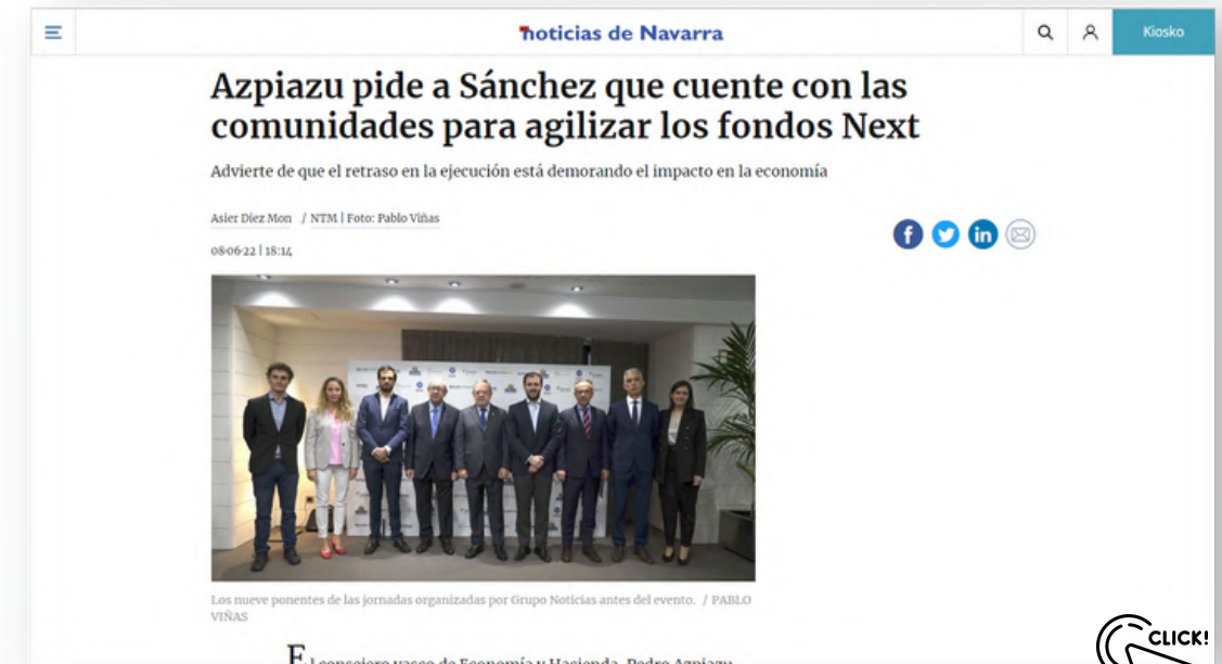
667 páginas vistas - 477 usuarios