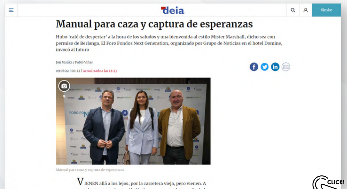
197 páginas vistas - 148 usuarios