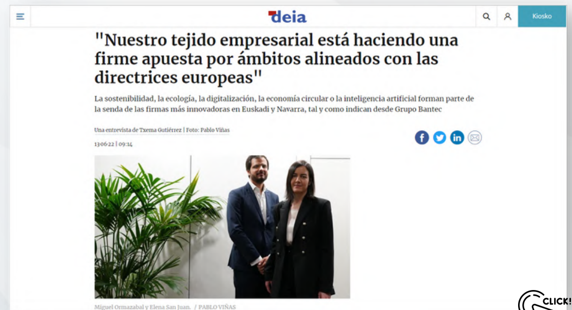
166 páginas vistas - 130 usuarios