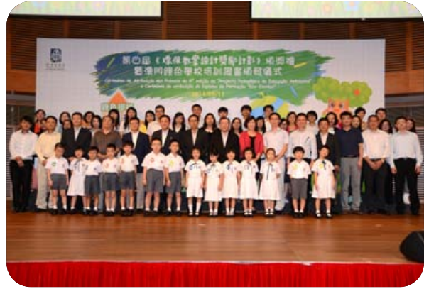
第四屆《環保教案設計獎勵計劃》頒獎禮暨澳門綠色學校培訓證書頒發儀式