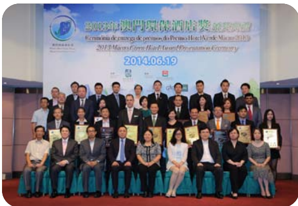
歷屆得獎酒店代表與主禮嘉賓合照

澳門環保酒店獎由環境保護局主辦，旅遊局協辦，並獲澳門酒店旅業商會、澳門酒店協會、澳門生產力暨科技轉移中心及澳門酒店旅業職工會作為支持機構，至今已舉辦至第七屆。