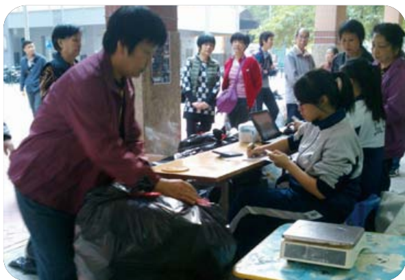
市民積極參與資源回收工作