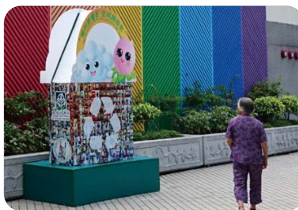
匯集「我撐減塑」相片而成的宣傳品於不同社區巡迴展出

同時，亦透過不同渠道宣傳「減塑」訊息，包括與公共部門、社團及學校等合辦不同類型的「減塑」活動，及與多間機構合作打造綠色書展，廣泛宣傳「減塑」訊息，推廣「減塑」風氣。