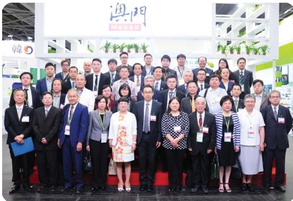
環境保護局組織代表團出席“2014國際環保博覽”