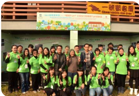
環境保護局代表及嘉賓與一眾環保Fans合照

環境保護局於2014年1月於路氹城生態保護區舉行「2014世界濕地日—“環保Fun”之環保行為擺滿Fun啟動禮」。推出“環保Fun”之環保行為擺滿Fun，發動來自社會各界對環保充滿熱忱的人士加入“環保Fun”前線工作團隊，成為“環保Fans”，首階段招募了約40名環保Fans。