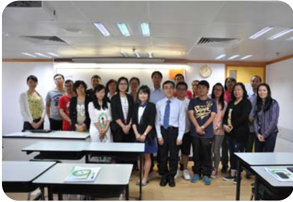
《澳門綠色學校環境管理指南》進階培訓