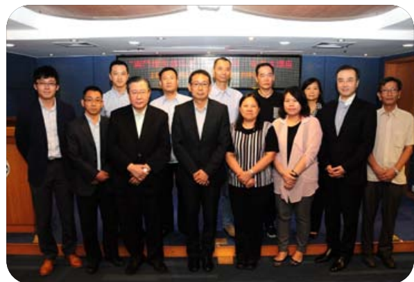
出席“澳門環保酒店獎之減廚餘、省成本”講座的嘉賓及酒店代表

截至2014年，參與歷屆並獲頒澳門環保酒店獎的酒店數目合共31間，其酒店客房總數量超過17,000間，約佔整體酒店客房總數量的六成。此外，獲獎酒店於2014年參與環境保護局舉辦的講座、培訓和參觀交流活動，以學習和交流有關實踐酒店管理和設施管理的經驗，尤其在減廢和節能方面的環保工作成效。