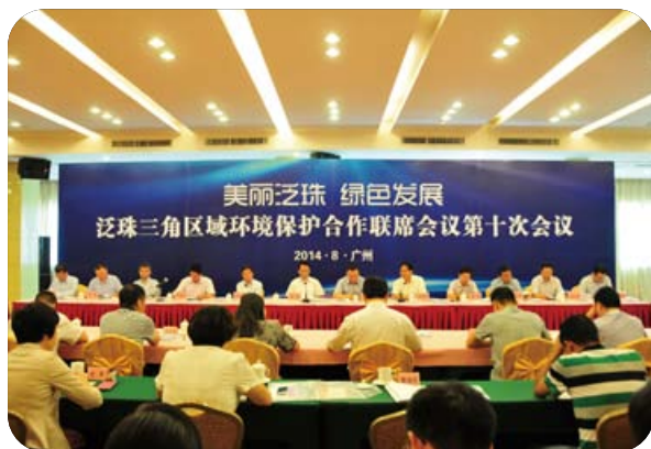
泛珠三角區域環境保護合作聯席會議 第十次會議