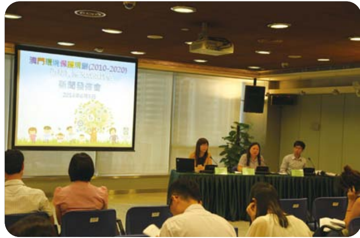
《澳門環境保護規劃（2010－2020）近期實施及成效評估》及新聞發佈會