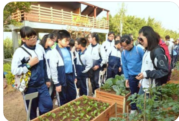
環境保護局人員向綠色學校學生介紹各種植物

為響應每年4月22日地球日，環境保護局於2014年地球日舉辦了“2014地球日—澳門公眾環境意識調查發佈及減塑愛地球”活動，發佈“2013澳門公眾環境意識調查”結果，並舉行了「2014減塑有著數」活動的啟動儀式。