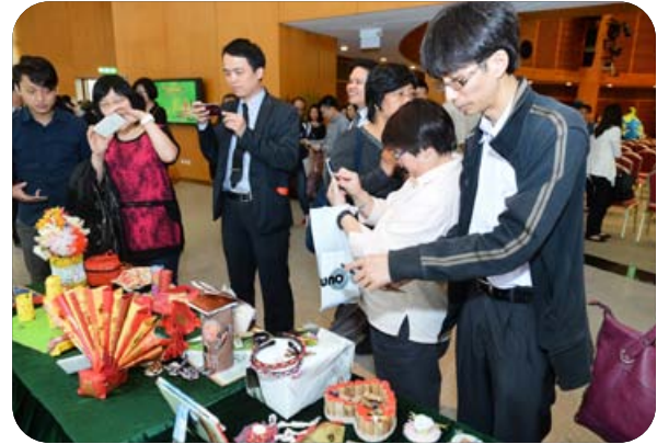
環境保護局舉辦「2014地球日－澳門公眾環境意識調查發佈及減塑愛地球」活動

此外，為使環保意識滲透至社區，環境保護局於2014年6月世界環境日期間舉辦以“減用塑膠袋 全城綠起來”為主題的2014澳門環保週系列活動，並圍繞“源頭減廢”、“減塑”的主旨舉辦了系列活動，共吸引近60,000人次參與。