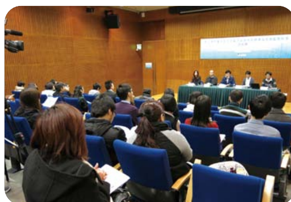
《制訂澳門重大固定空氣污染源排放標準及完善監管制度》的諮詢會