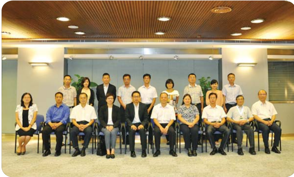
2014年珠澳環保合作工作小組會議與會代表合照