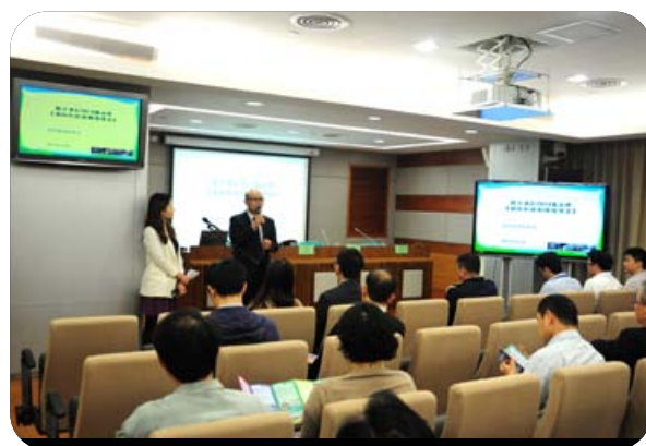
環境保護局聯同治安警察局與社團代表交流新噪音法