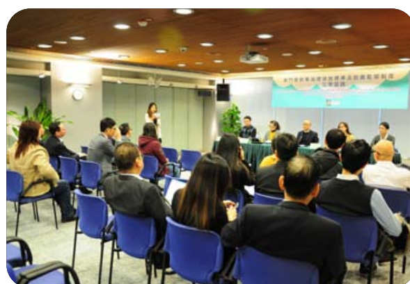
《澳門餐飲業油煙排放標準及完善監管制度》諮詢新聞發佈會及業界諮詢會