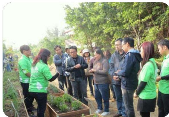
環保Fans向嘉賓介紹自然研習徑之植物