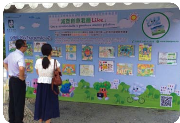
「減塑我有計」創意繪畫比賽得獎作品