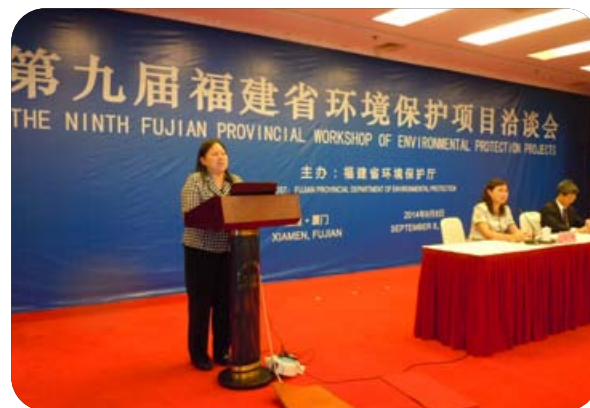
黃蔓荳副局長於「第九屆福建省環 保項目洽談會」致辭