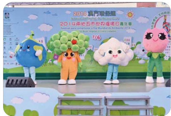
四位環保吉祥物：“地球先生”、“綠樹太太”、“白雲哥哥”以及“小花妹妹”

環境保護局為響應9月22日“世界無車日”，鼓勵居民多選用綠色出行的方式，在珠澳環保合作工作小組的機制下，聯同珠海市環境保護局合辦，澳門大學及中國澳門單車總會協辦“2014世界無車日之澳珠減碳單車遊”活動，共吸引了約120名來自珠澳兩地的參與者，分享綠色出行的樂趣。