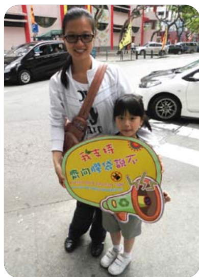
市民手持「減塑」宣傳標語

及支持相關活動，以展示對「減塑」的決心；其後更將收集之相片製作成宣傳品，於澳門各社區進行為期約半年的巡迴展覽。