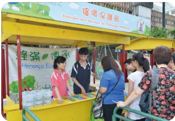
親子環保攤位遊戲

此外，為使環保意識滲透至社區，環境保護局於2014年6月世界環境日期間舉辦以“減用塑膠袋 全城綠起來”為主題的2014澳門環保週系列活動，並圍繞“源頭減廢”、“減塑”的主旨舉辦了系列活動，共吸引近60,000人次參與。