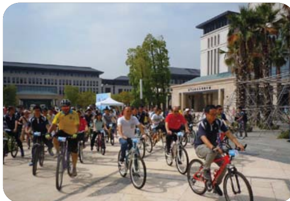
“2014世界無車日之澳珠減碳單車遊”

此外，環境保護局為持續推動源頭減廢，連續第五年與澳門美食節主辦單位澳門餐飲業聯合商會合作推動「美食節減廢計劃」，藉著美食節鼓勵社會以環保餐具取替一般的非環保餐具，減少對環境所造成之影響。