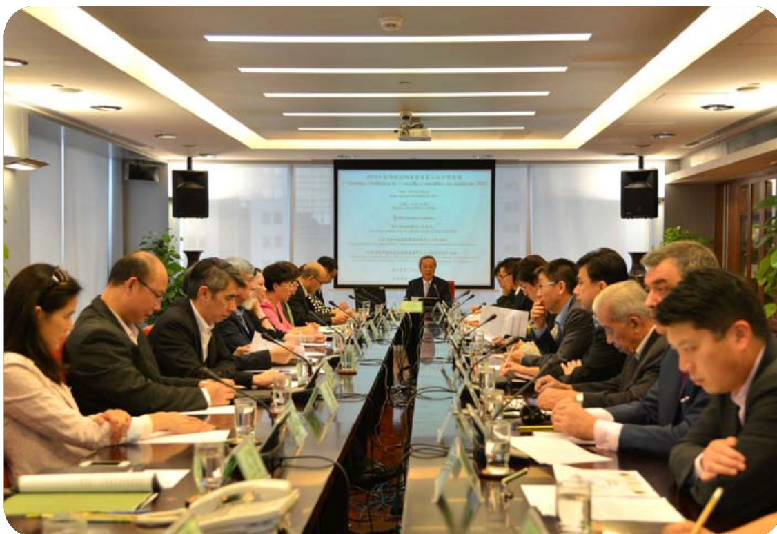
環境諮詢委員會第二次會議