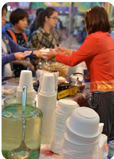
環境保護局首次推動美食節攤位 採用大會指定之環保餐具