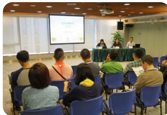
澳門項目環評制度進行前期交流與溝通

於2014年，環境保護局收到由公共部門轉介的8個新增項目之環評報告及相關資料，並已就相關報告資料提供了環境範疇的技術意見。