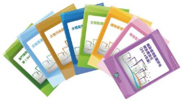
《編寫環境影響評估報告書指引》（2014年版）

環境保護局為構建澳門項目環境影響評估制度，在過去工作的基礎上，於2014年10月更新了《編寫環境影響評估報告書指引》（2014年版），同時推出了一系列《環境影響評估指引》，以逐步規範環評報告的內容，讓業界和公眾更清晰環評報告的編排及具體工作內容，提升編寫環評報告的效率。