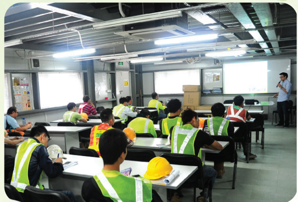
環境保護局舉辦《預防和控制環境噪音》法律座談會