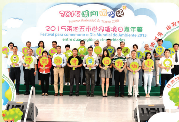
2015兩地五市世界環境日嘉年華啟動儀式

此外，為響應國際性環境保護節日－6月5日“世界環境日”，以及持續提升澳門居民的環保意識，鼓勵其積極實踐環保行為，環境保護局連續第五年舉辦“澳門環保週”系列活動，並以“源頭減廢 由我做起”作為活動主題，舉辦一系列“源頭減廢”宣傳活動。