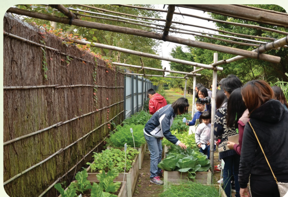
導賞員帶領參觀者到自然研習徑觀賞兩旁栽種的植物

環境保護局持續接待來自不同地區的機構、學校、社團等參觀者到轄下的環保基礎設施參觀學習，2015年全年共接待約4,380人次。