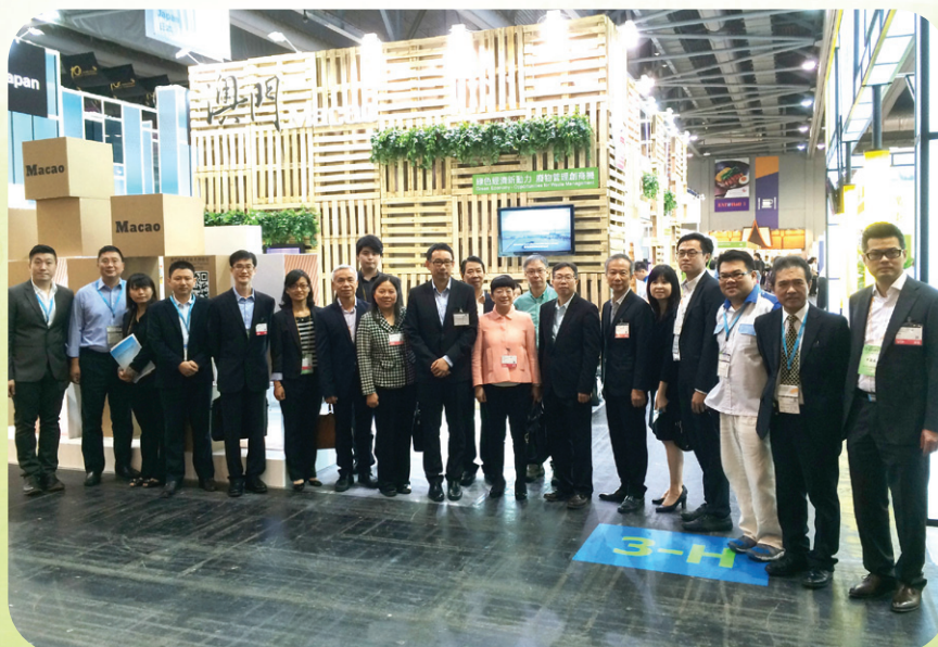
環境保護局組織代表團參加香港“2015國際環保博覽”

在港澳環保合作方面，雙方一直積極而務實地推進了在政策、聯防聯治、監管制度、環境監測、環境影響評估、宣傳教育合作以及環保產業等多方面的交流合作。在2015年7月於澳門召開港澳環保合作第七次會議，總結過去區域空氣監測網絡優化以及區域性細顆粒物（PM 2.5 ）聯合研究、環保技術交流、環保博覽及研討會等工作進展，更擬定了未來一年的港澳環保合作計劃。此外，環境保護局亦於2015年10月組織一行約20人之代表團，到香港參加“2015國際環保博覽”及同期舉辦的“亞洲環保會議”。