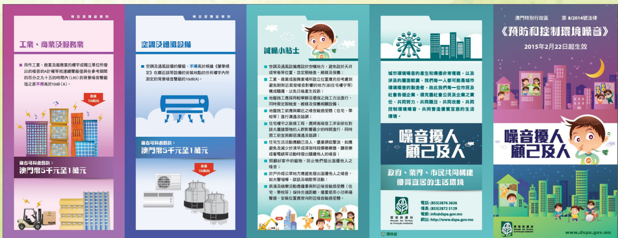
噪音法宣傳小冊子