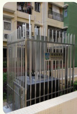
路環石排灣之監測站

2015年澳門共設有5個環境噪聲監測站（3個設於澳門半島、1個設於氹仔、1個設於路氹填海區），透過自動化網絡對環境噪聲、道路交通噪聲、工商住宅混合區噪聲進行24小時監測。此外，環境保護局為完善環境噪聲監測網絡，已於路環石排灣社會房屋範圍內增設了一個環境噪聲監測站，並於2015年進行相關調試工作。