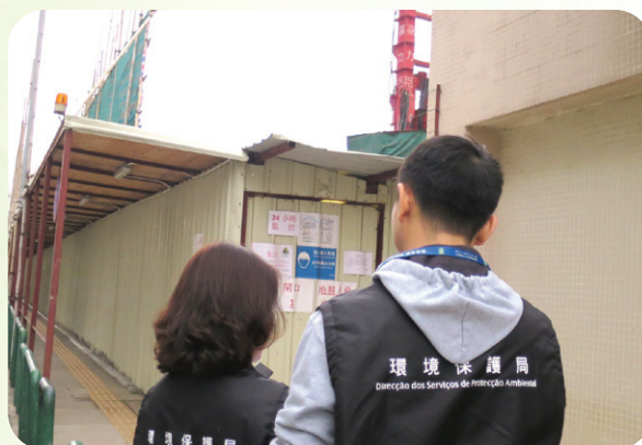
本局人員進行環境噪音執法工作

另外，環境保護局及治安警察局自第8/2014號法律《預防和控制環境噪音》生效後，持續進行執法和巡查工作，自法律生效至2015年12月31日，兩局共收到7,312宗噪音投訴個案，主要以社會生活噪音、工商服務業、空調通風設備及工程施工噪音個案為主，九成投訴個案已完成處理。