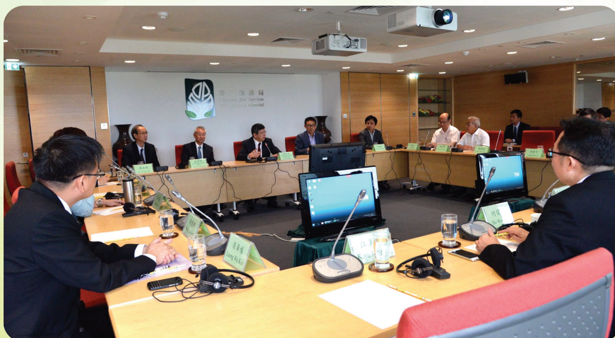
環境諮詢委員會舉行2015年度平常會議