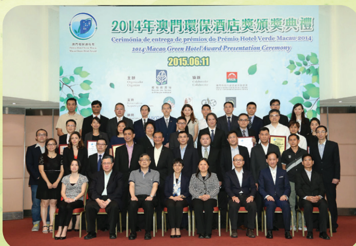
歷屆得獎酒店代表與主禮嘉賓合照

由環境保護局主辦，旅遊局協辦，並獲澳門酒店旅業商會、澳門酒店協會、澳門生產力暨科技轉移中心以及澳門酒店旅業職工會作為支持機構，香港生產力促進局為顧問機構的“澳門環保酒店獎”2015年已舉辦至第八屆。