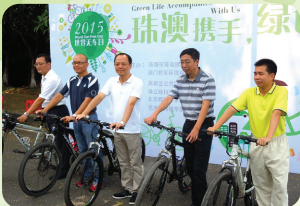
環境保護局聯同珠海市環境保護局合辦2015世界無車日之珠澳減碳單車遊

為響應9月22日“世界無車日”，在珠澳環保合作工作小組的機制下，環境保護局聯同珠海市環境保護局合辦“2015世界無車日之珠澳減碳單車遊”活動，向參加者推廣綠色出行的樂趣。