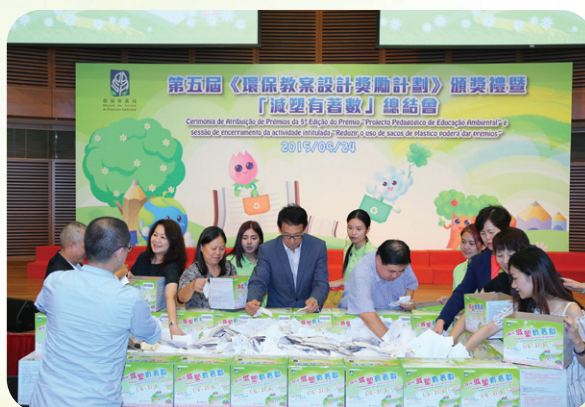
「減塑有著數」活動體現各方合力共推環保