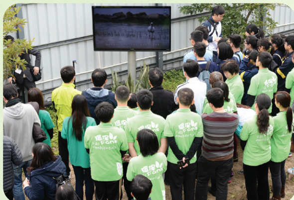
環境保護局舉行2015世界濕地日－環保Fans 嘉許 及路氹城生態保護區宣傳片發佈儀式

的工作團隊－環保Fans進行嘉許，並發佈路氹城生態保護區宣傳片，為澳門自然生態資源教育的軟硬件創造更完備的條件。