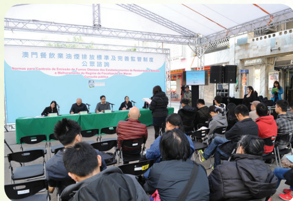
《澳門餐飲業油煙排放標準及完善監管制度》的公開諮詢會