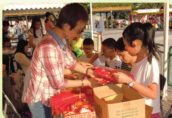
環保工作坊導師教授如何化廢為寶