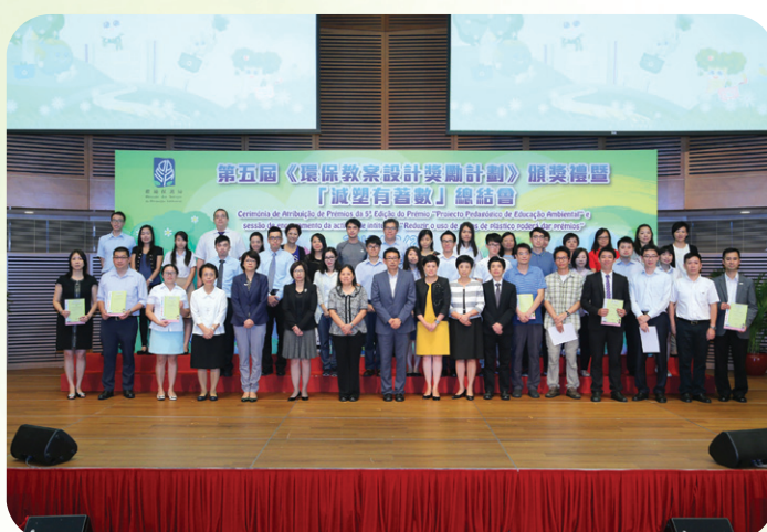
第五屆“環保教案設計獎勵計劃”頒獎禮暨「減塑有著數」抽獎儀式

2015年亦舉辦第五屆“環保教案設計獎勵計劃”，並於10月組織得獎教師及協辦機構代表到訪吉隆坡進行環境教育考察交流。此外，於2015年4月首次推出“環保校園嘉Fun獎”，合共28間綠色學校得獎。