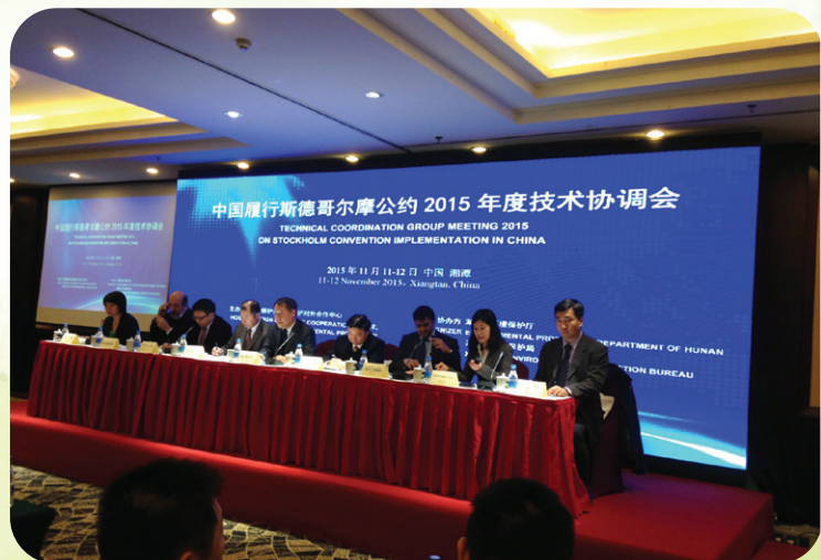
中國履行斯德哥爾摩公約能力建設項目2015年度技術協調會

環境保護局代表於2015年9月於福建廈門參加“第十屆福建省環保項目洽談會”，並推介2016澳門國際環保合作發展論壇及展覽（2016MIECF）。同年11月應邀出席在湖南省召開的“中國履行斯德哥爾摩公約能力建設項目2015年度技術協調會”，了解中國有關斯德哥爾摩公約履約的執行情況及成效。