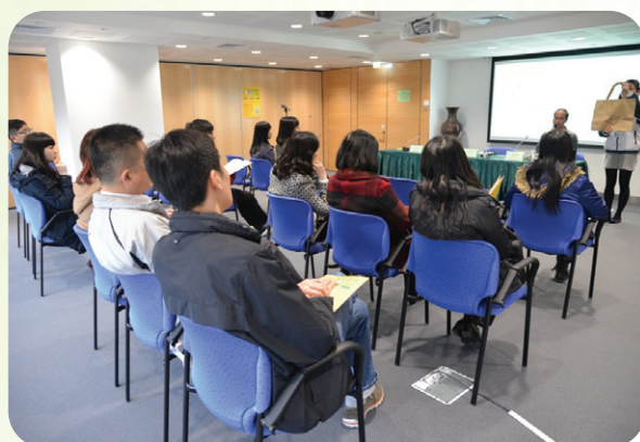
《推行限制使用塑膠購物袋之制度》的公開諮詢會