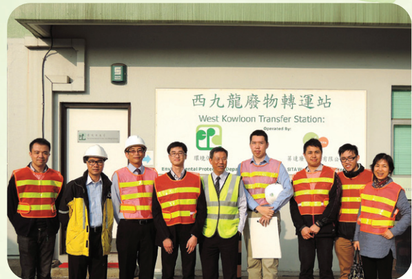
本局人員前往香港西九龍廢物轉運站作實地視察

環境保護局派員到香港，與香港環境保護署就建築地盤污水排放的管理經驗進行交流，從中了解香港建築地盤污水排放的准照制度、准照申請程序及內容、落實監管及執法的具體方法、相關法規、罰則及處罰程序等。同時，亦就隔油井油脂廢水及其收集的流動缸車的管理經驗進行交流。