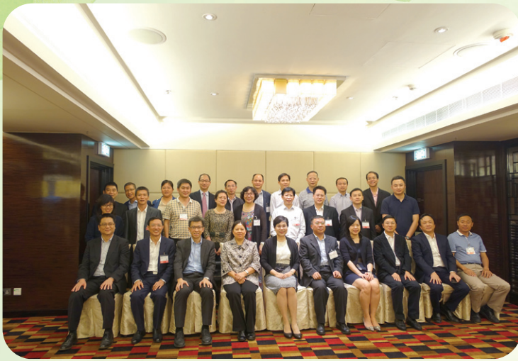
泛珠三角區域環境保護合作環保技術交流會

此外，環境保護局先後參加了“泛珠三角區域黃標車管理工作交流會”、“泛珠三角區域環境保護體制改革創新交流會”、“泛珠三角區域環境保護合作聯席會議第十一次會議聯絡員工作會議”、“泛珠三角區域環境保護合作聯席會議第十一次會議”、“第十屆福建省環保項目洽談會”以及“泛珠三角區域環境保護合作環保技術交流會”等各項活動。