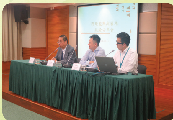
環境保護局邀請鄰近地區之專家與本澳政府部門進行環評經驗分享會

環境保護局為加強各界對環境影響評估制度（簡稱環評）的認識，於2015年舉辦了針對業界之環評說明會，並邀請鄰近地區之專家與澳門政府部門進行了環評經驗分享會。同時，在過去項目環境影響評估制度意見徵集、研究、清單試行及評估指引等工作基礎上，將持續進行項目環境影響評估制度的構建工作。