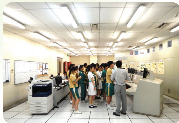
學校團體參觀澳門垃圾焚化中心中控室