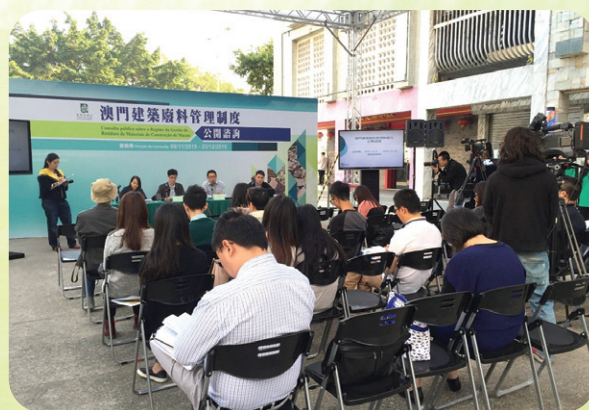
《澳門建築廢料管理制度》的公開諮詢會