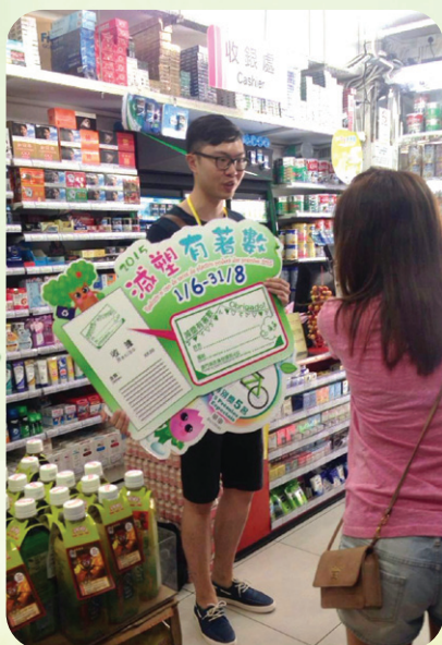
「減塑有著數」活動有助推動自備購物袋氛圍

為讓市民持續將「減塑」意識轉化為實際行為，環境保護局與消費者委員會、澳門百貨辦館業商會等8個協辦單位繼續合作推出「減塑有著數」活動，鼓勵市民自備環保袋。活動獲27間參與商號合共超過130間分店的積極響應，以及市民積極參與，舉辦三年的累計參與人次超過十萬，累計節省最少十萬個塑膠購物袋。活動經驗顯示，市民自備購物袋的意識逐步提高。