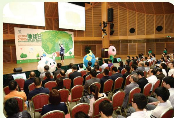
環境保護局舉辦“2015地球日－澳門公眾環境意 識調查發佈及減塑愛地球”活動

環境保護局為響應每年4月22日地球日，於2015年4月22日舉辦“2015地球日－澳門公眾環境意識調查發佈及減塑愛地球”活動，發佈“2014澳門公眾環境意識調查”結果，並圍繞減塑為主題，向社會傳遞珍惜資源、愛護地球的訊息。