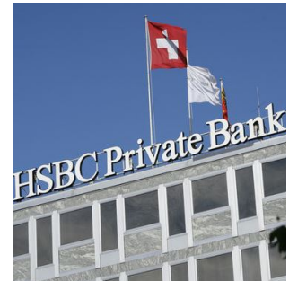
Die Swisслеaks-Enthüllungen rund um die Genfer Niederlassung der HSBC