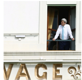
John Kerry in Lausanne anlässlich der Atomverhandlungen mit dem Iran

« Iran Nuclear talks: Behind the scenes at Lausanne » (BBC)