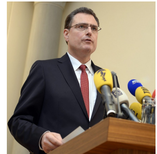
Thomas Jordan, Präsident des Direktoriums der SNB

« HSBC in Swiss tax avoidance storm » ( The Financial Times )