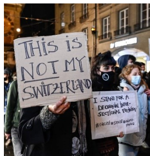
Bilder von Demonstrationen begleiten die Berichterstattung zur Annahme der Initiative «Ja zum Burkaverbot»

Nachbarländern und im islamischen Raum. Einzelne konservative Medien begrüssen das Verhüllungsverbot. Visibilität erhält die Kritik des UN-Hochkommissariats für Menschenrechte. In den sozialen Medien wird die Abstimmung sehr polarisiert kommentiert. So begrüssen bekannte rechte Politiker aus dem Ausland das Ergebnis der Abstimmung.