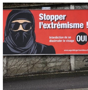
Abstimmungsplakat zur Initiative