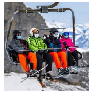
Die Covid-19-Situation in der Schweiz wird oft durch Bilder von Skigebieten illustriert

Korruption wird als historisches Signal für die gesamte Rohstoffbranche gesehen. Insgesamt fördert die Berichterstattung das Bild einer Schweiz, die sich für die Bekämpfung der Korruption einsetzt. Vereinzelt werden jedoch auch kritische Forderungen einer Schweizer NGO wiedergegeben, die Schweiz müsse dringend Gesetzeslücken schliessen, welche kriminelle Geschäftspraktiken erleichterten.