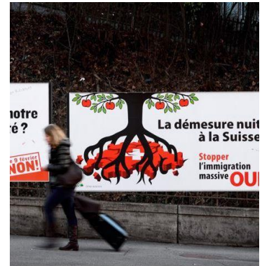
© Le Figaro – Initiative "Contre l'immigration de masse »

Durant le premier trimestre 2014, le volume de la couverture médiatique étrangère en lien avec la Suisse s'est intensifié par rapport au trimestre précédent. La tonalité se révèle quant à elle moins positive. Cela s'explique avant tout par le thème de la politique d'immigration : l'acceptation de l'initiative « Contre l'immigration de masse » a en effet donné lieu à des articles parfois très critiques, bien que moins émotionnels qu'après la votation « Contre la construction de minarets ». Les questions fiscales (procès pour évasion fiscale du président du FC Bayern Uli Hoeness) font également l'objet de comptes-rendus tendanciellement moins favorables à l'image de la Suisse. En matière de diplomatie internationale, celle-ci apparaît en revanche souvent comme prestataire de bons offices. C'est le cas à l'occasion du World Economic Forum de Davos, de la Conférence de paix sur la Syrie à Montreux, ou encore de la présidence suisse de l'OSCE dans le cadre de la crise ukrainienne. Les produits traditionnels de la Suisse constituent également un thème souvent perçu de façon positive, par exemple lors de l'ouverture du Salon horloger Baselworld.