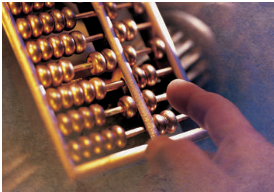
Kern der Schuldenbremse ist eine Ausgabenregel: Die zulässigen Höchstausgaben entsprechen den Einnahmen, wobei die Konjunkturlage mit einem Korrekturfaktor berücksichtigt wird.

Die Schuldenbremse soll das Haushaltsziel 2001 ablösen. Ziel ist es, ein dauerhaftes Gleichgewicht der Bundesfinanzen auf konjunkturverträgliche Art und Weise zu gewährleisten. Die Schuldenbremse lässt in Rezessionen Defizite zu, fordert bei guter Konjunktur jedoch Überschüsse. Mittelfristig soll die Verschuldung damit stabilisiert und die Schuldenquote gesenkt werden. Die Stärke der Vorlage liegt in der Berücksichtigung der Konjunktur bei gleichzeitiger Verhinderung von strukturellen Defiziten. Die Umsetzung stellt für Politik und Verwaltung eine Herausforderung dar.