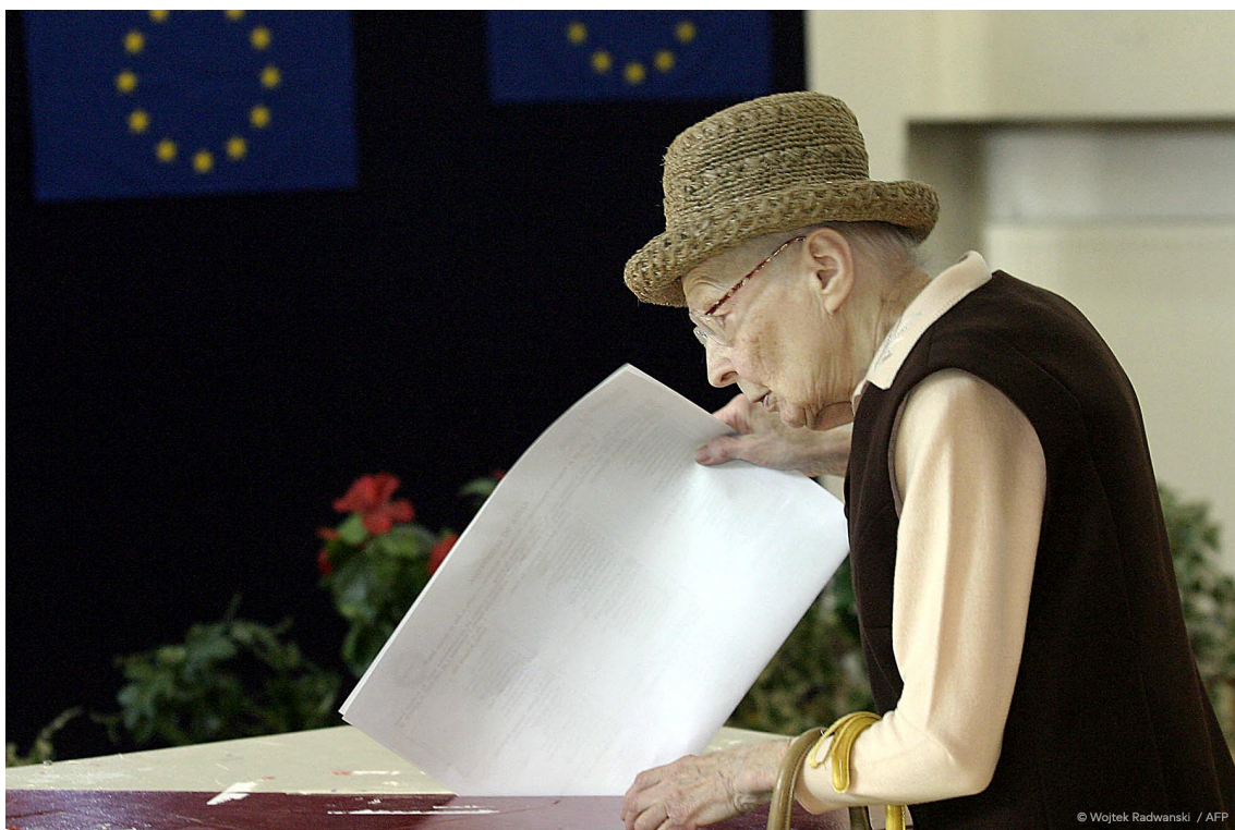
Szavazó Varsóban, Lengyelországban, a 2004-es európai parlamenti választáson.