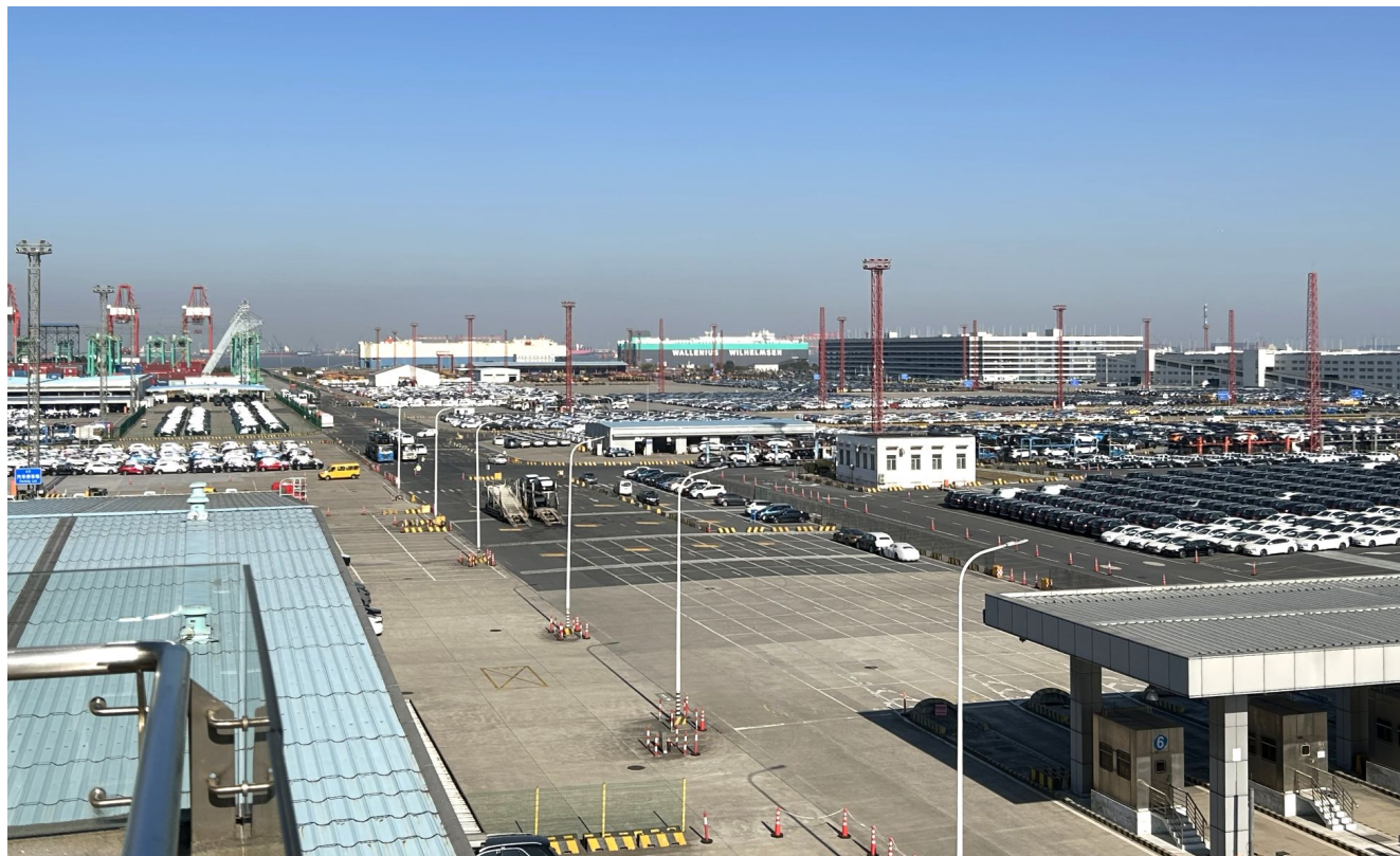
上海外高橋保稅區