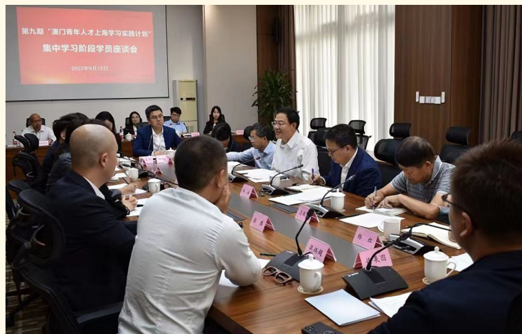
上海市政協召開第九期澳門青年人才上海學習實踐計劃學員座談會。