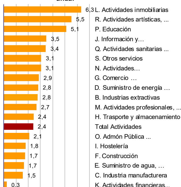
Coste laboral bruto. Tasa de variación anual