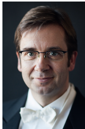
Крістіан Хільц Німеччина