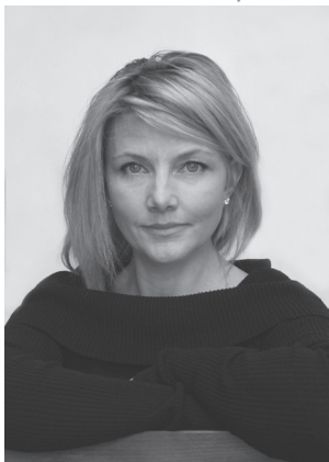
Карен Радкліфф Велика Британія