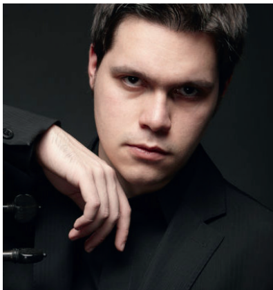
Атанас Крастев Болгарія