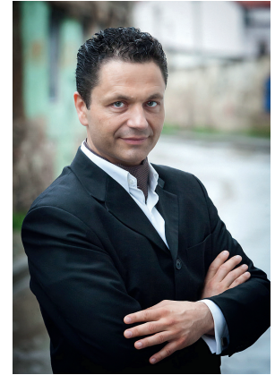
Юстас Дваріонас Литва