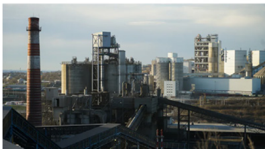
Инвестпроект стоимостью 22 млрд руб. предполагает создание производства мощностью 3,5 млн тонн цемента в год

Новороссийский цементный завод «Горный» судится с министерством природных ресурсов Кубани за право использовать водный объект Щель Сидоренкова, расположенный в горной части Новороссийска. Предприятие планирует реализовать в пределах спорной территории инвестпроект по строительству предприятия по производству цемента стоимостью 22 млрд руб. и мощностью 3,5 млн тонн продукции в год. Минприроды отказывается заключать с заводом договор водопользования на том основании, что информация о спорном объекте отсутствует в государственном водном реестре (ГВР). Ранее власти Новороссийска запретили обществу вырубать лес. После проигрыша дела в кубанском арбитражном суде НЧЗ «Горный» направил апелляционную жалобу. Шансы на отмену решения суда первой инстанции юристы оценивают по-разному.