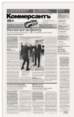
Формат D2. Выходит по вт, ср, чт, пт