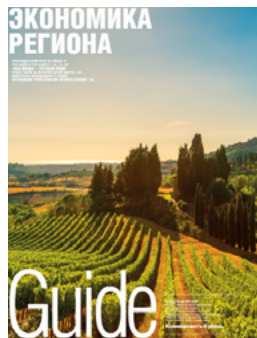
Приложения – журналы формата C4+ (250x330),

Для эффективного взаимодействия с деловой читательской аудиторией «Коммерсантъ-Кубань» использует собственную эксклюзивную систему распространения – вы можете получать «Коммерсантъ» не только по подписке, но и в сети супермаркетов «Табрис», зданиях органов власти, в аэропорту, офисных и деловых центрах, отелях, ресторанах. Актуальная информация всегда доступна на сайте «Ъ» .