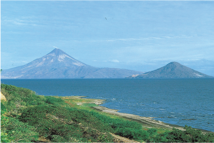
Lago de Managua con los volcanes Momotombo y Momotombito.

De tal manera, que Oviedo parece dar al Lago de Managua (al que nombra como Lago de León), una toponimia que describe más bien la función de sus islas, que al Lago en sí mismo.