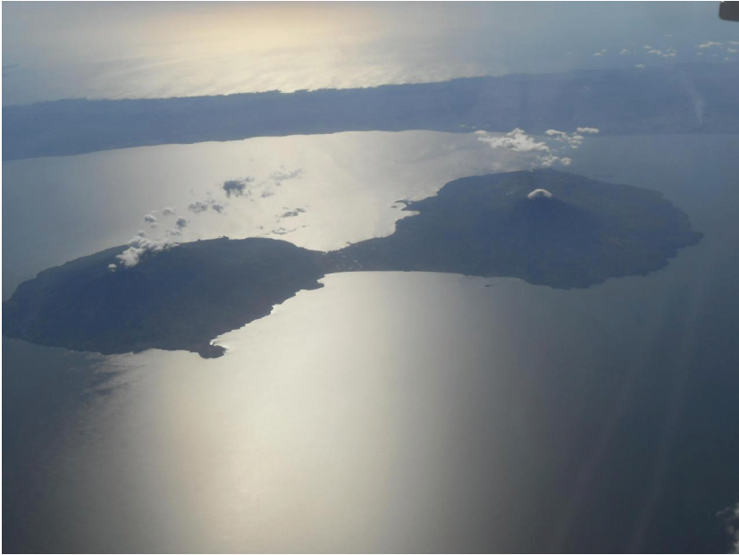
Islas de Ometepe (cerros gemelos).

No fueron la excepción nuestros indígenas, al utilizar las islas de nuestros Lagos y a éstos mismos, como lugares sagrados para las ceremonias de sacrificios propiciatorios de los teotes vinculados a la muerte, a la vida, a las aguas, a las cosechas, etc. Sus toponimias, más que reflejar a las deidades , eran un reflejo de las demarcaciones territoriales de las grandes étnias que los ocupaban: Xolotlán-Quauhcapolca-Cozabolca, o de las funciones de sus Islas : Ayagualo.