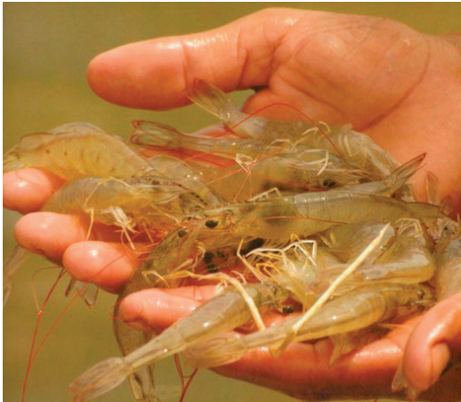
Camaroncillos de agua dulce.