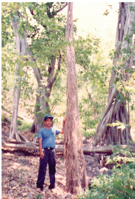
El autor en la isla Momotombito.

Juan de Torquemada, cuando narra la tradición de las emigraciones Pipiles hacia Nicaragua, asegura que éstos poblaron inicialmente “adonde esta ahora la ciudad de León, o muy cerca, adonde se llama Xolotlán, en lengua de los naturales Pipiles y en lengua de Mangués, se llama Nagarando”, (Torquemada 1975: 110).