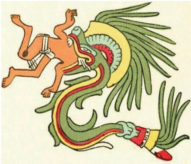
Quetzalcóatl en el Códice Telleriano-Remensis.

La etimología de Dávila Bolaños: Coatl, pol, can, admite sin embargo otra interpretación: Coatl, gemelo, cuape; Pol, aumentativo; Can-lugar. Lugar donde está el grande de los dos (dos lagos) gemelos”, (Mántica 1982: 95).