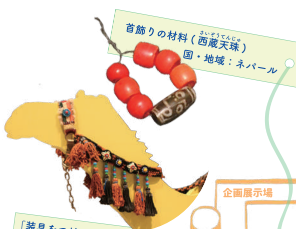
首飾りの材料 (西藏天珠) 国・地域：ネパール

このマップでは、展示場内で見ることができるビーズを紹介します。ここに掲載したもの以外にもたくさんのビーズが展示してありますので、見つけた資料を書き込んで、オリジナルビーズマップを完成させましょう。