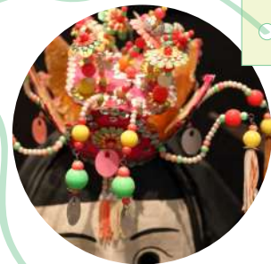
仮面(若い巫女) 国・地域：韓国