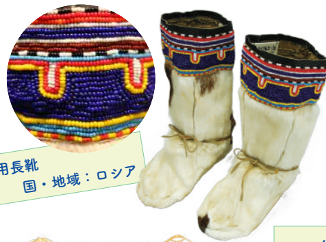
女性用長靴 国・地域：ロシア