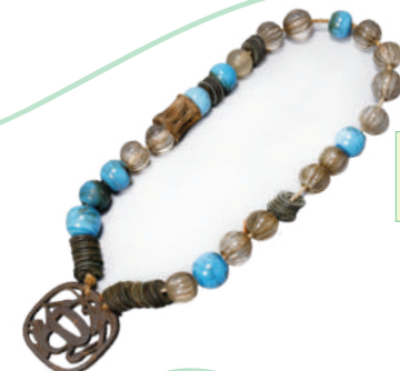
首飾り 国・地域：北海道