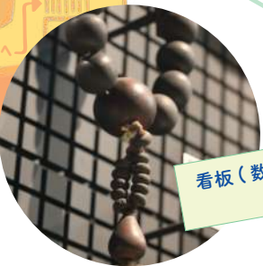
看板(数珠屋) 国・地域：日本