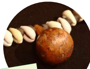
女性用ベルト 国・地域：タイ