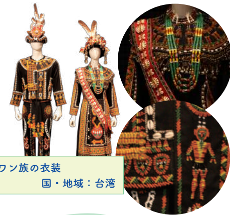
パイワン族の衣装 国・地域：台湾