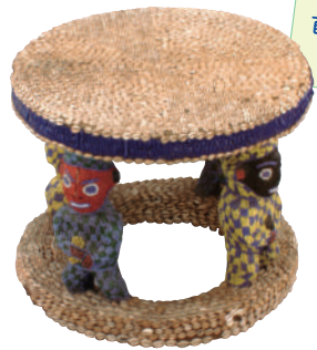
首長用の腰掛け 国・地域：カメルーン