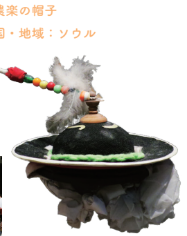
農楽の帽子 国・地域：ソウル