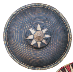
笠 国・地域：フィリピン（ヴィサヤ諸島）