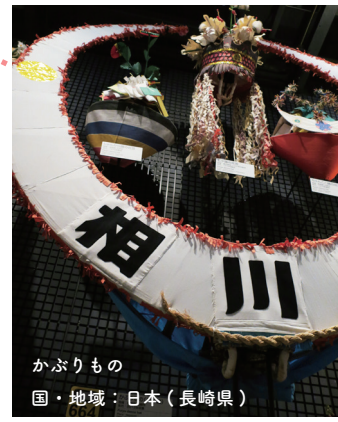
かぶりもの 国・地域：日本（長崎県）