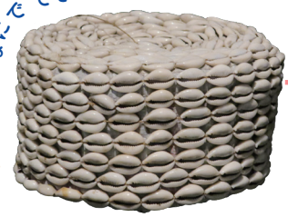
呪医の帽子 国・地域：モザンビーク