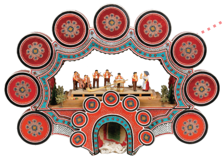
「美のクローゼ（女性）」の頭飾り 国・地域：スイス