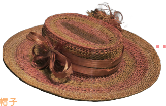
帽子 国・地域：サモア諸島