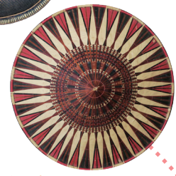
笠 国・地域：ブルネイ