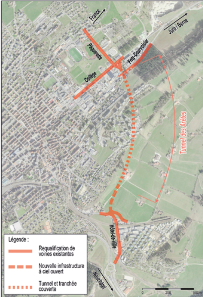
Fig. 2 Plan du contournement avec le tunnel des Arêtes

Le projet de contournement est de La Chaux-de-Fonds prévoit un nouveau tracé de la route principale suisse H18. D'une longueur d'environ 1'200 mètres, le tunnel des Arêtes constituera la pièce maîtresse de ce contournement.