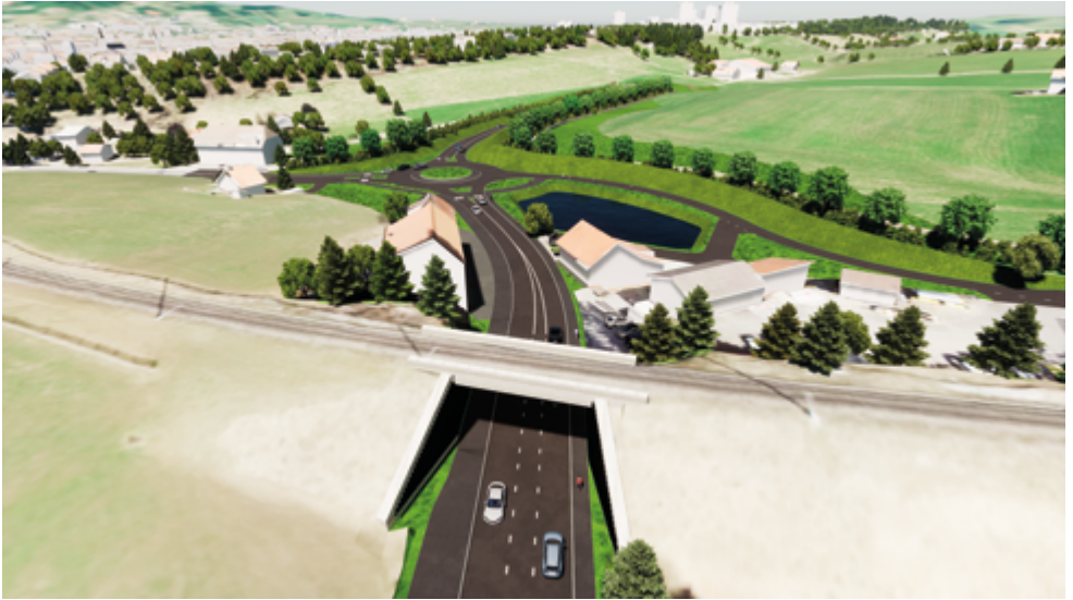
Fig. 4 Partie sud de la rue de l'Hôtel-de-Ville et pont des Petites Crosettes.