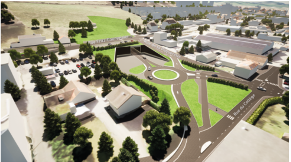
Fig. 5 Portail nord et jonction avec les rues du Collège, de la Pâquerette et Fritz-Courvoisier.