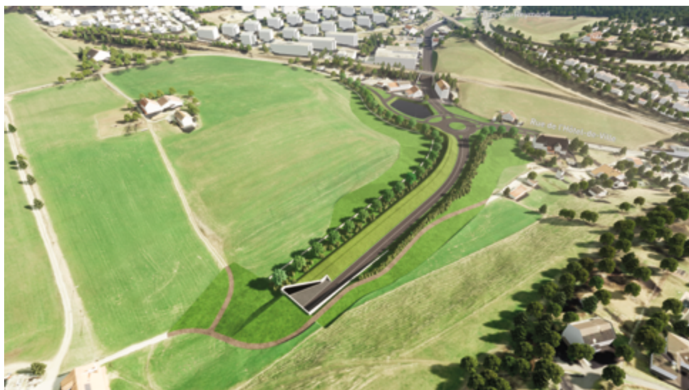
Fig. 3 Portail sud aux Petites Crosettes et jonction sur la rue de l'Hôtel-de-Ville

Le fait de pouvoir retirer du centre-ville une part importante du trafic et valoriser l'aménagement des espaces publics permettra la réappropriation des rues et des places par les habitantes et habitants à travers la réalisation d'aménagements urbains conviviaux. La densification du milieu bâti à proximité des gares et lignes de bus contribuera à freiner l'étalement urbain, préservant la terre et le paysage en périphérie de la ville. L'attractivité résidentielle du centre-ville sera renforcée par le retour d'une qualité de vie soulagée du trafic routier de transit.