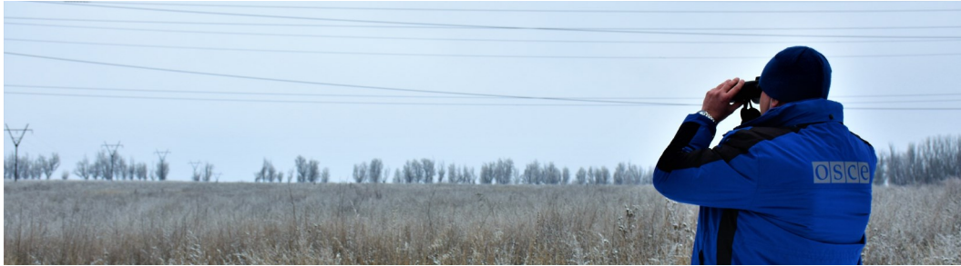
Патрулювання біля н. п. Богданівка, Донецька область (СММ ОБСЄ)