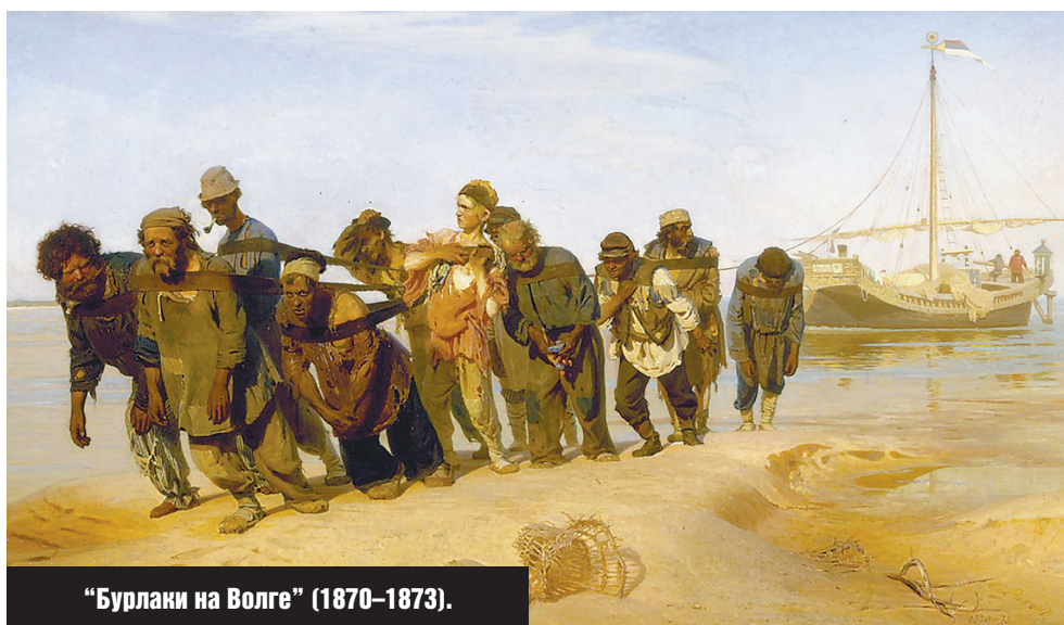
"Бурлаки на Волге" (1870–1873).

О своих произведениях художник почти всегда отзывался беспощадно: "Боже мой, какая мерзость, – писал он об одном из ранних своих этюдов. – Особенно этот язык молнии и эта женщина в центре – вот гадость-то!". А о картине