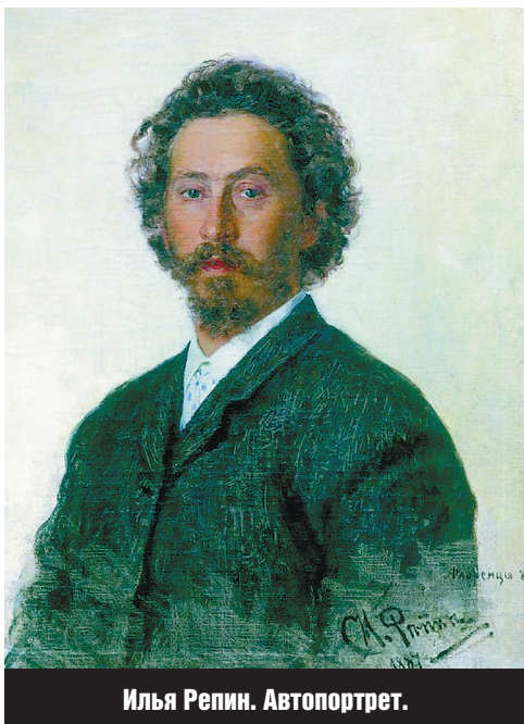
Илья Репин. Автопортрет.