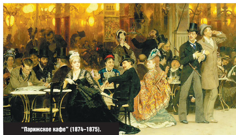
"Парижское кафе" (1874–1875).