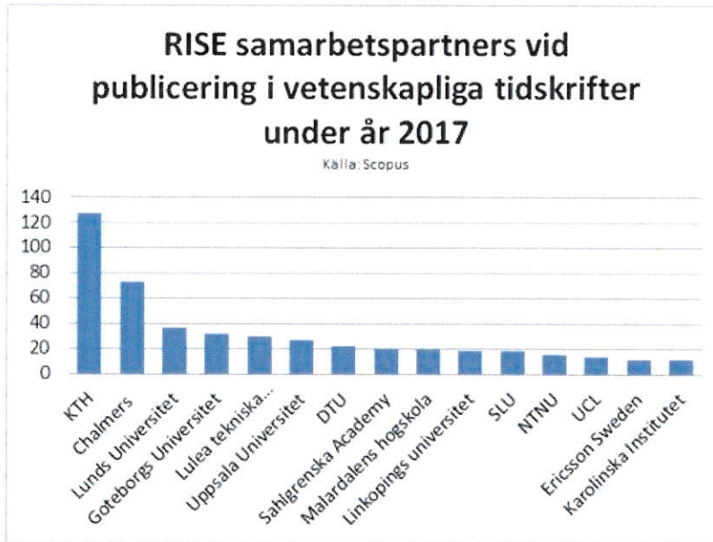
Fig 1. Sampublicering av RISE forskare med organisationer

resultat överför RISE-instituten sina publicerade artiklar till DiVA (Digitala Vetenskapliga Arkivet). DiVA är en publicerings- och arkiveringsplattform för forskningspublikationer och studentuppsatser som används av 40 offentligt finansierade lärosäten och myndigheter i Sverige och övriga Norden.