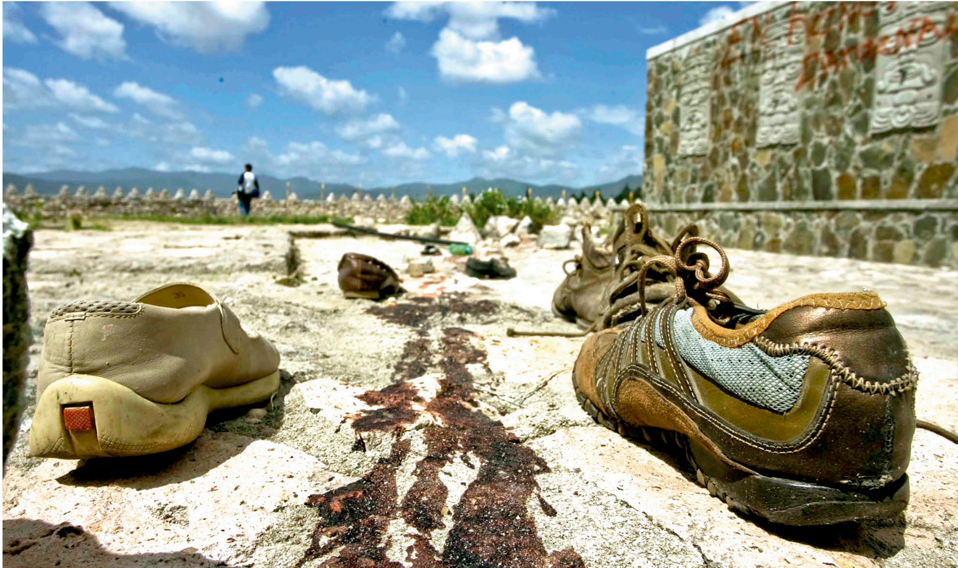
Los restos de sangre del mártir de la lucha popular Isy Obed Murillo días después de un ataque de los cuerpos de seguridad del Estado en las afueras del aeropuerto Toncontín, en donde miles de ciudadanos esperaban el regreso del presidente Manuel Zelaya.