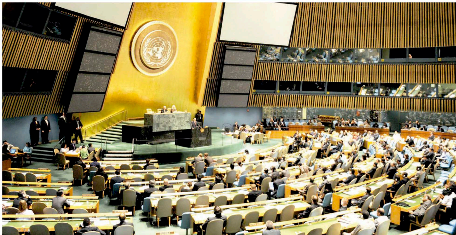
Ante la Asamblea General de la Organización de las Naciones Unidas en Nueva York, el presidente constitucional de Honduras, Manuel Zelaya Rosales denunció el secuestro de las instituciones democráticas y el Golpe de Estado.