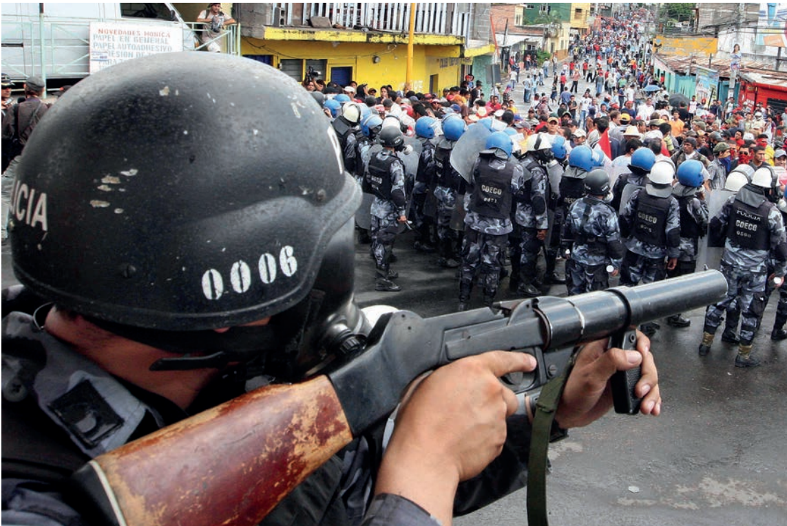
Un elemento de las fuerzas de seguridad del Estado amenaza con disparar para contener una manifestación en contra del Golpe de Estado en Honduras.