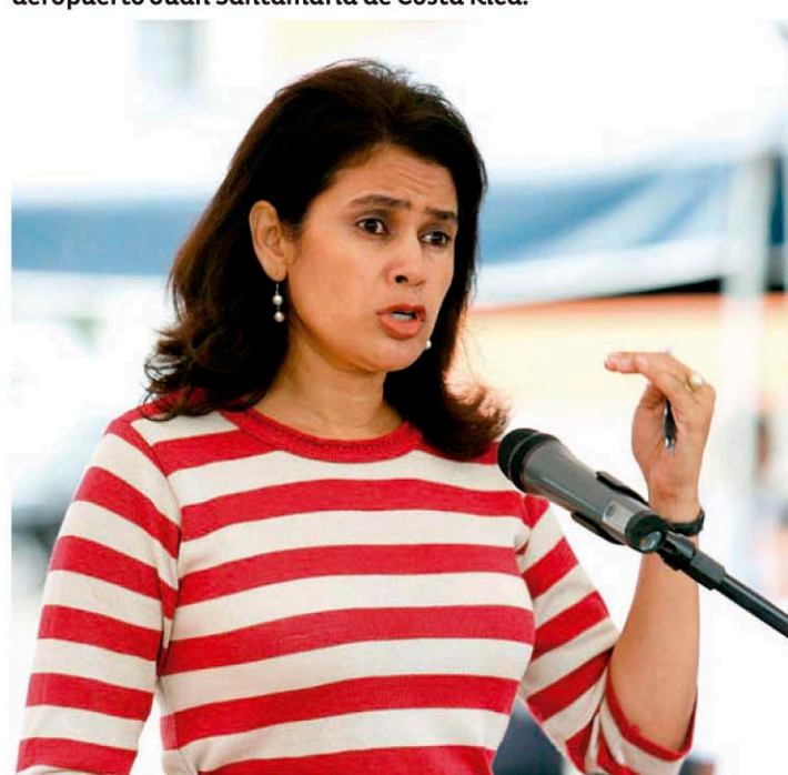
Rixi Moncada vocera del depuesto presidente de Honduras, Manuel Zelaya durante el Diálogo de San José.