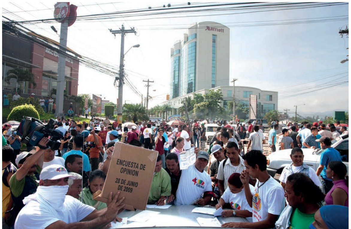
Miles de ciudadanos salen a las calles a defender la consulta popular y protestar contra el Golpe de Estado en Honduras, en las inmediaciones de Casa Presidencia en Tegucigalpa.