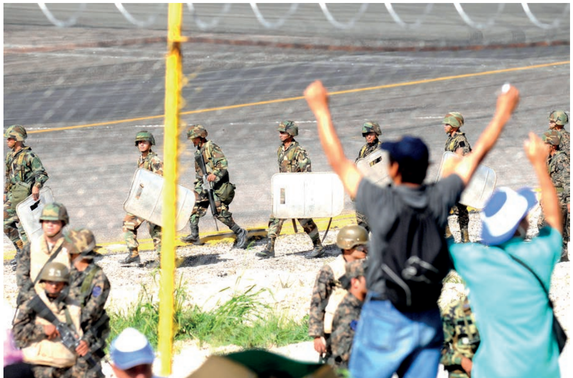
Militares impiden el ingreso de personas al aeropuerto Toncontín mientras afuera miles de hondureños esperan la llegada del presidente Manuel Zelaya Rosales.