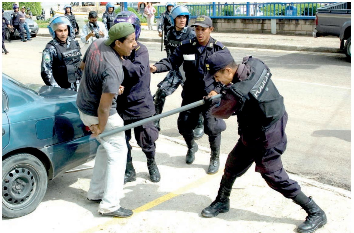
Elementos de seguridad del Estado reprimen brutalmente a un ciudadano durante las protestas en contra de la expulsión del presidente constitucional de Honduras, Manuel Zelaya Rosales.