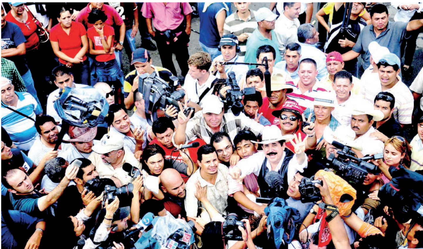
Centenares de hondureños apoyan el retorno del presidente Manuel Zelaya Rosales, en un intento de ingreso a Honduras en la frontera nicaragüense.