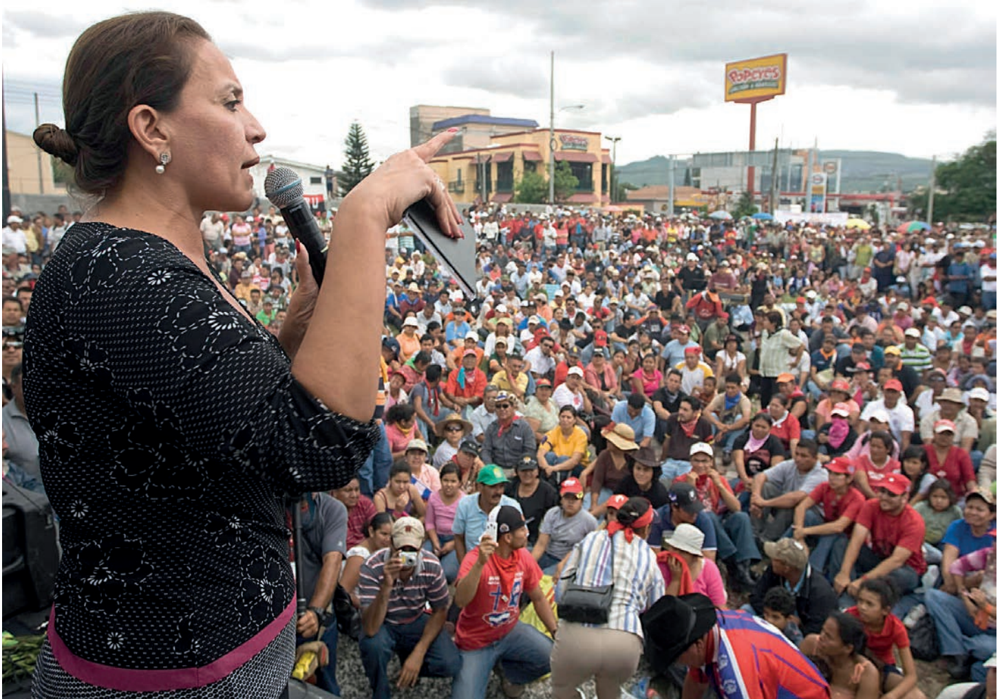
La Primera Dama ahora presidenta de Honduras, Xiomara Castro Sarmiento habla ante el pueblo hondureño al encabezar una jornada nacional de protestas a inmediaciones de Casa Presidencial .