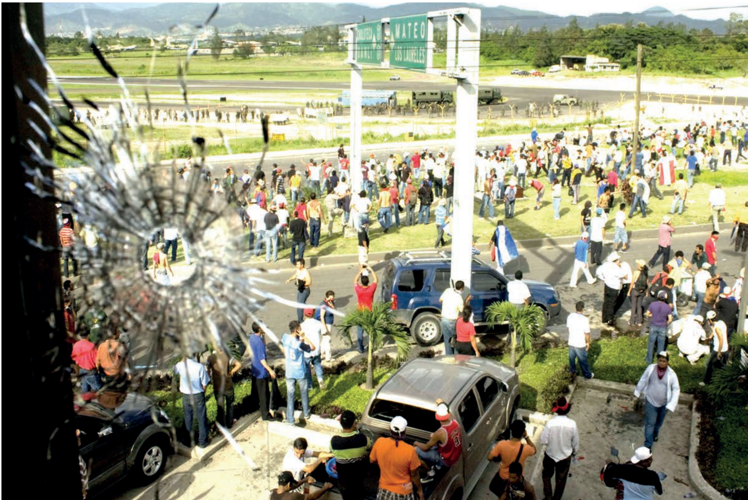
Un disparo de miembros de la milicia en contra de ciudadanos que se manifestaban en las afueras del aeropuerto Toncontín durante una jornada de apoyo al regreso del presidente Manuel Zelaya.