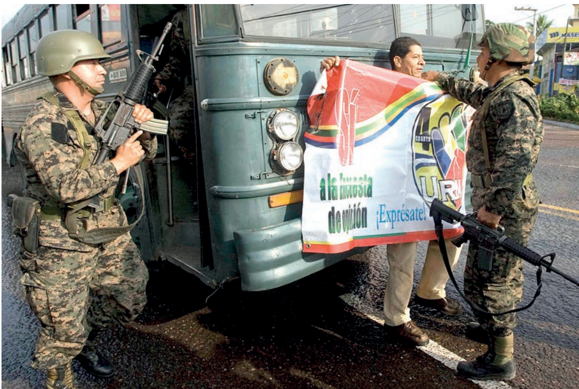
Soldados del ejército de Honduras intimidan a un ciudadano en las inmediaciones de Casa Presidencial durante el primer día del Golpe de Estado en Honduras.