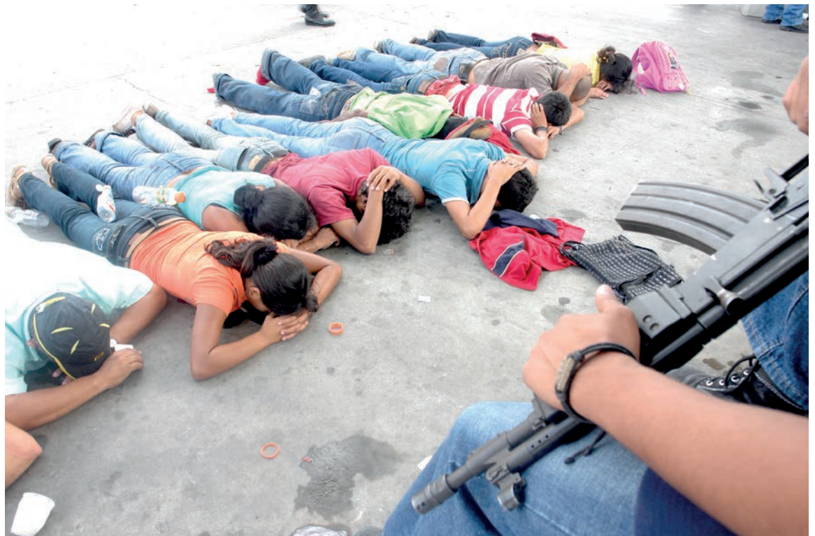
Ciudadanos son detenidos durante una protesta en contra del rompimiento del orden constitucional en Honduras.