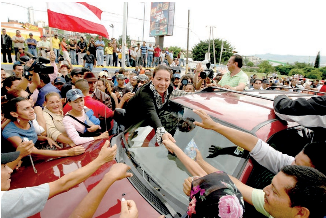
La Primera Dama y ahora presidenta de Honduras Xiomara Castro, durante una protesta en contra del Golpe de Estado en el país centroamericano.