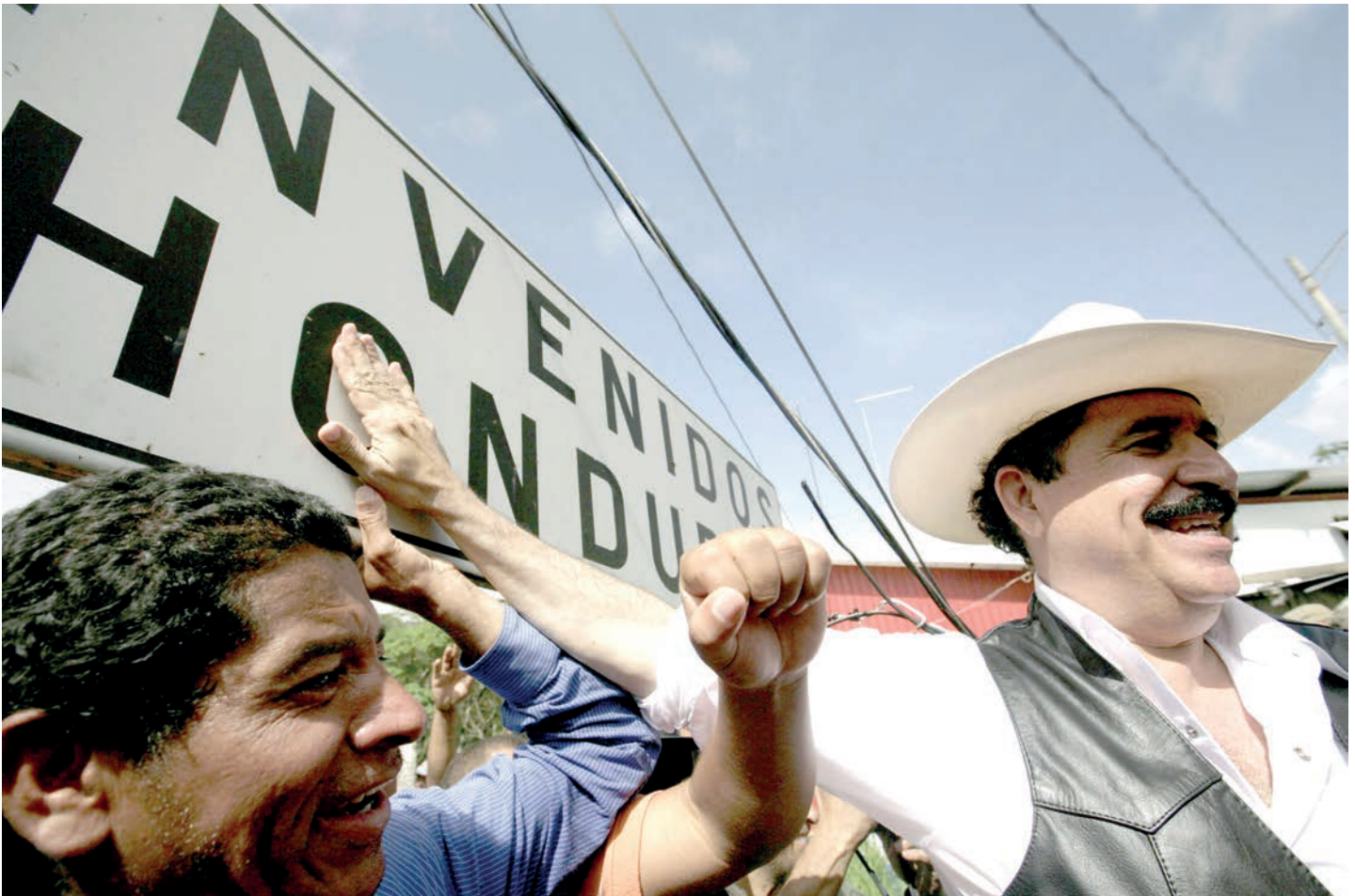
El Presidente Manuel Zelaya Rosales, toca territorio hondureño en la frontera de Las Manos.

Miles de hondureños se organizaron y caminaron entre la selva para su encuentro con el mandatario Manuel Zelaya, quien esperaba en suelo nicaragüense, demostrando la unión y fortaleza social que enfrenta el Golpe de Estado en Honduras.