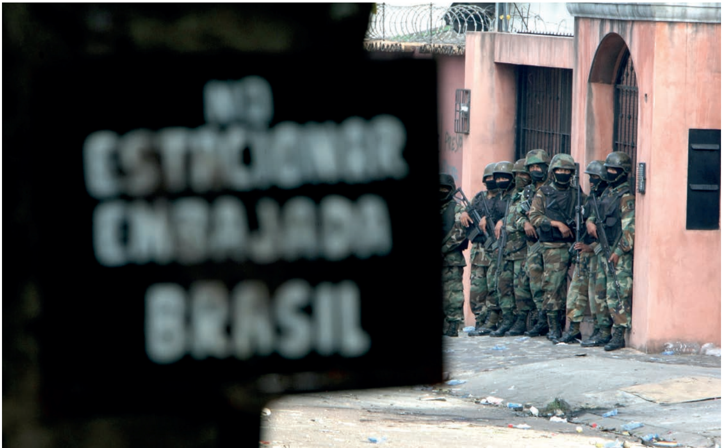
Militares rodean la Embajada de Brasil en Tegucigalpa. EL presidente de Honduras Manuel Zelaya se refugio en la sede diplomática tras ingresar al país e intentar reinstalar la democracia luego del Golpe de Estado.