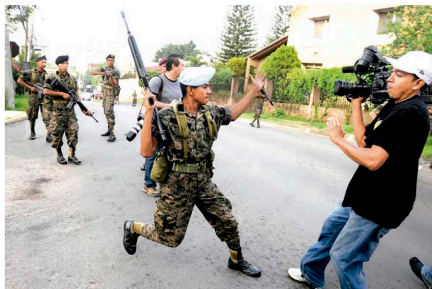
Soldados atacan a periodistas locales e internacionales a las afueras de la residencia del presidente Zelaya durante el momento de su secuestro.

Tras el quebrantamiento de las instituciones por la expulsión del presidente constitucional Manuel Zelaya Rosales, las Fuerzas Armadas de entonces y los grupos fácticos tomaron el control de Casa Presidencial ante la férrea defensa de la ciudadanía que exige la no violación a la Carta Magna. La unión popular enfrentó con razón la fuerza, manteniendo el espíritu consagrado en el mandato ciudadano.