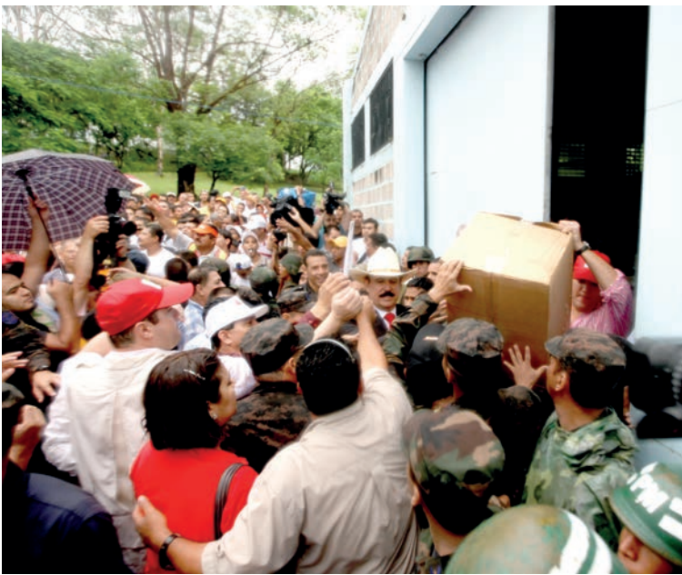
Miles de ciudadanos apoyan al presidente hondureño, Manuel Zelaya Rosales al momento de la recuperación del material que se utilizarían para llevar a Cabo la Consulta Popular.