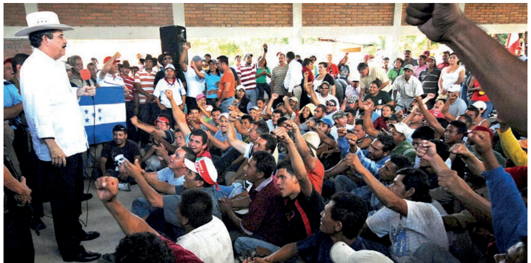
El Presidente de Honduras Manuel Zelaya Rosales habla a más de mil hondureños que llegaron a pie entre las montañas, al Ocotol, Nicaragua a 25 kilómetros de la frontera con Honduras, en donde continúa llamando a una insurrección pacífica para retornar a su país.

Miles de hondureños se organizaron y caminaron entre la selva para su encuentro con el mandatario Manuel Zelaya, quien esperaba en suelo nicaragüense, demostrando la unión y fortaleza social que enfrenta el Golpe de Estado en Honduras.