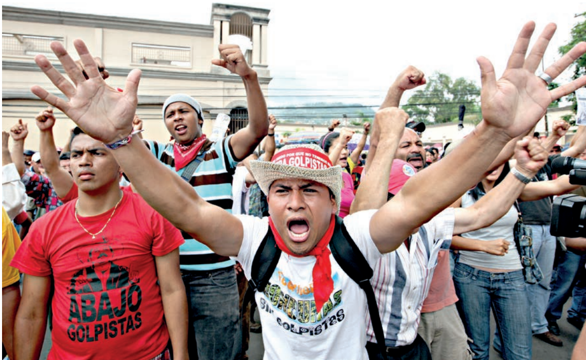
Compatriotas de la resistencia gritan consignas contra el Golpe de Estado en Tegucigalpa, capital de Honduras.