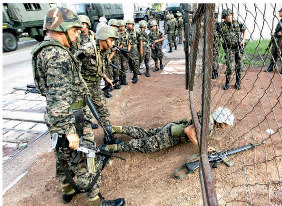
Soldados del Ejército hondureño toman por asalto la Casa Presidencial de Honduras luego del rompimiento del orden constitucional por el Golpe de Estado contra el presidente Manuel Zelaya.