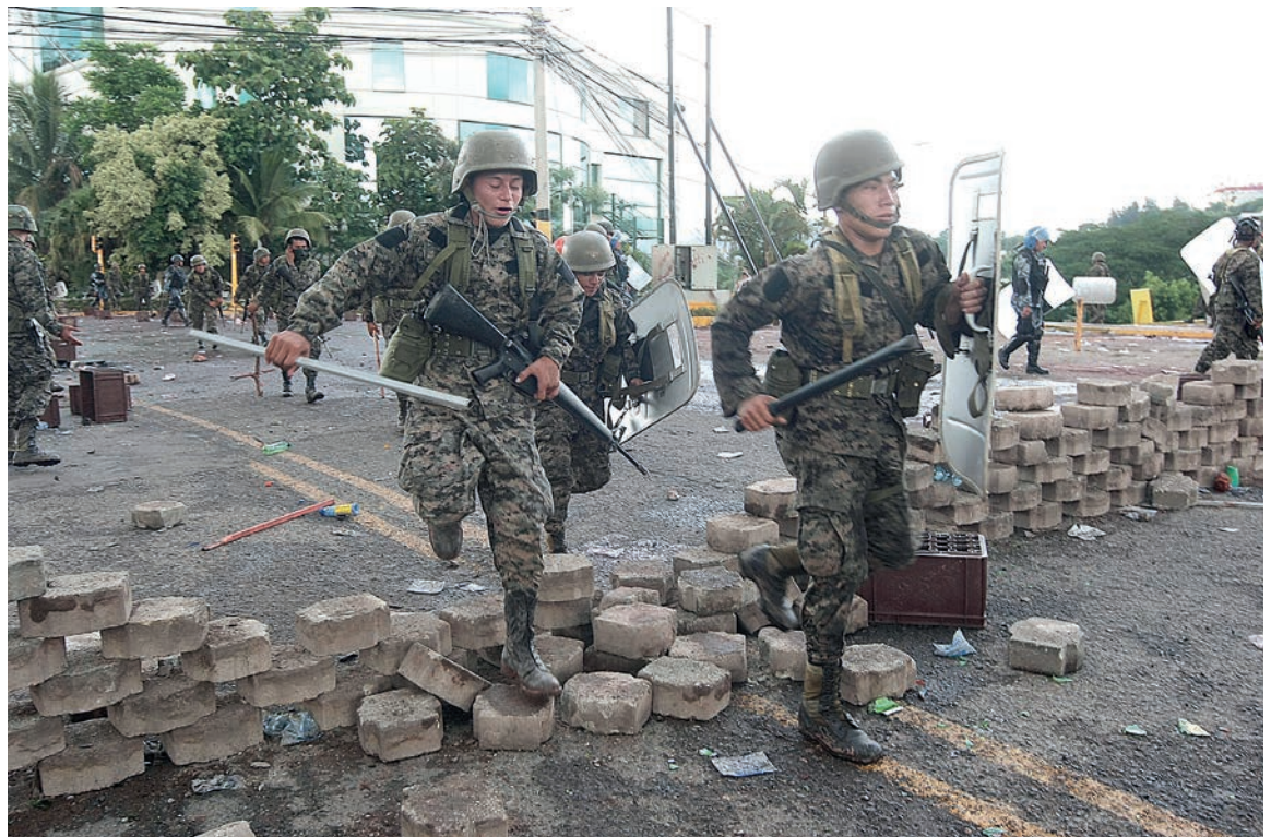
Elementos de la milicia, con fusiles, escudos y toletes en mano, corren para disolver una de las tantas movilizaciones.