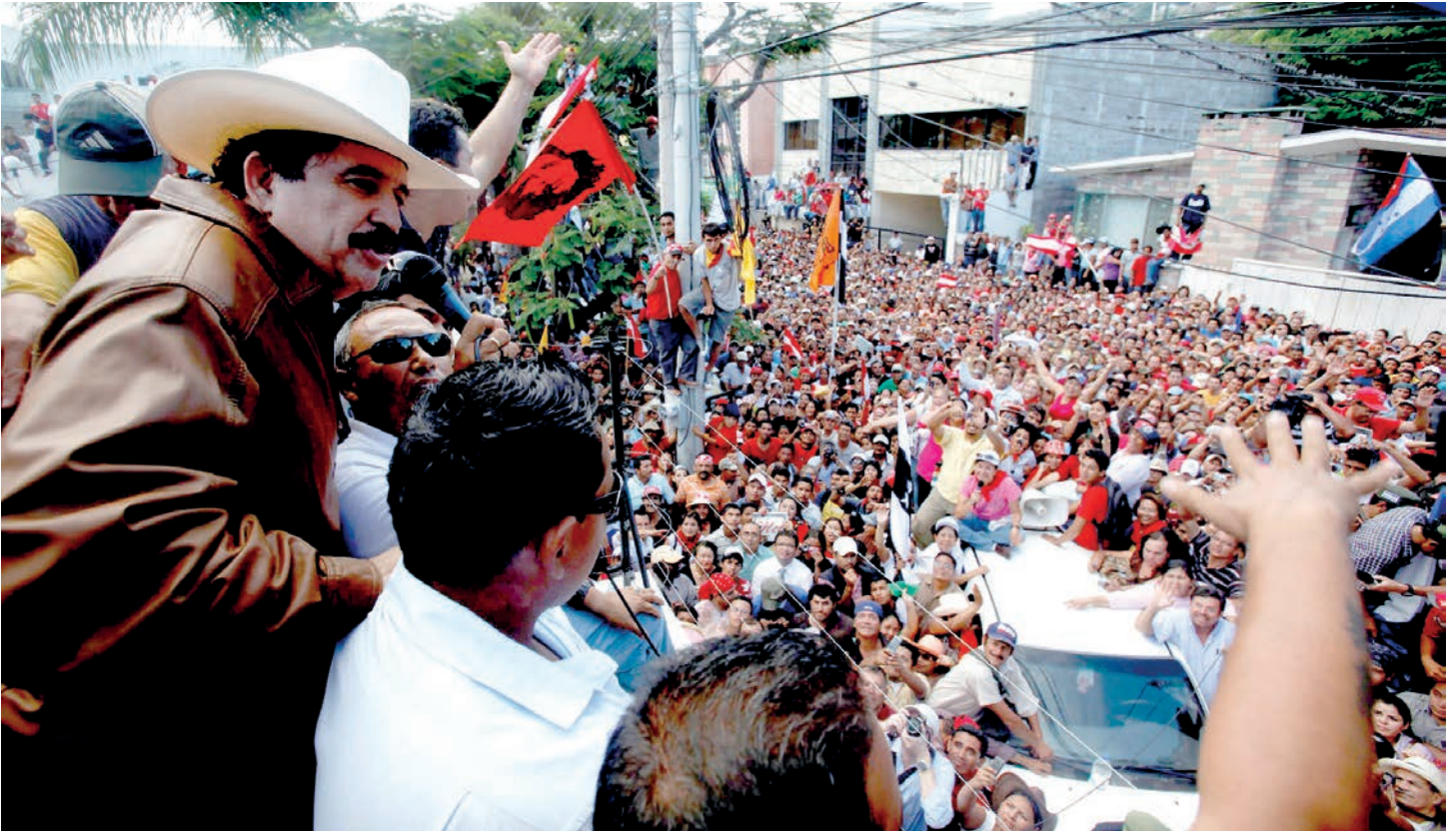
Manuel Zelaya Rosales en las afueras de la Embajada de Brasil manifestó: "patria, restitución o muerte".