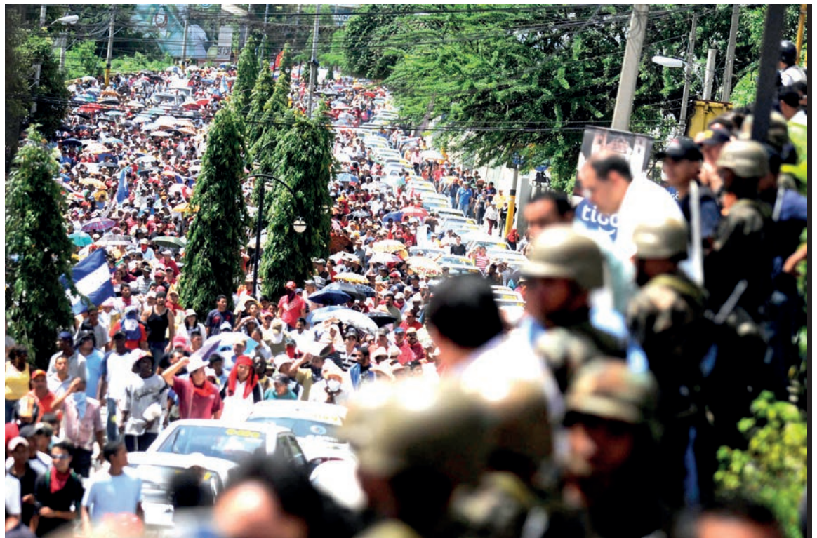
Miles de ciudadanos salen a las calles en la mayor concentración de la historia para exigir el restablecimiento del orden constitucional tras el Golpe de Estado en Honduras.