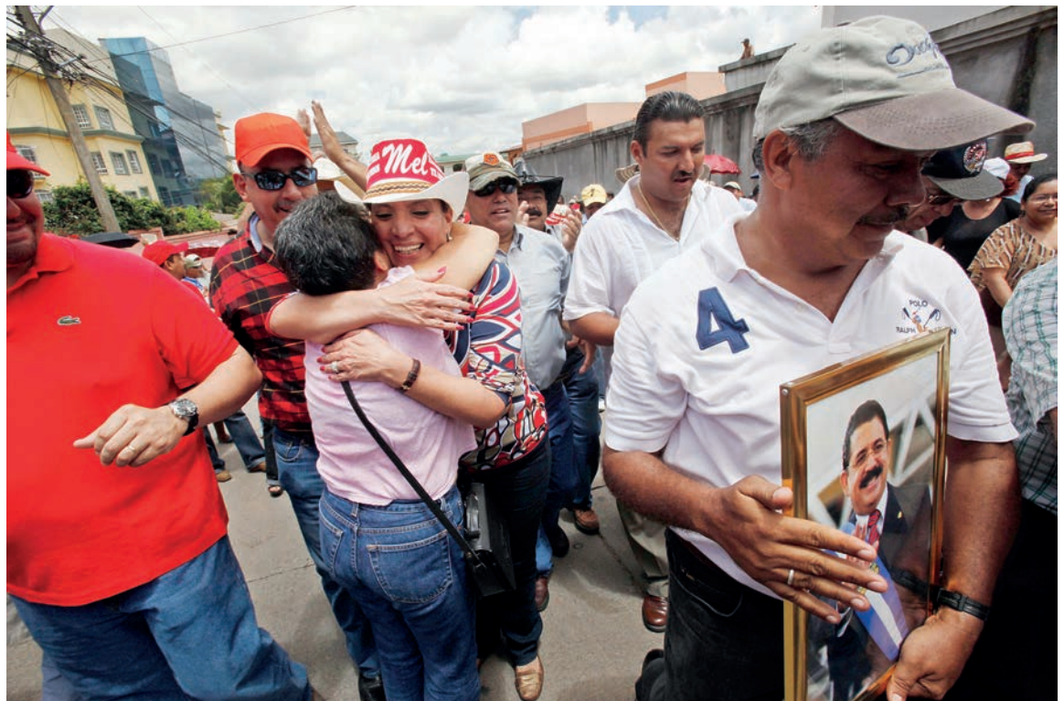
Una ciudadana abraza efusivamente a Xiomara Castro durante una protesta en contra del Golpe de Estado en Honduras.