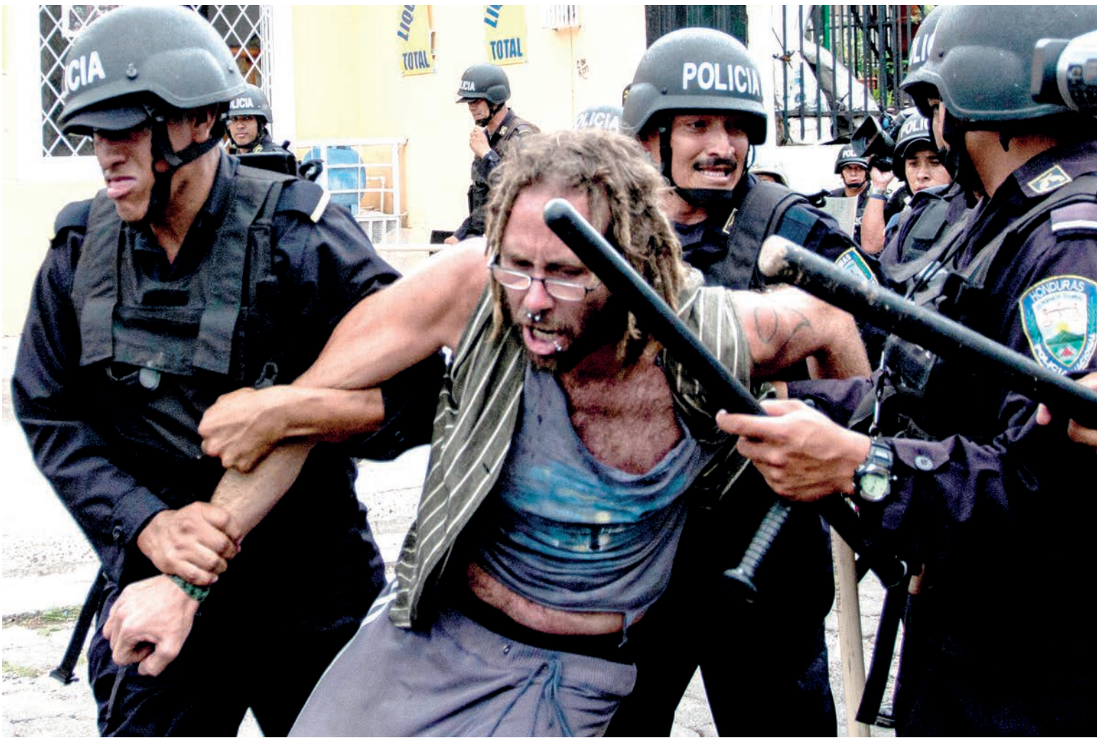
Elementos de la Policía Nacional contienen a un activista y comunicador social durante protesta en contra del Golpe de Estado en Honduras.