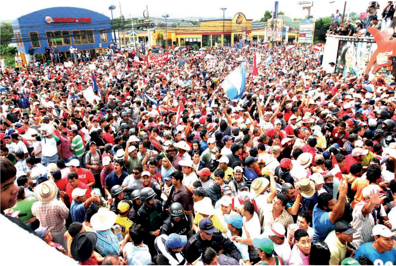
Miles de personas rodean las instalaciones del aeropuerto Toncontín en apoyo al presidente hondureño Manuel Zelaya en un intento por reestablecer el orden democrático luego del Golpe de Estado en Honduras.