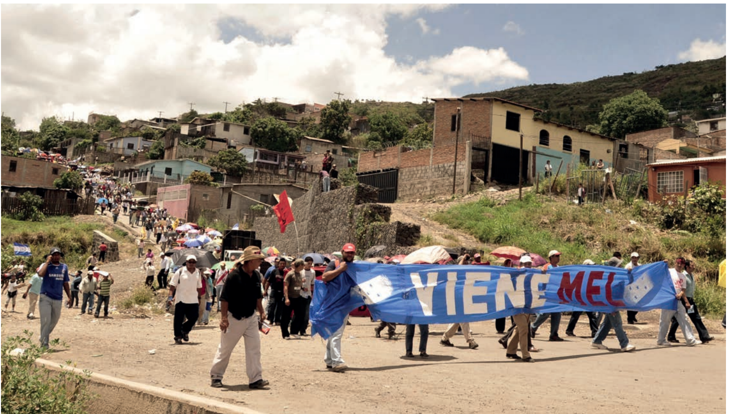
Las calles de las colonias más populares del país se inundaron del honor y valor del pueblo en defensa del presidente Zelaya.