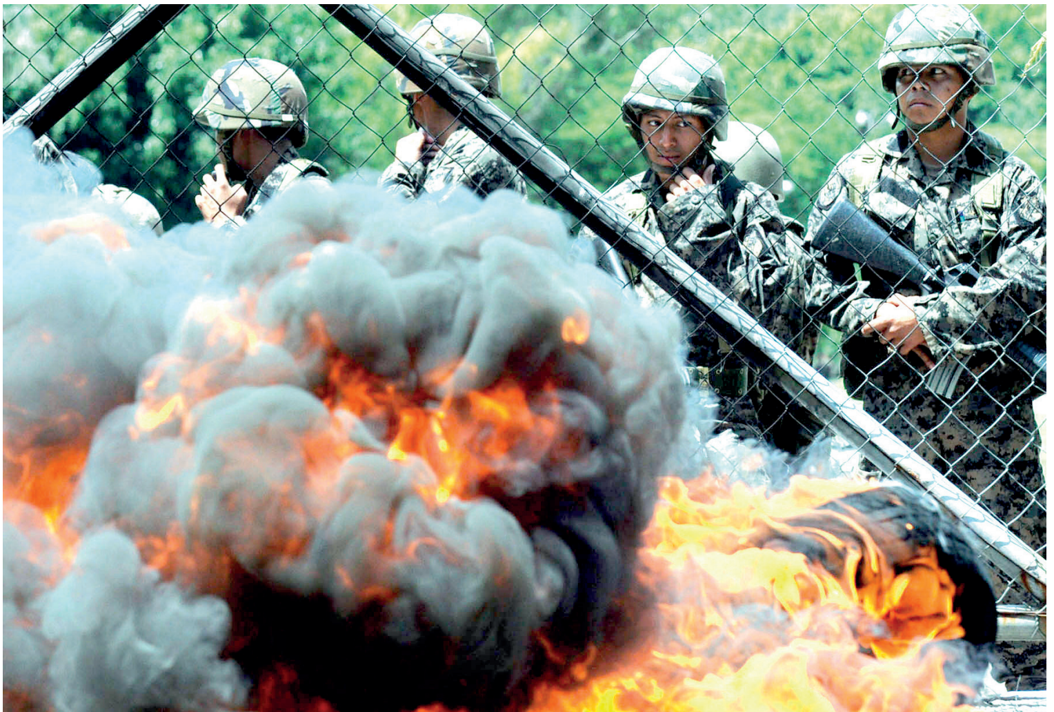
Militares observan desde dentro de las instalaciones de Casa Presidencial la gesta que emprendió el pueblo contra el Golpe de Estado que rompió el orden constitucional en Honduras.