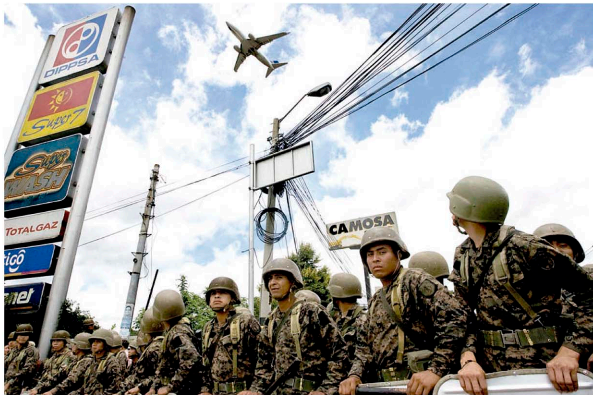
Militares observan el avión donde viaja el presidente Manuel Zelaya acompañado de líderes latinoamericanos para garantizar la restitución del Estado Democrático en Honduras.

Miles de hondureños se concentraron en las afueras del aeropuerto Toncontín para recibir al presidente Manuel Zelaya