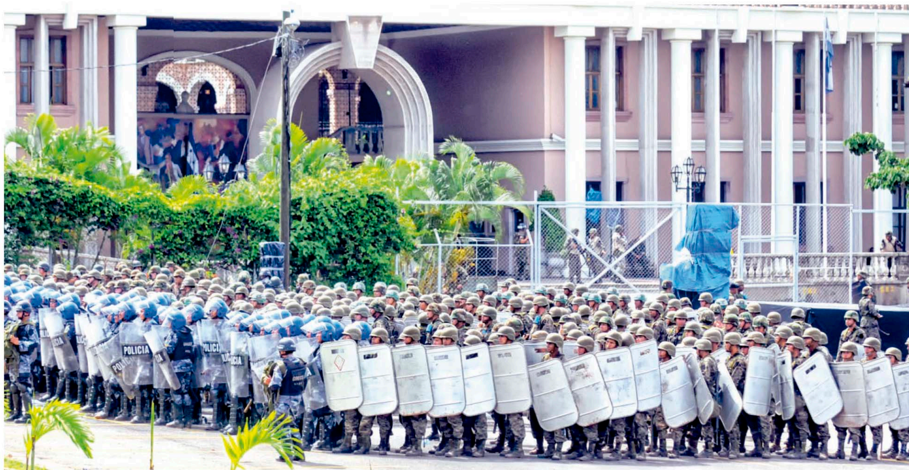
Miembros del Ejército de Honduras se alistan para reprimir a ciudadanos, tras asaltar la Casa Presidencial una vez que el presidente constitucional Manuel Zelaya fuera secuestrado y expulsado del país.