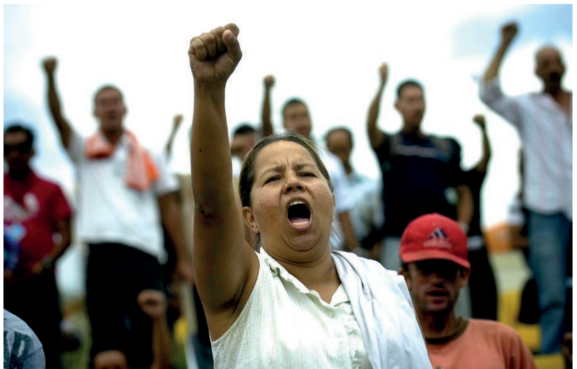
Una mujer y miles de ciudadanos cantan el Himno Nacional de Honduras durante una protesta contra los grupos de facto que rompieron la democracia en el país.