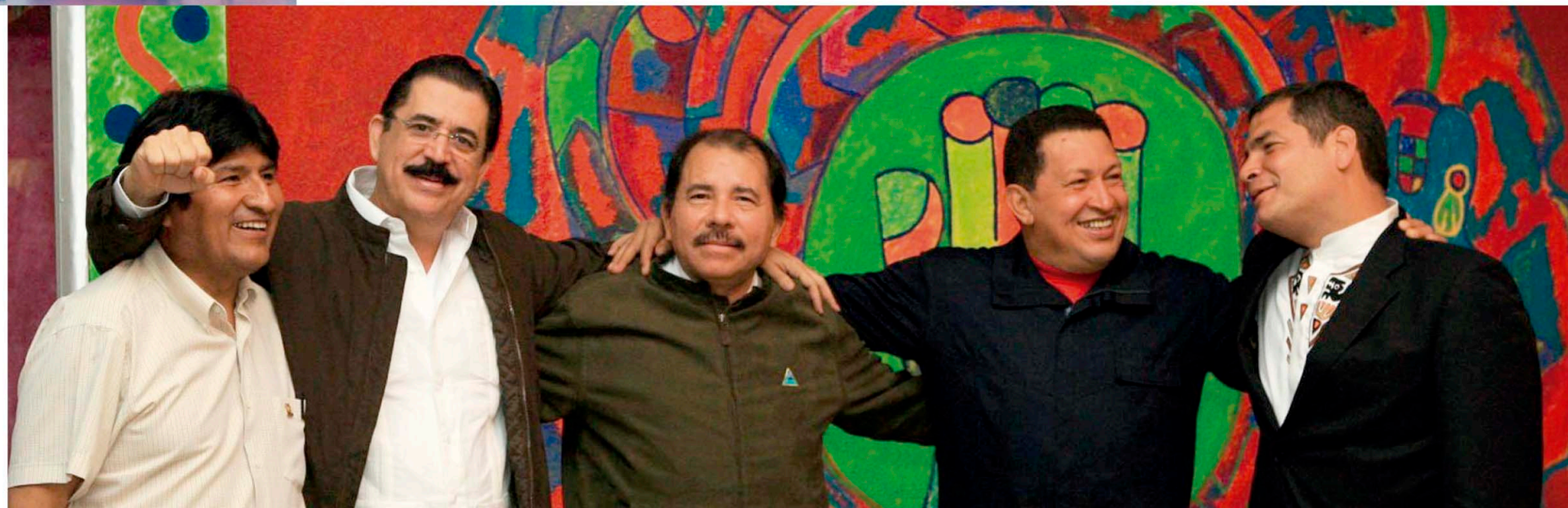
Las fuerzas democráticas más representativas de América Latina se juntaron para condenar el Golpe de Estado contra el pueblo de Honduras. Los presidentes de Bolivia, Evo Morales, Honduras, Manuel Zelaya, Nicaragua, Daniel Ortega, Hugo Chávez de Venezuela y Rafael Correa del Ecuador denunciaron en conjunto el rompimiento institucional hondureño.