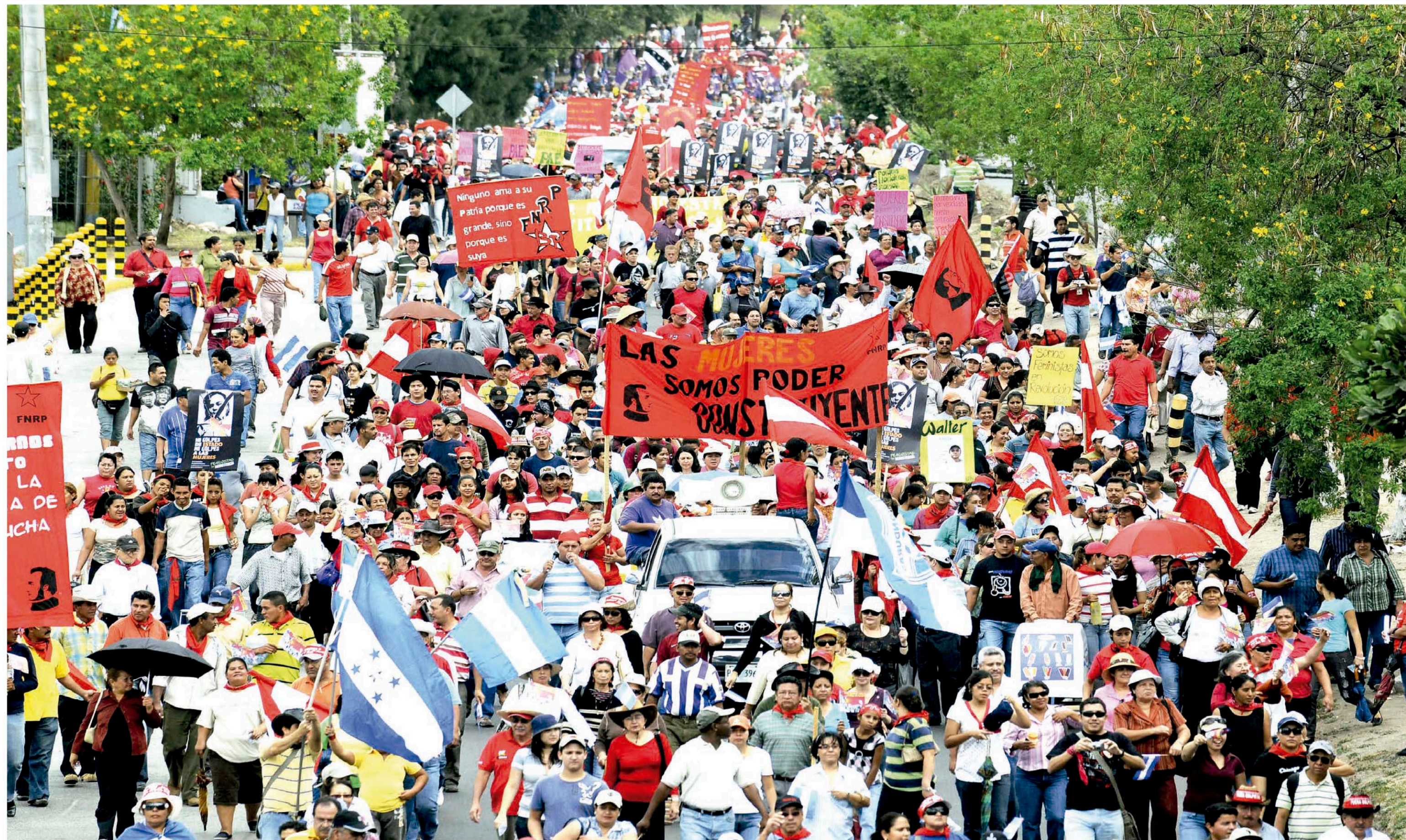
Protesta del 5 de julio rumbo al aeropuerto Toncontín, según analistas la más grande de la historia de Honduras; con la asistencia de más de 500 mil personas que marcharon contra el Golpe de Estado.