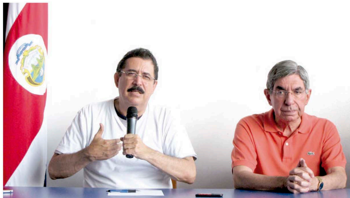
Manuel Zelaya y Óscar Arias en conferencia de prensa en el aeropuerto Juan Santamaría de Costa Rica.