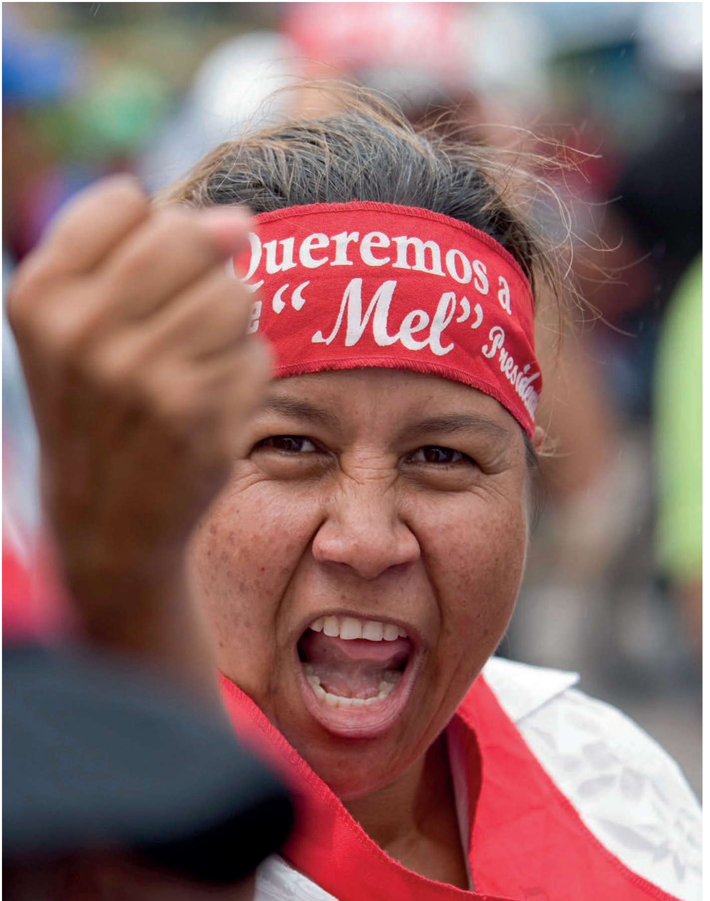
Un mujer grita consignas en apoyo al presidente Manuel "Mel" Zelaya durante una protesta para condenar el Golpe de Estado en Honduras.