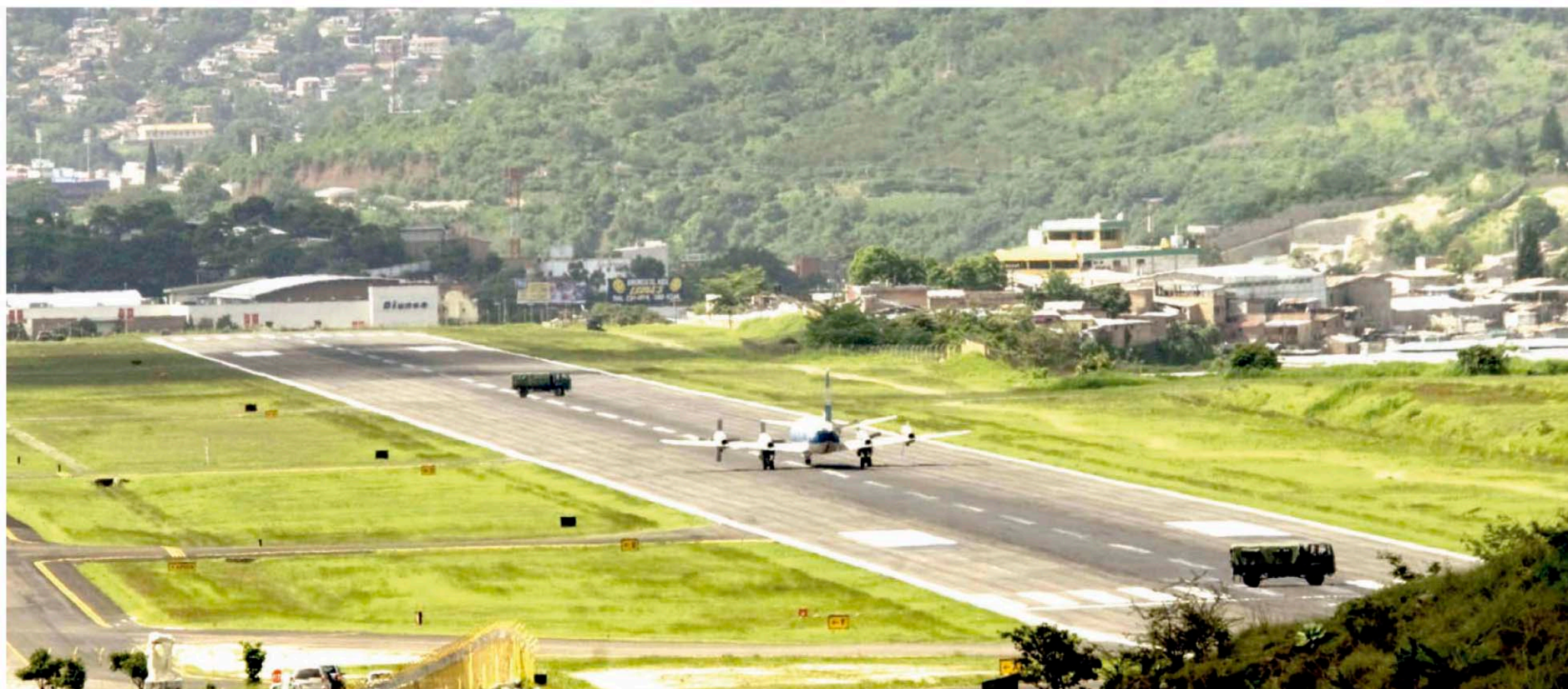
Con aviones y vehículos militares estacionados sobre la pista del aeropuerto Toncontín se impidió el aterrizaje de la aeronave en la que era transportado a Honduras el presidente Manuel Zelaya Rosales.