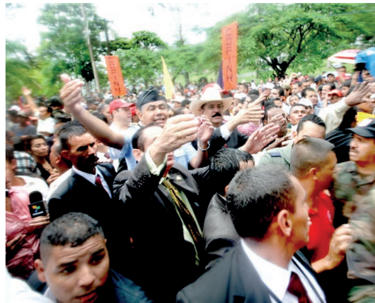
El presidente hondureño, Manuel Zelaya Rosales acompañado de miles de personas recuperan en la Fuerza Aérea la papelería que sería utilizada en la Consulta Popular.