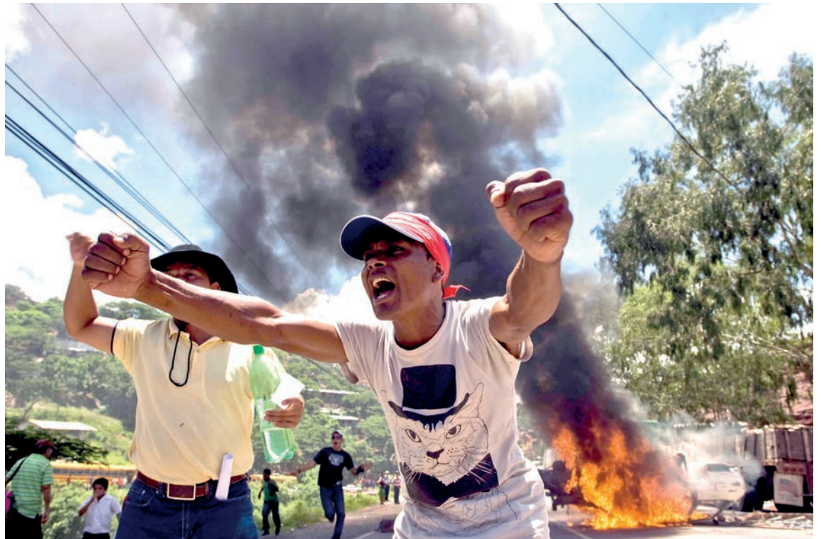
Miles de hondureños salieron a las calles de todo el territorio nacional para condenar el rompimiento del orden constitucional.