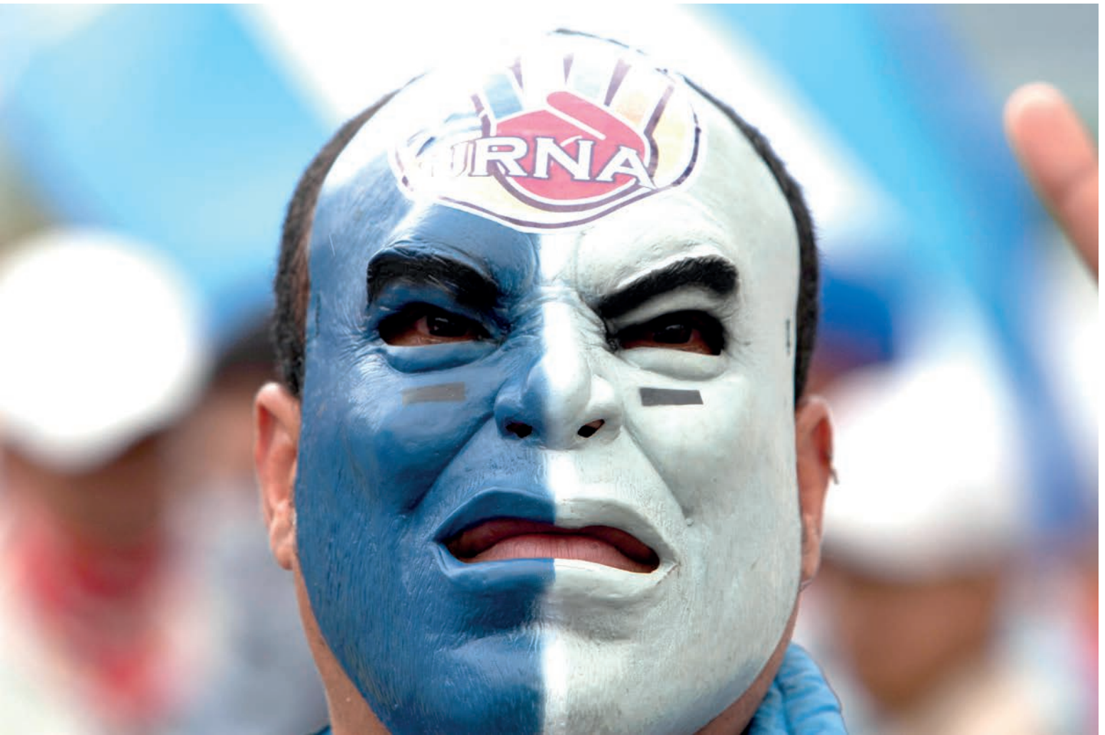
Con los colores patrios y la imagen de la Cuarta Urna en el rostro, un hondureño defiende en las calles la institucionalidad de su país.