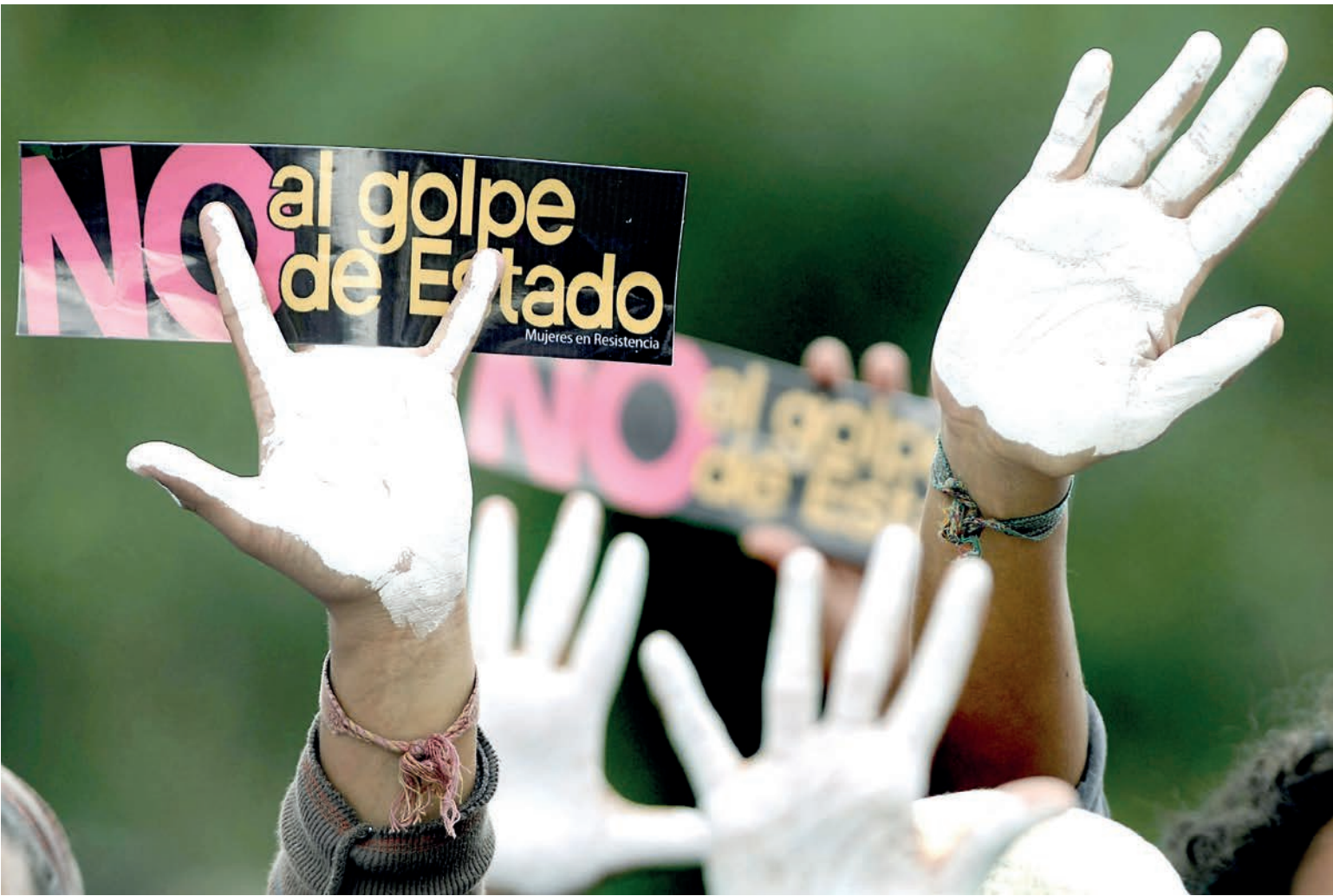
Con las manos pintadas de blanco en símbolo de Paz y en rechazo al Golpe de Estado cientos de ciudadanos salen a las calles a protestar.