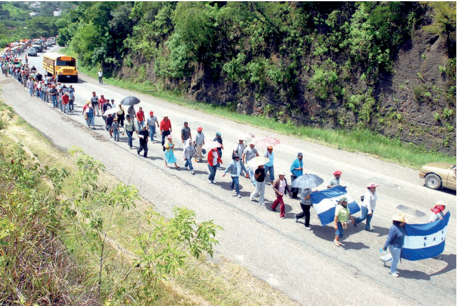
En nuestras carreteras se llevaron a cabo muchas movilizaciones condenando la salida ilegal del presidente Zelaya.