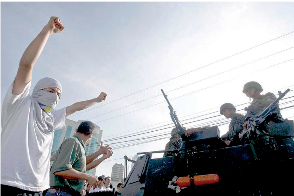
Un hondureño levanta los puños en protesta contra el Golpe de Estado frente a un vehículo militar en las inmediaciones de Casa Presidencial en la capital hondureña.