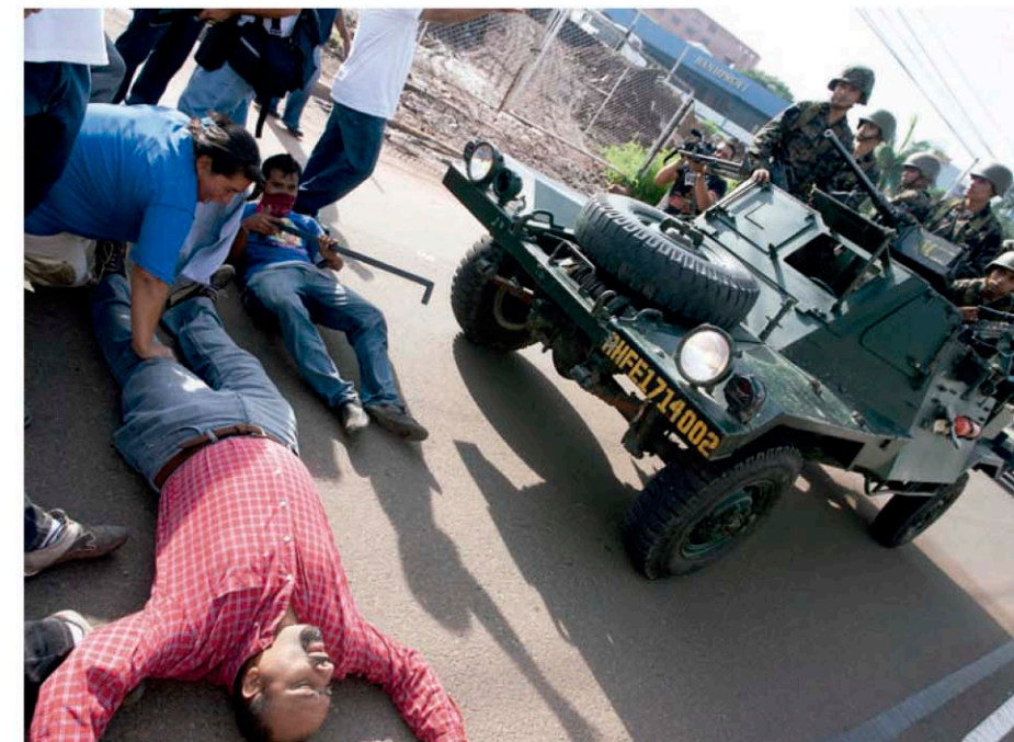
Ciudadanos hondureños forman barrera humana frente a Casa Presidencial.