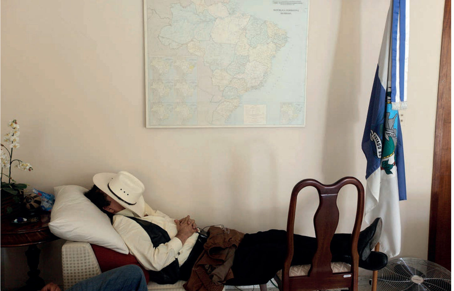
El presidente Manuel Zelaya después de una jornada agotadora de resistencia en la sede diplomática brasileña en Honduras.