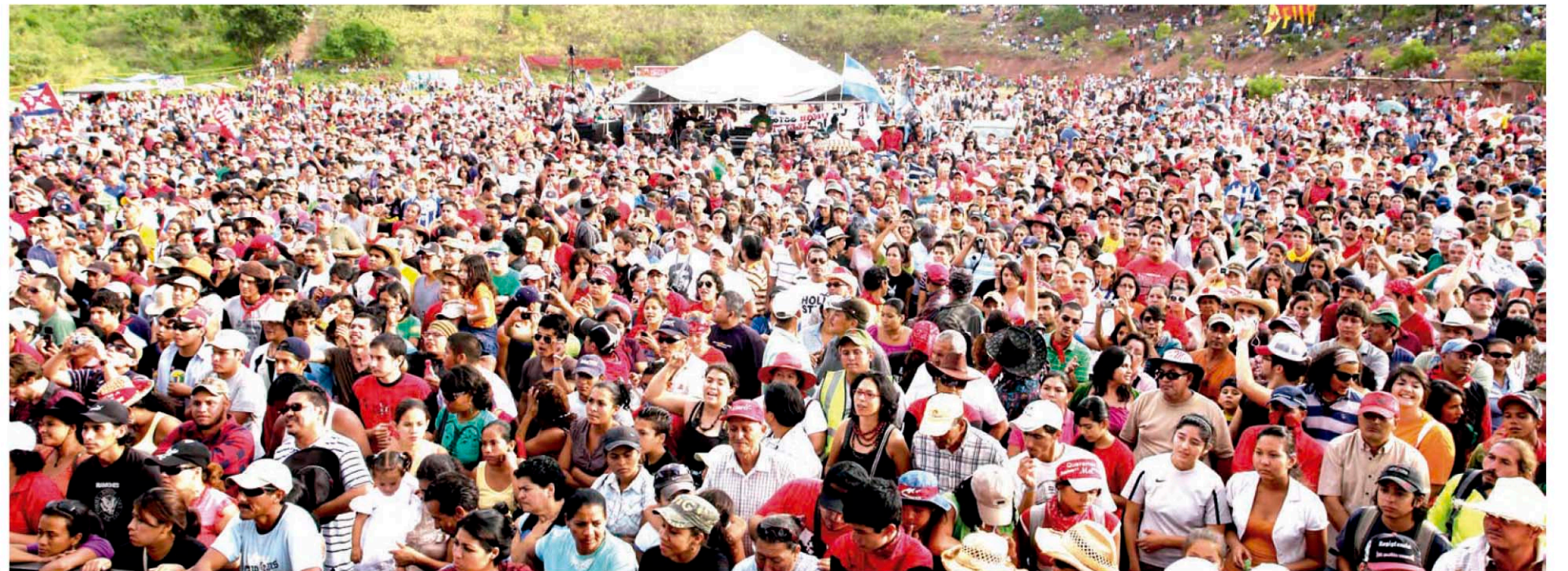
Miles de personas se concentran en protesta contra el Golpe de Estado en Honduras en el concierto “Voces contra el Golpe”