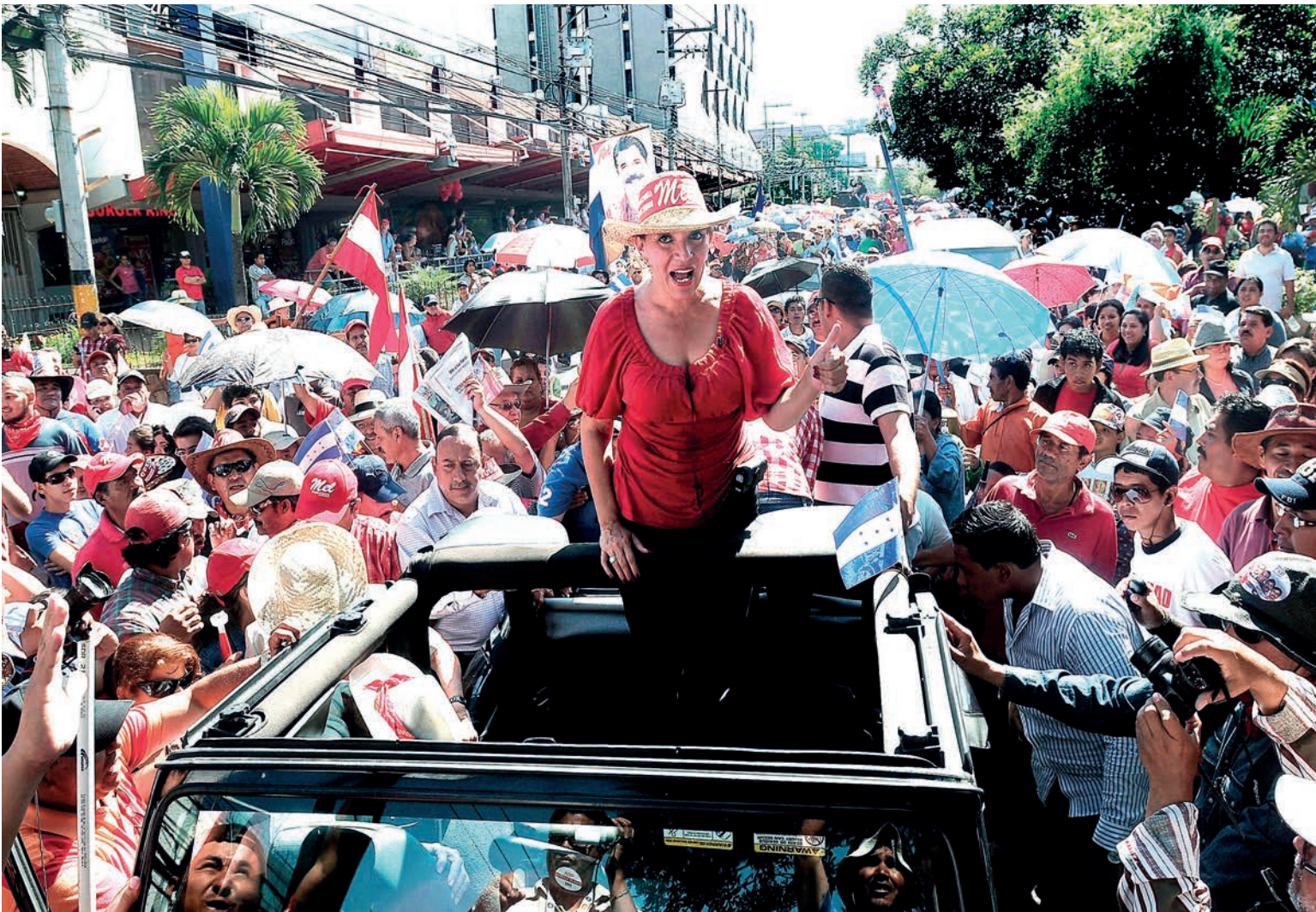
Xiomara Castro Sarmiento arenga una multitud contra el Golpe de Estado.