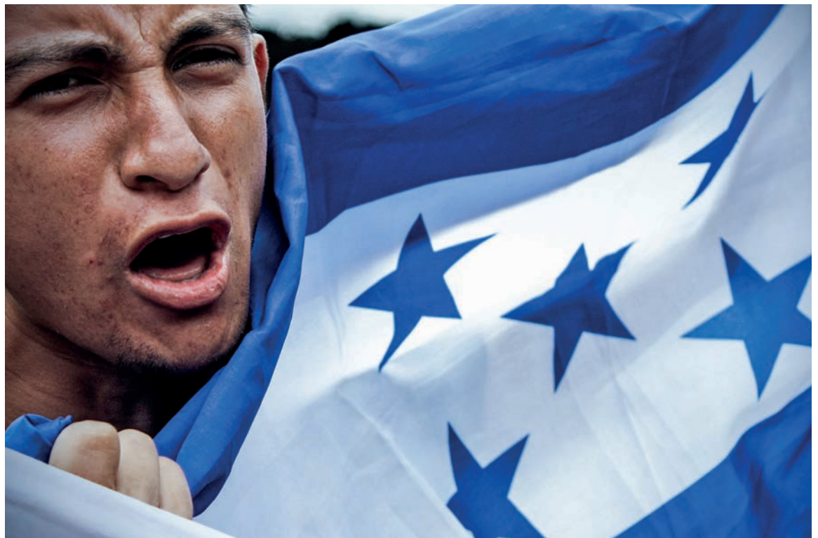
Un joven grita consignas en contra de los grupos fácticos que interrumpieron el orden constitucional en Honduras.