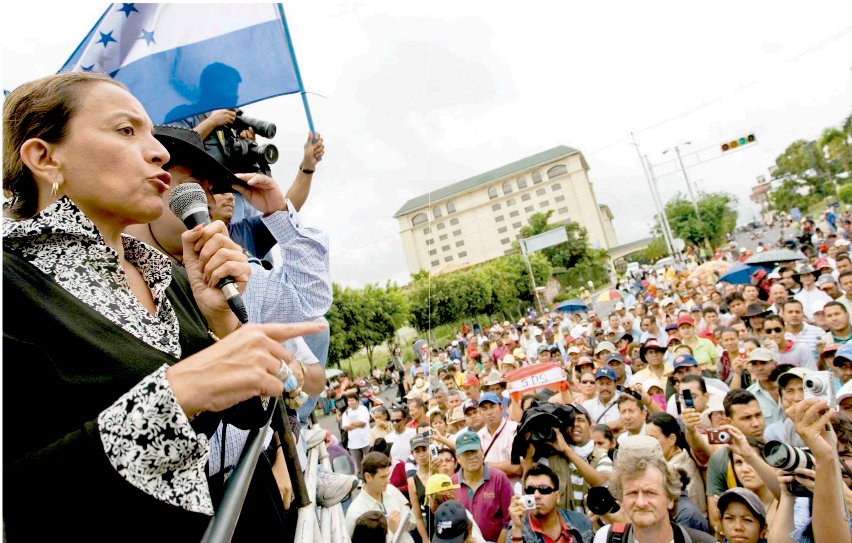
La Primera Dama ahora presidenta de Honduras, Xiomara Castro Sarmiento habla ante su pueblo al encabezar una jornada nacional de protestas en defensa de la democracia, en inmediaciones de Casa Presidencial.