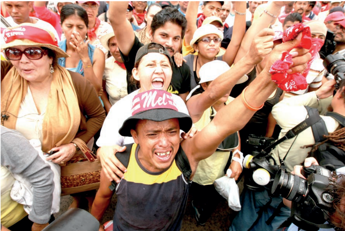
La emoción del pueblo en las jornadas de protesta fue fundamental en la lucha callejera contra los poderes que rompieron la institucionalidad hondureña.