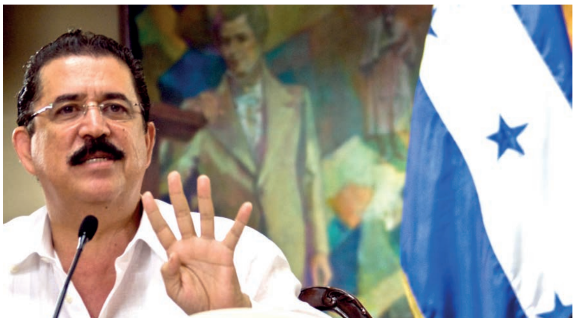
Manuel Zelaya Rosales, presidente de Honduras habla ante representantes de medios de comunicación internacionales sobre el desarrollo de la Consulta Popular en Casa Presidencial.

El 25 de junio de 2009 acompañado de miles de ciudadanos el presidente hondureño Manuel Zelaya dio inicio a un hecho que marcaría la historia de América Latina. Honduras comenzó el camino rumbo a la verdadera democracia y el triunfo popular mediante un mecanismo inédito de consulta ciudadana.