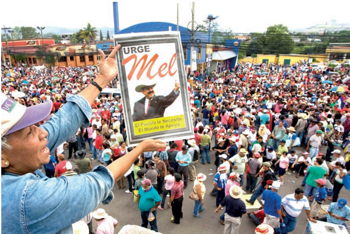
Una mujer muestra un retrato del presidente Manuel Zelaya durante su intento de regresar al país y restaurar el orden constitucional.