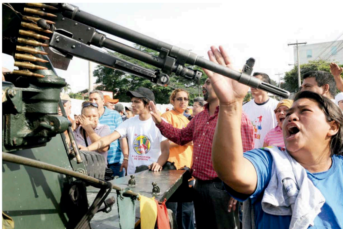
Una valiente mujer enfrenta a militares en una protesta contra el Golpe de Estado frente a Casa Presidencial en Tegucigalpa.

Tras el quebrantamiento de las instituciones por la expulsión del presidente constitucional Manuel Zelaya Rosales, las Fuerzas Armadas de entonces y los grupos fácticos tomaron el control de Casa Presidencial ante la férrea defensa de la ciudadanía que exige la no violación a la Carta Magna. La unión popular enfrentó con razón la fuerza, manteniendo el espíritu consagrado en el mandato ciudadano.