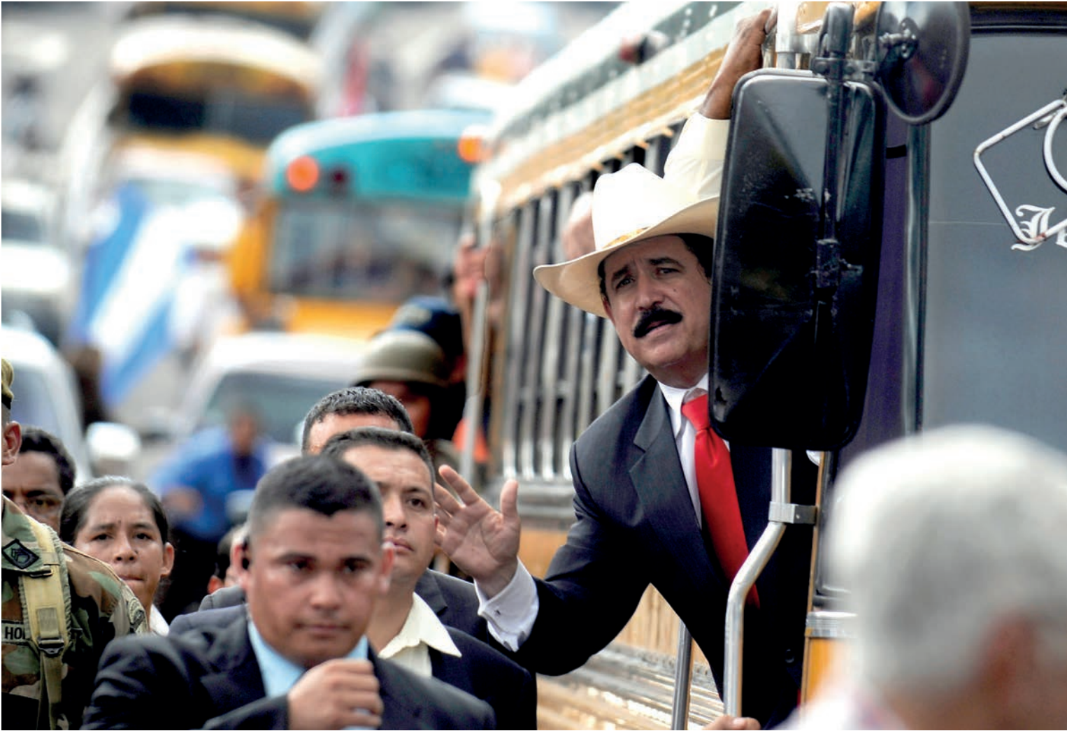
A bordo de una unidad de transporte público, el presidente de Honduras, Manuel Zelaya se dirige a la Fuerza Aérea respaldado por el pueblo para recuperar las urnas que servirían para llevar a cabo la Consulta Popular.