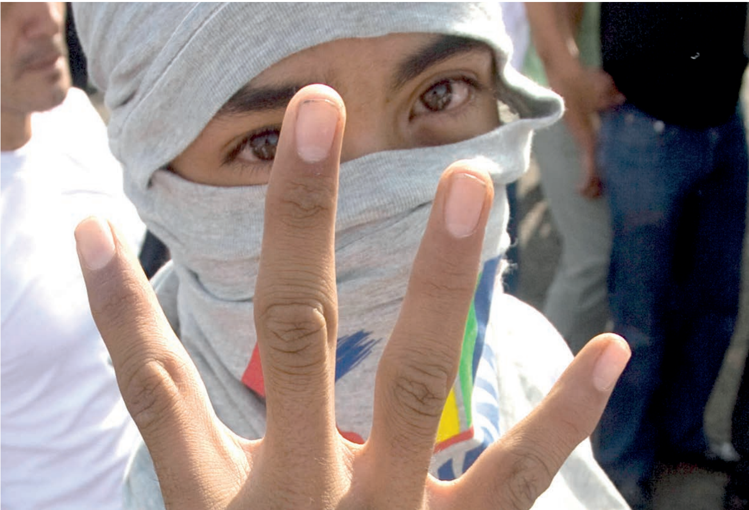
Un niño hondureño con su mano realiza una señal en apoyo a la Cuarta Urna, la Consulta Popular que pretendía otorgar al pueblo el derecho a ser preguntado, la cual fuera decomisada y destruida por las Fuerzas Armadas.