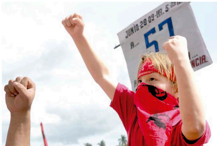
Un padre de familia carga en hombros a su hijo, con lo que quedó demostrado que el golpe de Estado fue repudiado independientemente de la edad y estrato social de los hondureños.

El Golpe de Estado de 2009 despertó la conciencia social y destacando la cultura y el arte. El pueblo defendió férreamente el espíritu de libertad combativa que inició el camino hacia la restitución de la democracia en el país centroamericano.