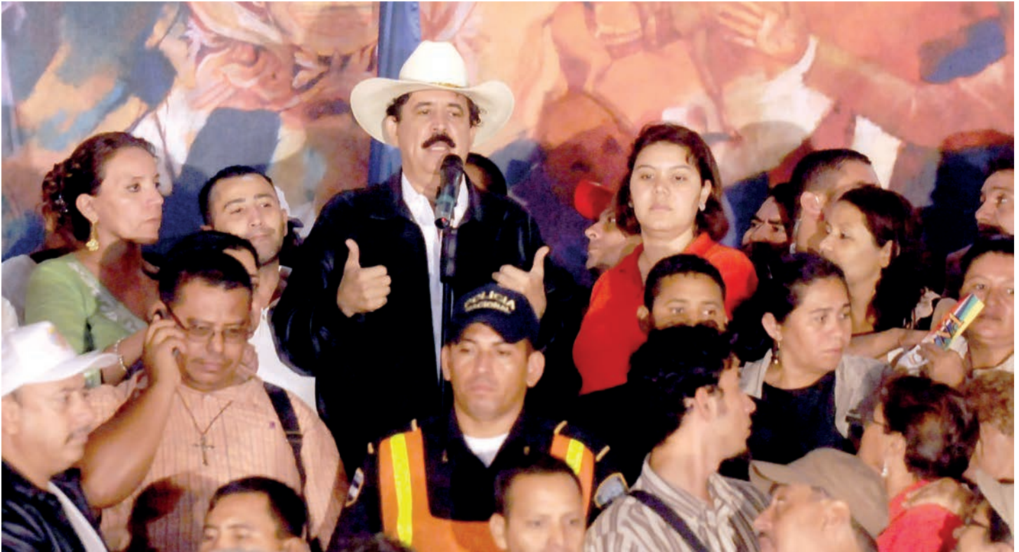
El presidente de Honduras, Manuel Zelaya (centro) acompañado de su esposa Xiomara Castro (izquierda) y de representantes del pueblo, denuncia ante la comunidad internacional la gesta de un Golpe de Estado.

El 25 de junio de 2009 acompañado de miles de ciudadanos el presidente hondureño Manuel Zelaya dio inicio a un hecho que marcaría la historia de América Latina. Honduras comenzó el camino rumbo a la verdadera democracia y el triunfo popular mediante un mecanismo inédito de consulta ciudadana.