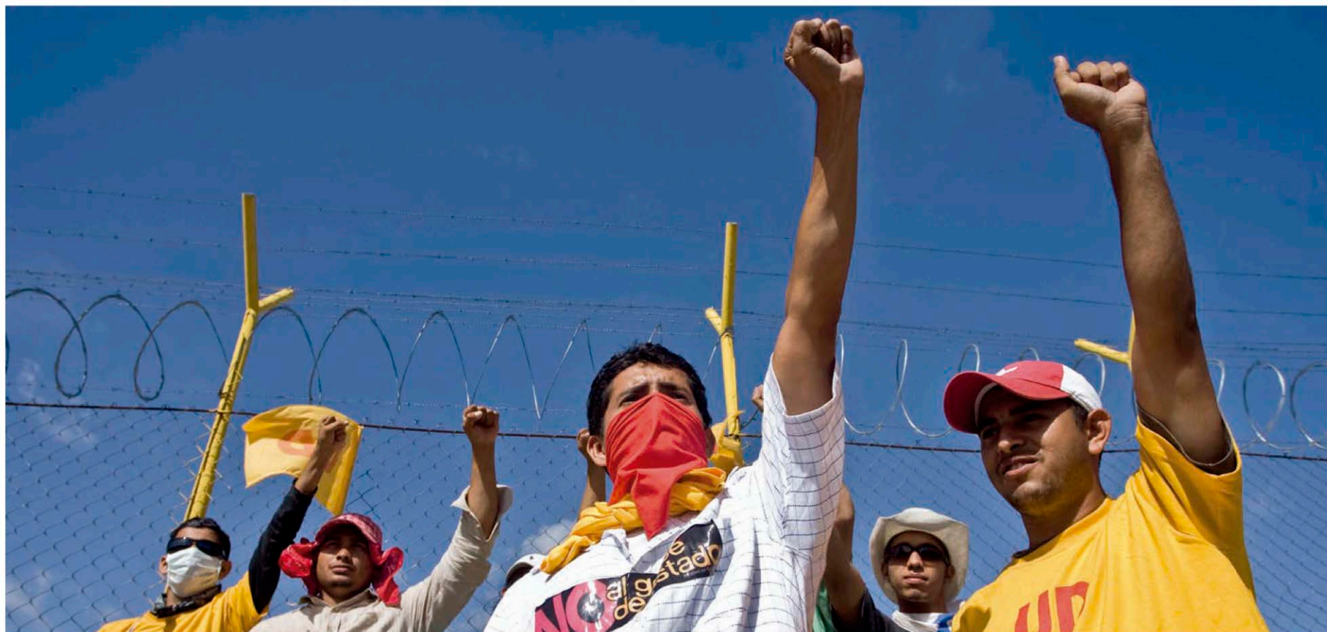
Ciudadanos cantan el Himno Nacional de Honduras durante el intento de ingresar al país del mandatario Manuel Zelaya por el aeropuerto de Toncontín.

Miles de manifestantes encaran a las fuerzas del orden durante la represión que imposibilitaron la llegada del presidente Manuel Zelaya a Honduras.