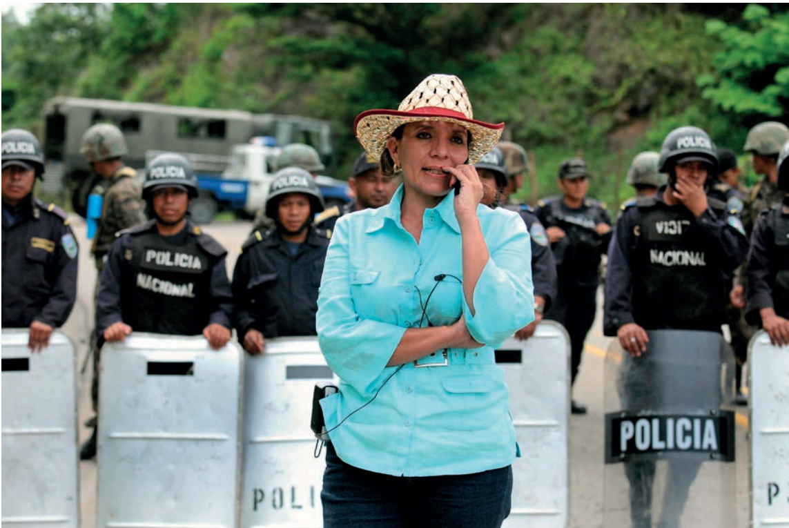
Xiomara Castro sin temor enfrenta los retenes militares en el arribo del presidente constitucional de Honduras, Manuel Zelaya en la frontera con Nicaragua durante un intento por reestablecer el orden.