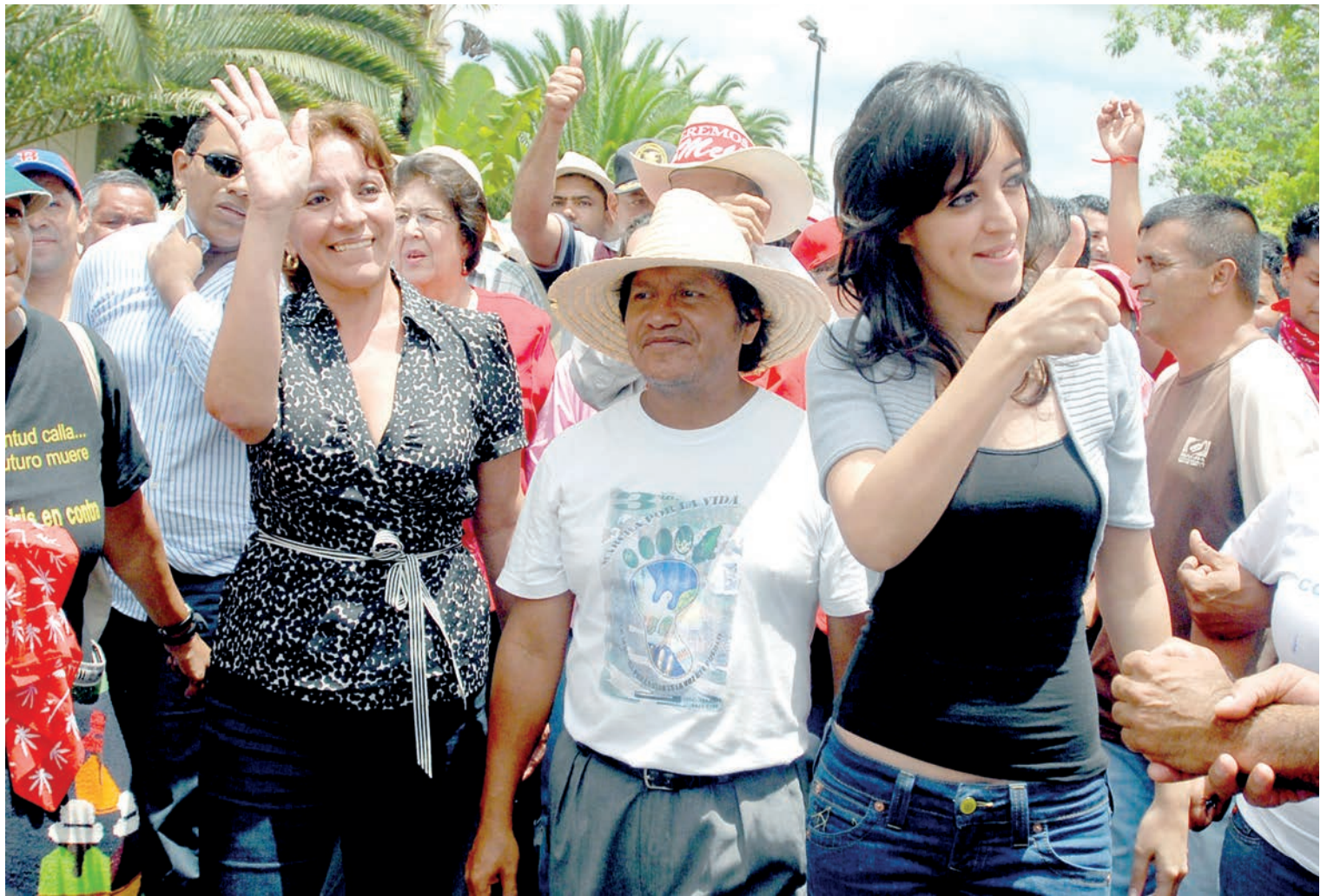
Xiomara Castro acompañada de su hija Hortensia Zelaya, "la Pichu" y el Padre Andrés Tamayo encabezan una marcha contra el Golpe de Estado.