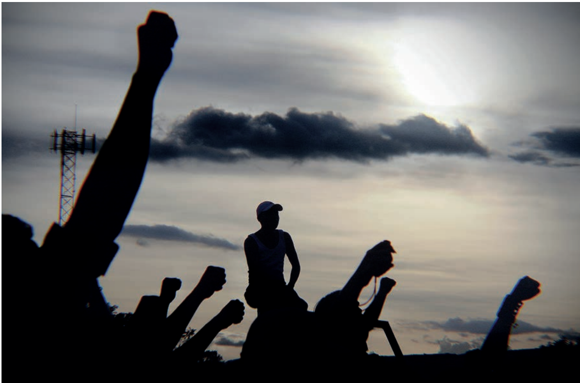
Ciudadanos levantan los puños como señal de protesta contra el golpe de Estado en Honduras durante una manifestación en Tegucigalpa.