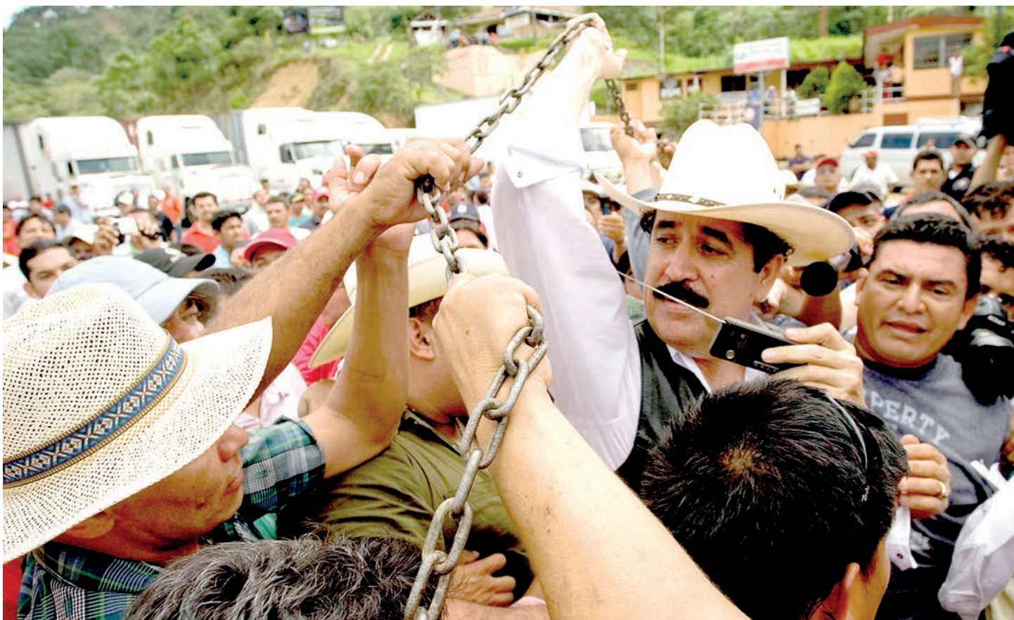
El presidente Manuel Zelaya Rosales levanta la cadena que divide la frontera de Nicaragua, para ingresar a Honduras.