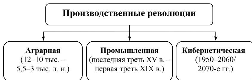
Рис. 1. Производственные революции в истории

Каждая производственная революция включает в себя три фазы: две инновационные (начальную и завершающую) и одну среднюю, располагающуюся между инновационными, – модернизационную (см. рис. 2).